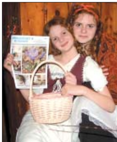
Velikonoční ateliér ve Stránském pod hlavičkou Sovinecka, o. p. s., ve znamení horalských řemesel