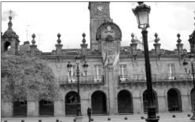
Santiago de Compostela: městský úřad před katedrálou

Večer jsme konečně dorazili do Santiaga de Compostela. Tato zastávka byla jedním z důvodů, proč jsem si zájezd koupil. Santiago de Compostela znamená v češtině svatý Jakub z Hvězděného pole. Po své smrti se Ježíš Kristus zjevil učedníkům a řekl: „Jděte do celého světa a zvěstujte slovo Boží.“ Jakub šel na kraj tehdejšího světa, do Španělska, a zasel tam semínko křesťanství. Povedlo se. Potom