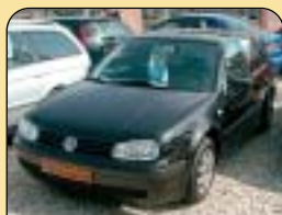
DIGI KLIMA DIESEL 4X4

Škoda Octavia TDi, CZ, servis, r. v. 1997, 2x airbag, ABS, rádio, centrální, el. šibr, PC, zám. řad. páky, mlh., el. okna a zrc. Cena: 149 900 Kč.