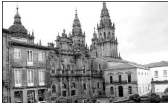
Katedrála v Santiagu de Compostela

Večer jsme byli ubytováni za městem v jedné obrovské ubytovně snad pro 1 500 poutníků i víc. Byly to přízemní budovy v dlouhých řadách nalevo i napravo od spojovacího středověkého chodníku. Připadalo mně to jako v oploceném trestaneckém