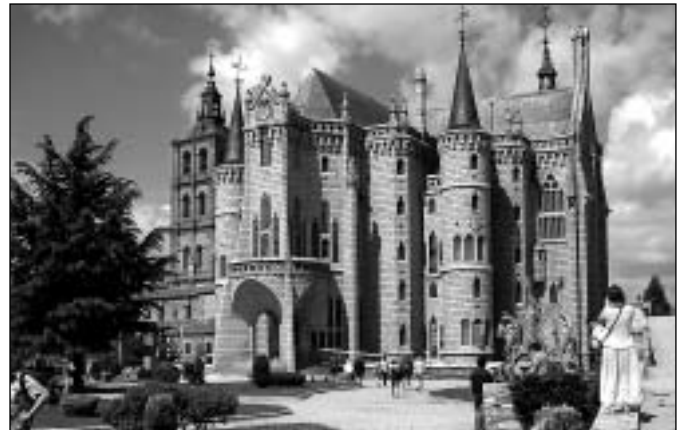
Astorga: Gaudiho dříve biskupský palác, dnes muzeum

Nedaleko je klášter, noclehárna i dřívější nemocnice, dnes drahý hotel. Co by kamenem dohodil stojí původní biskupský palác, nyní muzeum poutníků cestujících do Santiaga de Compostela. Stavěl ho architekt Gaudí. Podle toho také palác vypadá. Gaudí se řídil heslem „V přírodě není nikdy nic stejné“. Všechno měl dobře promyšlené, propracované. Také do tohoto paláce bych se rád podíval, ale nestihl bych to do srazu k autobusu. Je zde prý také krásný obraz královny Luparie, která dělala drahoty s pohřbíváním svatého Jakuba roku 44. Byla pyšná, krvelačná