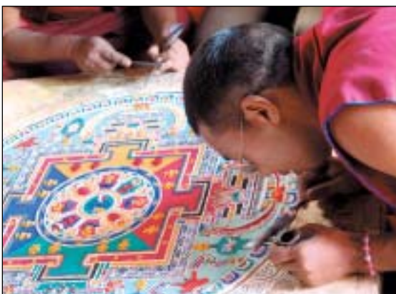
Sypání pískové mandaly