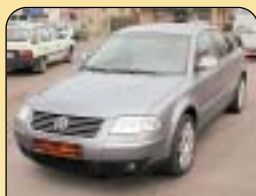
DIGI KLIMA DIESEL 4X4

Volkswagen Golf 1.4, r. v. 1998, 2x airbag, ABS, rádio, el. stř. okno, posil. říz., PC, tažné, imob., el. okna a zrc., centrální. Cena: 154 900 Kč.