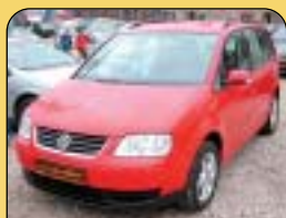
DIGI KLIMA DIESEL

VW Touran COMFORT, super stav, r. v. 2005, 10x airbag, ESP, ASR, ABS, CD, rádio, imob., el. vyb., posil. říz., PC, cent. temp. Cena: 429 900 Kč.