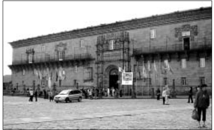
Santiago de Compostela: středověká královská nemocnice, dnes hotel

Poutníci přicházejí do Santiagu de Compostela z celé Evropy i ze zámorí. Jdou z jihu, z východu a nejčastěji ze severu