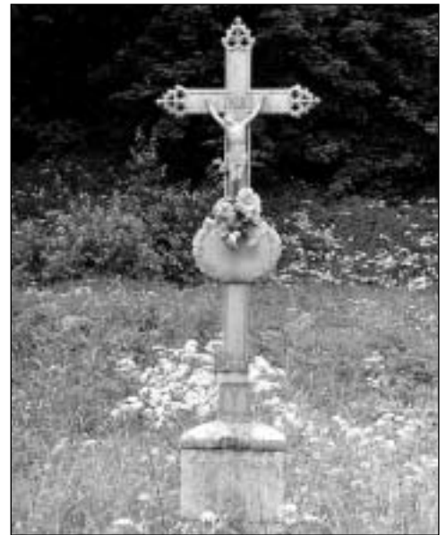
Litínový kříž připomíná místo, kde stál luteránský kostel