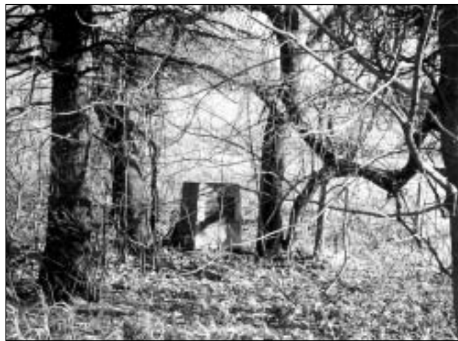
Sokl kříže před místem původního tylovského kostela

Po spálení luteránského kostela byl 77 kroků (!) od spáleniště postaven kostelík, přesněji asi dřevěná zvonice opatřená zvonec. Ve zvonici bydlel ponocný. Snad ještě dodejme, že po roce 1621 byla farnost v Tylově zrušena a farníci převedeni do vedlejší Lomnice. Jenže ani tam nebyl katolický kněz a tak se povinných bohoslužeb účastnili lidé z Tylova až v dalekém Jiřkově. Vycházelo se ráno ve 3 hodiny a křížem krážem přes kopce po do nedávné doby v terénu ještě patrně „kostelní pěšíně“ maširovali Tylovští vstříc náboženským povinnostem. Povinností rychtáře bylo provést „kontrolu počtů“ před odchodem a pak ještě před započítáním vlastních bohoslužeb na místě. Stávalo se, že při tomto společném pochodu někdo zemřel a místo pro pochování bylo buď Jiřkov nebo Ryžoviště. Na lomnický hřbitov se nenosili. Ono totiž ani v Lomnici fara nebyla a teprve po jejím obsazení za vlády Josefa II. příslušel Tylov církevně do Lomnice, což trvá dodnes. Od těch dob se Tylov, tehdy nazývaný Tylov na Moravě, už nijak nepovzněl a zůstal nadále malou vsí.