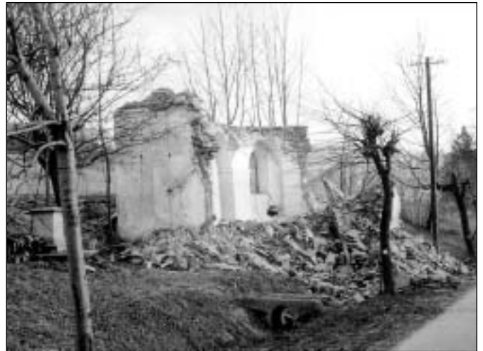
Bourání kostela v r. 1958

V r. 1880 měl 350 obyvatel, v r. 1900 asi o pět více a pak už to šlo jen směrem dolů, i když domů přibývalo. V r. 1950 zde bylo evidováno 70 domů s 198 obyvateli. Ve známé akci za očistění pohraničí od zbořenisk bylo i zde odstraněno 36 stavebních ruin a tak se postupně došlo k dnešnímu počtu přibližně 25 stavení včetně tří bytovek, ve kterých bydlí větši-