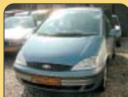
DIGI KLIMA DIESEL

Opel Vectra 2.0 16V, CZ, r. v. 1997, 2x airbag, ASR, ABS, rádio, posil. říz., tažné, el. zrcátka a okna, centrální. Cena: 84 900 Kč.