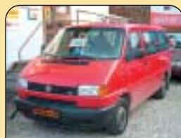
DIESEL 5 MÍST

VW Passat 2.5, HIGHLINE, 132 kW, 1. maj., r. v. 2004, 8x airbag, xenony, ESP, ASR, ABS, el. vybava, PC, centrální, CD a další. Cena: 484 900 Kč bez DPH.