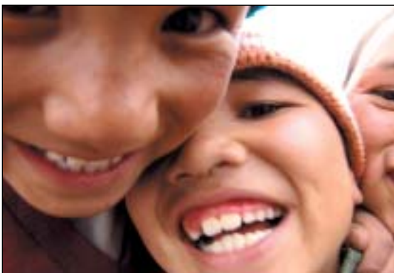
Malí mniši z kláštera Lam