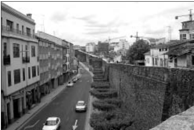
Římské hradby města Lugo