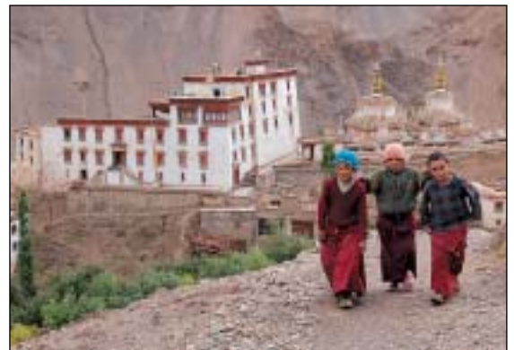
Malí mniši z kláštera Lam, v pozadí klášter