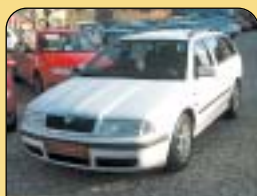
DIESEL KLIMA AUTOMAT

Fiat Brava 1.6i, 1. maj., r. v. 1996, rádio, posil. říz., zadní stěrač, centrální, el. okna. Cena: 89 900 Kč.