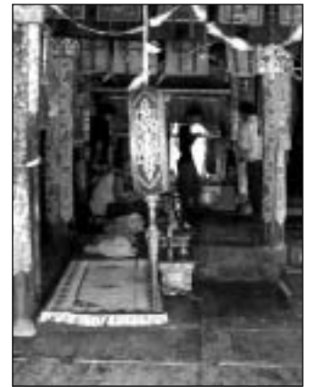
Interiér kláštera (gonpa)