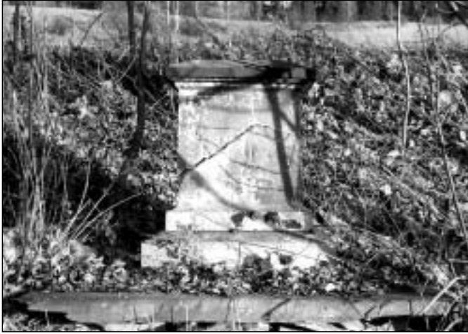
Sokl kříže před místem původního tylovského kostela