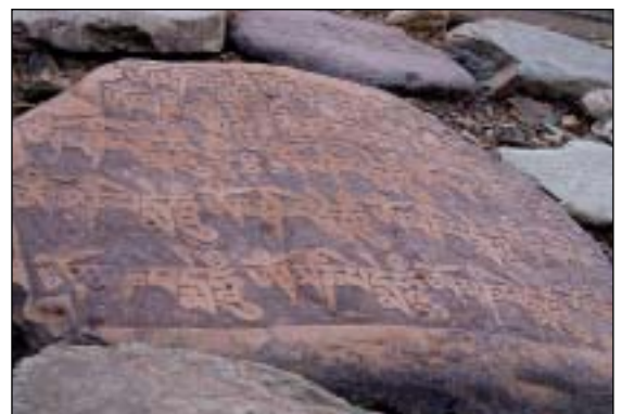
Kameny s vytesanou mantrou (om mani padme hum = něco jako: poklade květu lotosu)