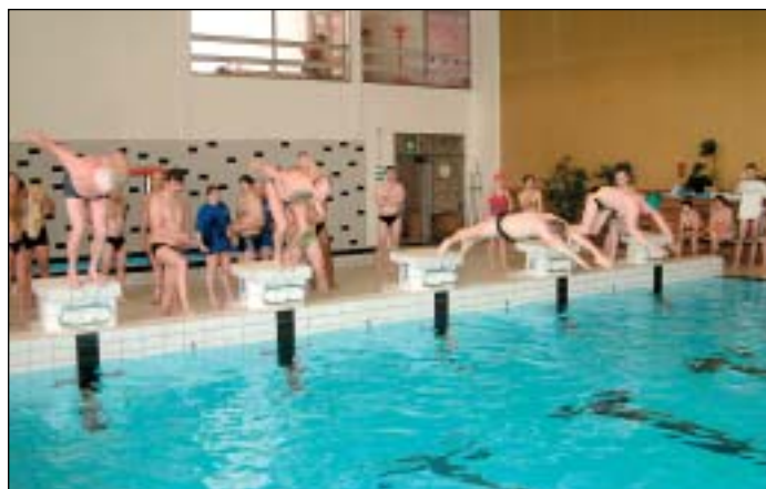
Rýmařovští desetibojaři bojovali o další cenné body v krytém bazénu v Břidličné