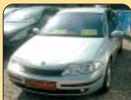
DIGI KLIMA DIESEL

Renault Clio 1.5 dCi, 1. maj., r. v. 2005, rádio, pos. říz., PC, multif. volant, tep. lom. temp., 4x airbag, ABS, CD, el. okna a zrc., centr.. Cena: 199 900 Kč.