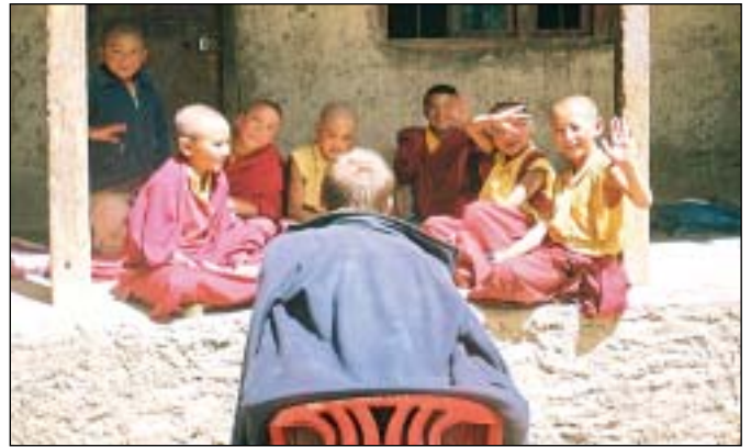
Výuka matematiky v budhistickém klášteře

chají, že se za ničím tak nesmyslně nehoní jako my. Brzo jsme zjistili, že se jich nemusíme bát, že nás neokradou ani nepřepadnou. Zřejmě tak nějakým způsobem dodržují zásady svého náboženství - hinduismu. I když prodát