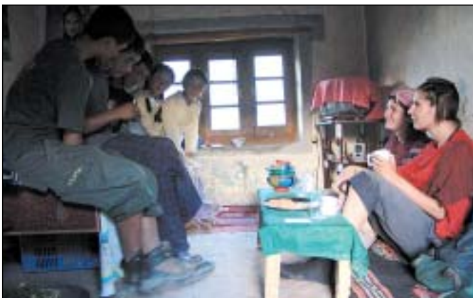
Na návštěvě u místních (ve vesnici Basgue)