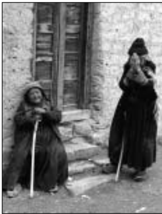
Místní ženy z Lam