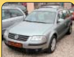
DIGI KLIMA DIESEL

Citroen Berlingo 1.9D, CZ, 5 míst, r. v. 1997, imob., el. okna, centrální, zadní stěrač, rádio, posilovač řízení. Cena: 114 900 Kč.