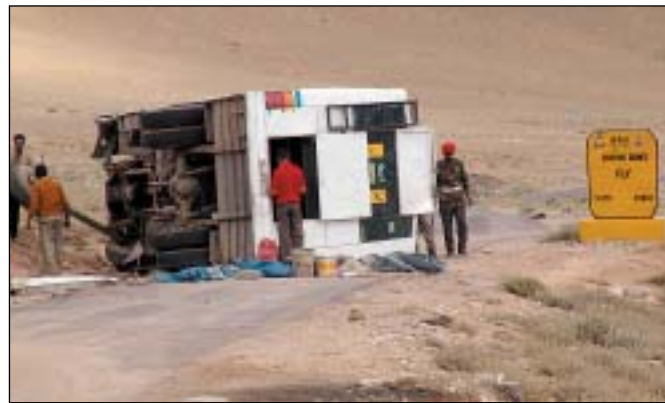
Na cestě přes hory

V Dillí jsme se ocitli ve dvě v noci, a sotva jsme vylezli před letiště, ovanulo nás vedro a oblečení se nám potem přilepilo k tělu. Okamžitě nás obklopili taxikáři a nabízeli služby. Dostali jsem se do centra místním autobusem. Centrum starého Dillí sestává z jedné ulice a vlakového nádraží. Pamatuju si, že všude spali lidé. Na ulici na zemi, na střeše auta, na sedátku cyklorikši... A my se ocitli v noci uprostřed toho všeho a neměli potuchy co dál. Naštěstí ale se hned nabídl nějaký Indové, že nám zařídí hotel a další služby. Zvedli roletu jedné zavřené míst-