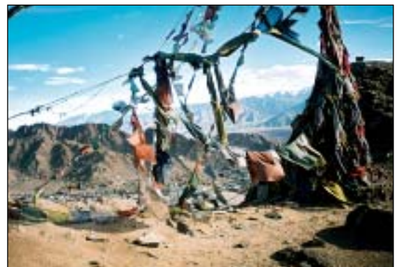
Modlitební praporky nad Lehem (hl. město Ladakhu)