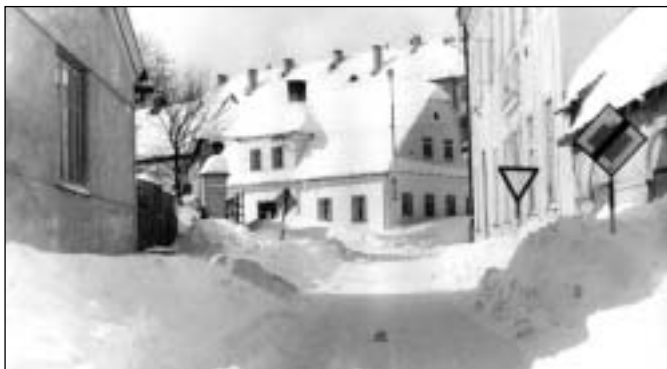
Zima v Rýmařově - únor 1970

Finanční příspěvek ve výši 10.000,- Kč schválila rada města Církvi českoslo-