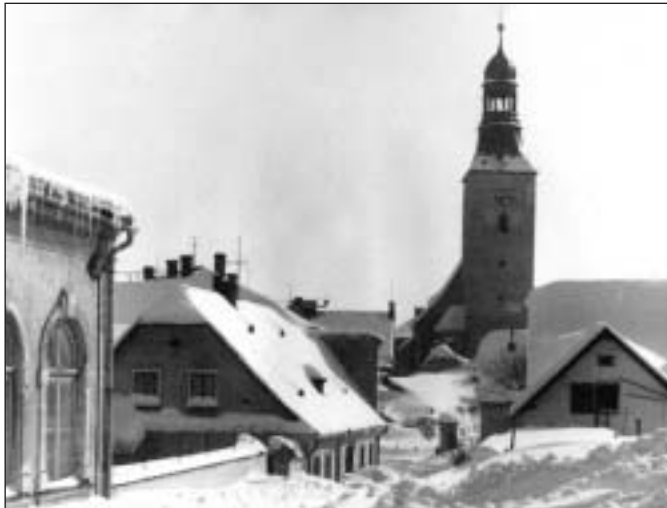
Zima - únor 1970