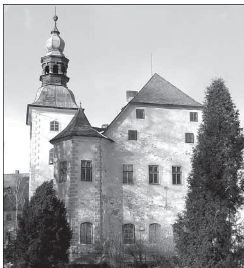
Renesanční křídlo od východu