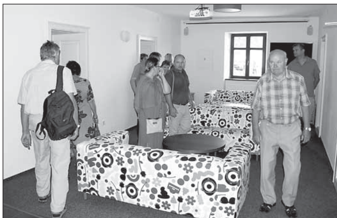
Interiéry nového penzionu navštívila veřejnost