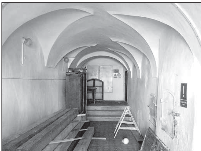
Hřebínková klenba v boční chodbě v přízemí

(Karel, J.: Zámek Janovice u Rýmařova, Střední Morava , sv. 28, Olomouc 2009; Týž: Renesanční nález v Janovicích, Střední Morava 5/97, Olomouc 1997; Týž: Kde skončily zámecké sbírky z Janovic? , RRI 7/98 – září 1998; Týž: Podivná konfiskace harrachovského majetku v Janovicích (1945–1947) , Rýmařovský horizont 17–20/01, Rýmařov 2001; Týž: Podivná konfiskace harrachovského majetku v Janovicích, StM, Olomouc 10/2000, Olomouc 2000.)