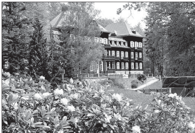
Lotrinský lázeňský dům – Slezský dům