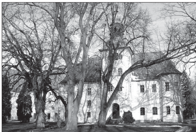
Renesanční část zámku od jihu

Vzdálený, větrný a izolovaný Rabštejn nemohl uspokojit vkus bohatého muže, stejně jako patrně skrovná žerotínská tvrz, a proto zahájil