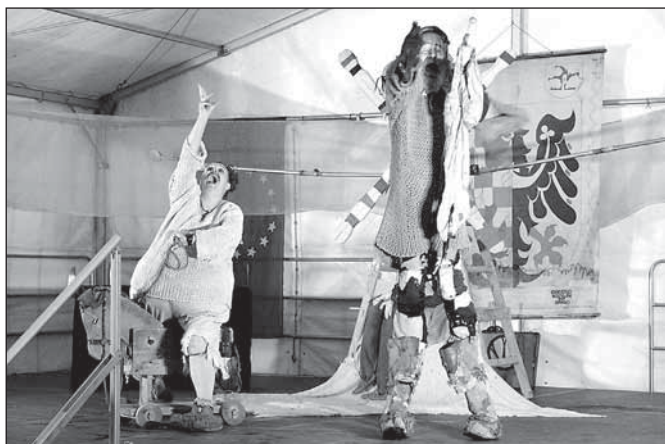
Herci Divadla Klauniky Brno v představení Don Quijot de la Ancha

Pro letošní festival byly připraveny čtyři krátké filmy různých žánrů. První z nich byl kompilačně-fotoprezentační videoklip kolorovaných fotografií v režii Ondřeje Čížka, který se vrací k letošního 75. výročí vylodění v Normandii, druhý film o osamělém režisérovi ochotnického divadla na maloměstě a volbě, které v den demieury musí čelit, natočil Marek Čermák. Film se dostal do širší nominace na Českého lva. Do užší nominace mezi pět nejlepších na ocenění Českým lvem se dostal film Adama Martince, Cukr a sůl o životě a smrti jedné party dospělých mužů. „Film