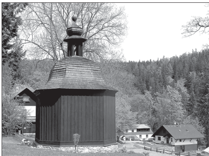
Kaple sv. Huberta

z nejstarších vypráví o starém poustevníkovi, který kdysi dávno žil ve zdejších lesích. Byl to velmi zbožný a moudrý muž, a protože kromě silné víry v Boha děkoval za svůj poklidný život i zdejší přírodě, rozhodl se vyjádřit svou vděčnost patronu lesů sv. Hubertovi. K jeho počtě vystavěl ne daleko poustevny kapličku. Po nějakém čase, právě když byl ponořen v hlubokou meditaci, se před ním zjevil jelen se zářícím křížem mezi parohy. Na hřbetě mu seděl muž v zelené kamizole. Oslovil užaslého poustevníka a poděkoval mu za to, že mu postavil kapli. Potom