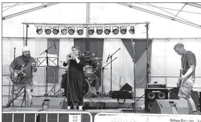
Sobotní hudební část Skatastrofy zahájila rýmařovská kapela Sifon Bombs