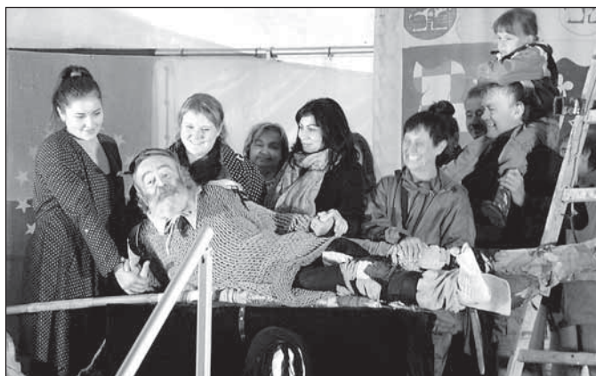
Brněňští herci angažovali do hry značnou část obecnstva ve významné improvizaci