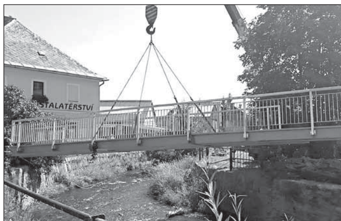
Lávka spojující Bartákovu ulici s ulicí Máchovou

Práce provedla rýmařovská firma STAS, v. o. s., která zvítězila ve výběrovém řízení s nabídkovou cenou 968 670,27 korun vč. DPH.