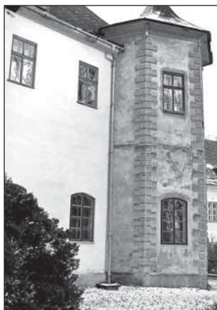
Rohová věžice od jihozápadu