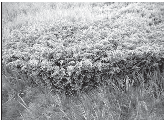
Jalovec obecný nízký, výrazně světlomilná dřevina, dobře snášející extrémní teploty; pod Jelením hřbetem (1340 m), 16. 6. 2018

Zaměříme se však na vegetaci. Už na první pohled je patrné, že je diametrálně odlišná od vegetace v nižších polohách, a mnohý laik