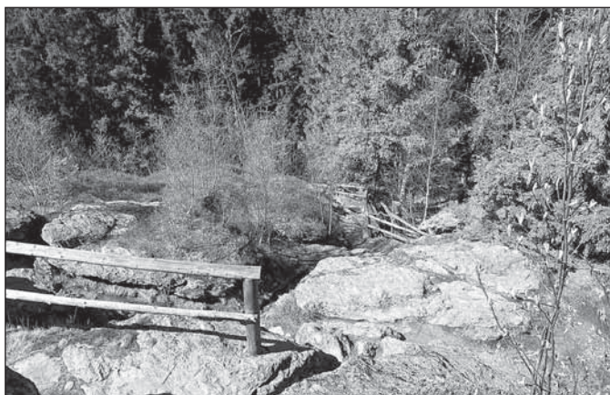
Cesta na vrchol Rolandova kamene je místy krkolonná