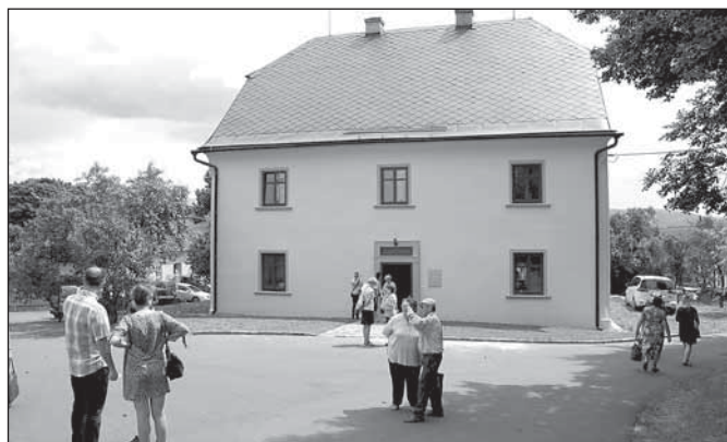
Přestavba starého barokního domu bývalé fary na penzion probíhala přibližně dva roky