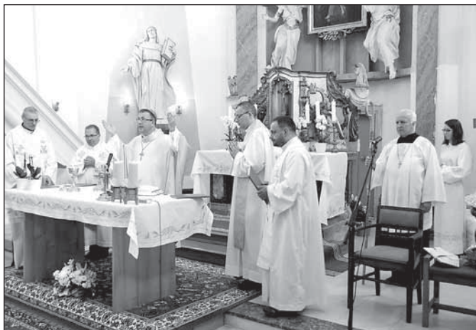
Mše svatá v kostele Panny Marie Sněžné

Ruda u Rýmařova patří k významným poutním místům v našem kraji. Před desítkami let se sem sjížděli poutníci ze vzdálených míst. Podle pamětníků do Rudy přicházely i více jak tři tisícovky věřících. Dnes zájem pozvolna klesá, místo však stále přitahuje poutníky i turisty.