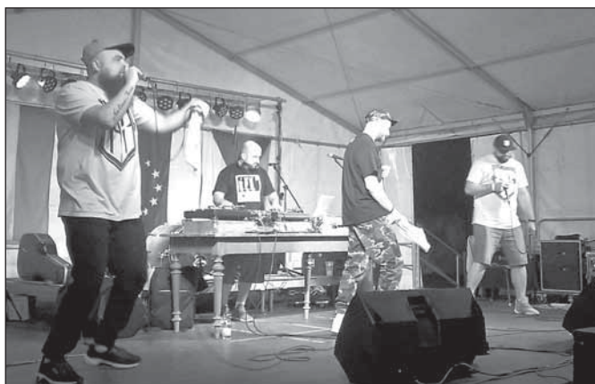
ERROR Brygada dorazila z polského Opole