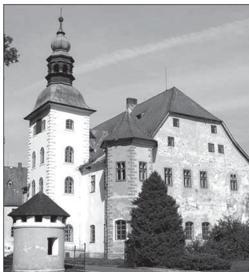
Dochovaná renesanční část zámku Janovice od jihovýchodu