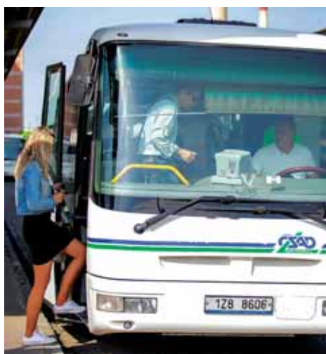
Linka Ostrava – Šumperk zůstává v provozu (odjezdy z Rýmařova)