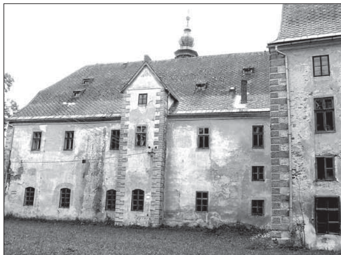
Nejstarší trakt od severu

že jde o poslední zbytky předchozí tvrže, nelze to prokázat, neboť analogické klenby připomínající konstrukci rýmařovských právoárečných sklepů (14.–16. stol.) se budovaly po dlouhé časové rozmezí nejméně od románských staveb po 18. století, na druhé straně se obvykle nehloubily pod stojící budovou, ale zároveň se základy. V oválné kartuši univerzitní teze lze sledovat též zámeckou zeď otevřenou vně jedinou branou, přístupnou zřetelně přes Podolský potok.