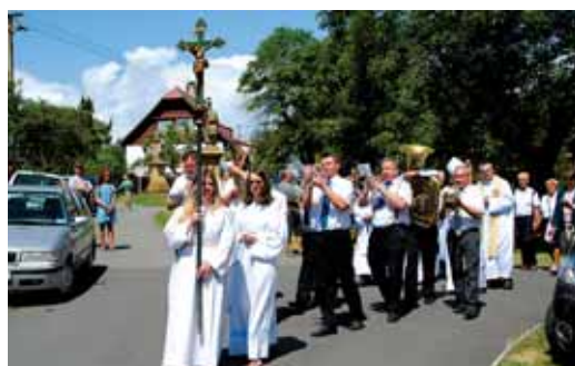
Na pouti v Rudě byl vysvěcen a otevřen penzion v budově bývalé fary