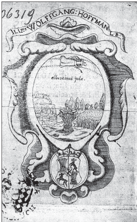
Titulní strana Bellmanovy univerzitní teze se zámek Janovice z roku 1661, v pozadí mohutný Rabštejn

Mohutné kamenné zdivo zámku doplňují ve skromném množství vsprávký nezvykle tvrdými červenými až nafialovělymi dvakrát pálenými cihlami, tzv. buchtami, typickými už pro středověk (viz Strálek). Renesanční palác pokrývala kvalitní červená prejzová střecha tvořená pálenými bobrovkami, plochými šupinovitými taškami. Okna se blyštěla nazelenalým sklem větších tenkých publik, střídajících se s trojúhelníkovými tvary v rámu oken a rout spojovými olověnými pásky jako u všech vitráží. Pokud vystoupíte do nejvyššího patra mohutné hranolové věže, kde býval hodinový stroj, s údivem zjistíte, že se vymyká všem ostatním objektům sídla, tvoří jej totiž hrázděné zdivo. Původně i vně zřetelnou dřevěnou konstrukci vyplnily obvykle dřevěné špalíky často ovinuté koudelí (později cihly) a plochy mezi břevny spojila vně i uvnitř pečlivě hlazená malta. Také rohová věžice vykazuje znaky architektury 16. století. Nejstarší křídlo zámku je opatřeno klenutými sklepy, kupodivu nepříliš vlhkými prostorami s průduchy mírně vystupujícími nad základy. Třebaže se objevuje tvrzení,