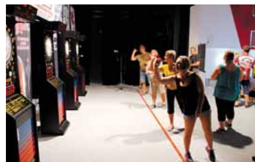
Šipkařský turnaj Darts Open v Rýmařově potřetí, letos za účasti mistra Evropy