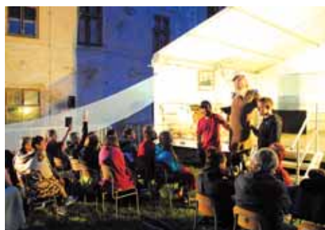
Festival Skatastrofa měl bohatý doprovodný program