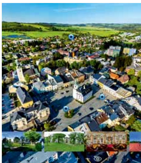
Město nechalo zpracovat virtuální prohlídku Rýmařova