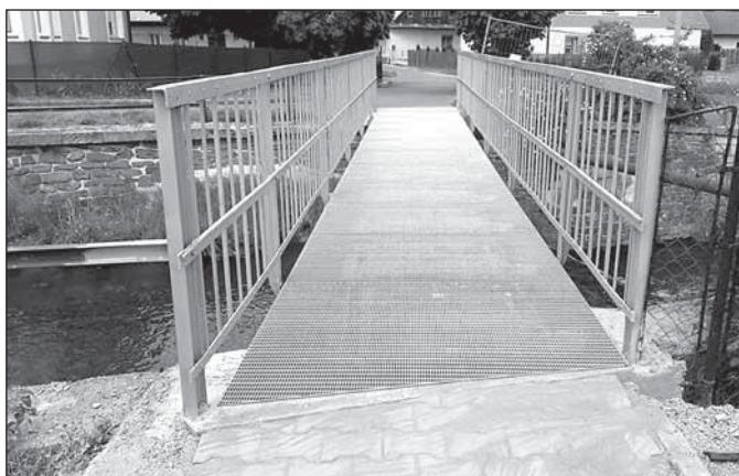
Lávka u Sagapa

Stavební práce zahrnovaly demontáž starých lávek, dodávku nových nosníků, na něž byla na místě přivařena samotná konstrukce lávky, která pak byla pomocí jeřábu osazena na místo. Lávka má nové zábradlí a ocelové pochozí rošty.