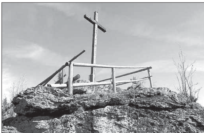
Vrchol Rolandova kamene – dřevěný kříž pochází z 20. let 20. století