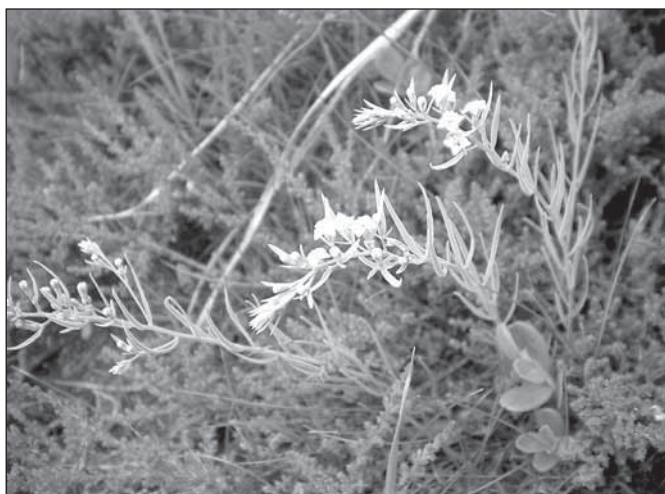
Lněnka alpská, její výskyt poukazuje i na bývalé pastviny; nad Malou kotlinou (asi 1300 m), 16. 6. 2018