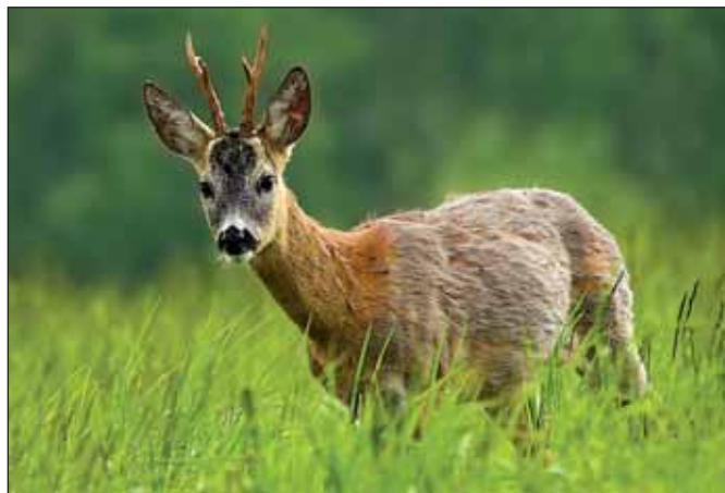
Mladý šesterák v přebarvování