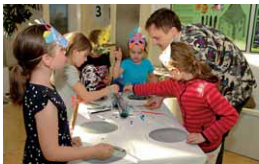
Dvanáctá Muzejní noc byla tematicky zaměřena na Ptáčí svět