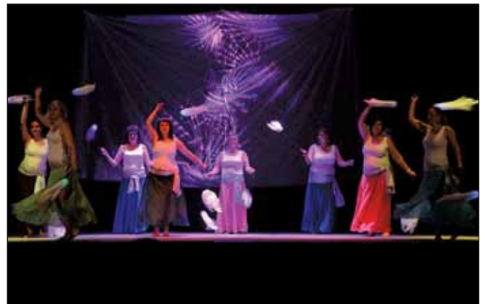
Medusa, choreografie Martiny Kohoutkové