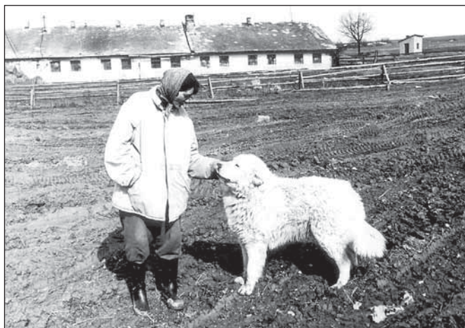
Před vepřínem ve Stránském