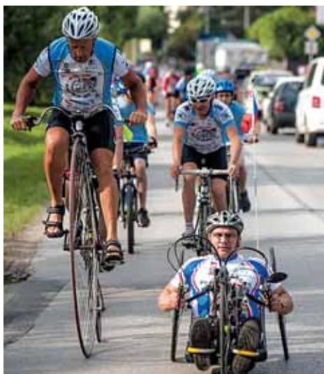
Cyklotour Na kole dětem dorazí i do Rýmařova