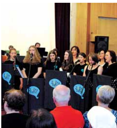
Koncert pro cizince a našince ukončil mezinárodní projekt