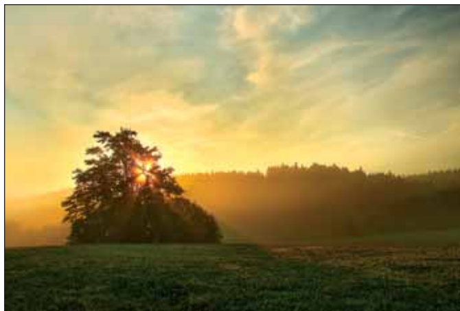
Den se probouzí