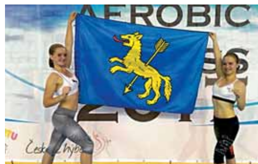
Rýmařov má novou mistryni a vicemistryni ČR 2017 v soutěžním aerobiku