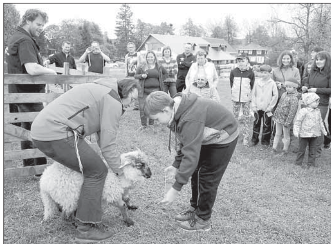
Děti vymyslely jména a ovečky pokřtily

Rýmařovsko docela dobře, když jsme před dvěma lety získali 1. místo. Loni se vyhlášovalo trošku jiným způsobem, přesto jsme byli mezi nejlepšími na 2. až 5. místě. Takže pokračujeme na bedně,“ dodala Vladka Křenková. JiKo