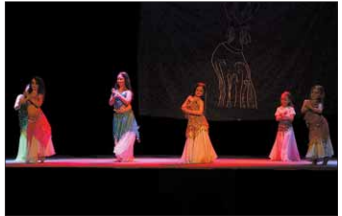
Jasmínky, choreografie Dagmar Gajdošové