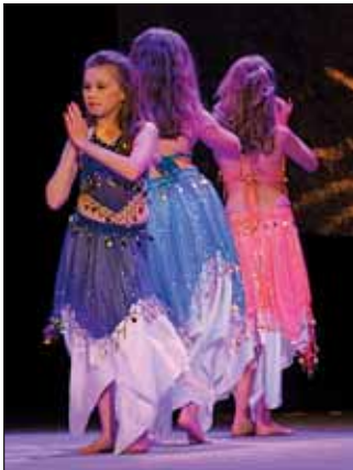
Šehrezádky, chor. D. Gajdošové