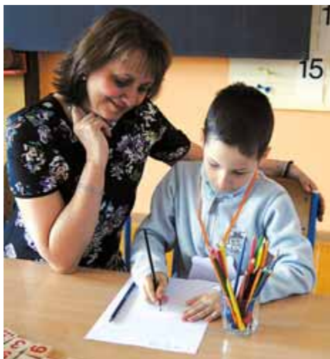
Pozdější zápis rodiče od žádostí o odklad neodradil