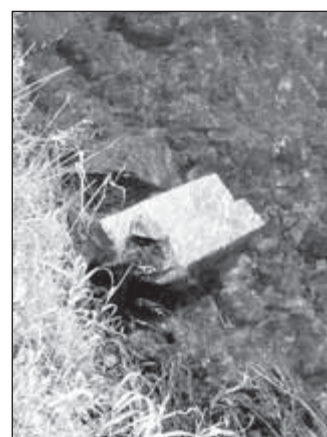
Monitor v Podolském potoce