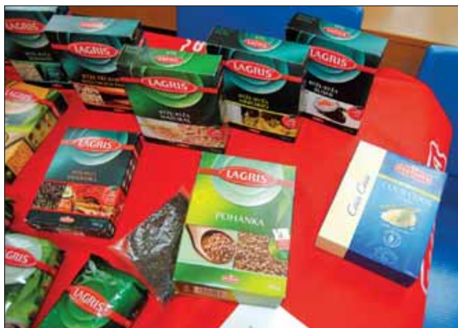
K vidění byly nejrůznější druhy luštěnin