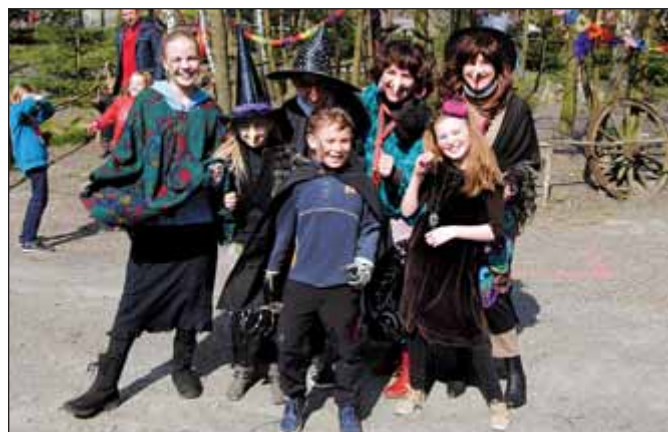
Děti střílely z luku, tančily na diskotéce a dováděly na různých atrakcích.