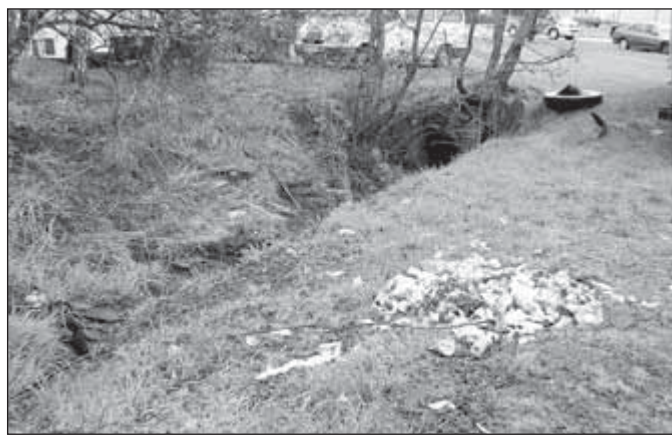
Skládka odpadků u provizorního parkoviště kamionů