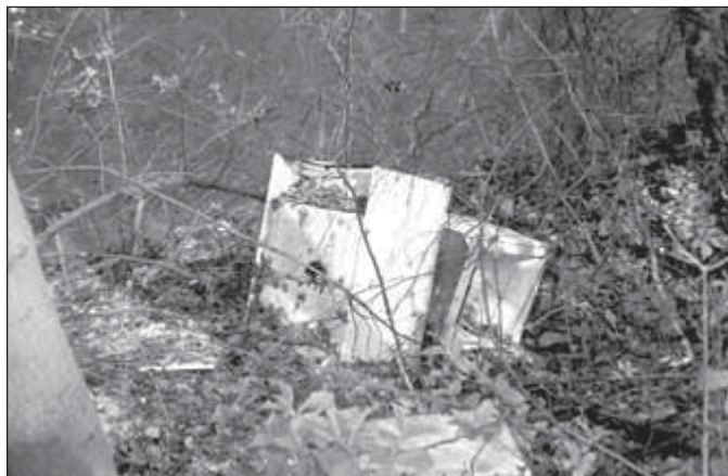
Zahradkářská kolonie za vlakovým nádražím