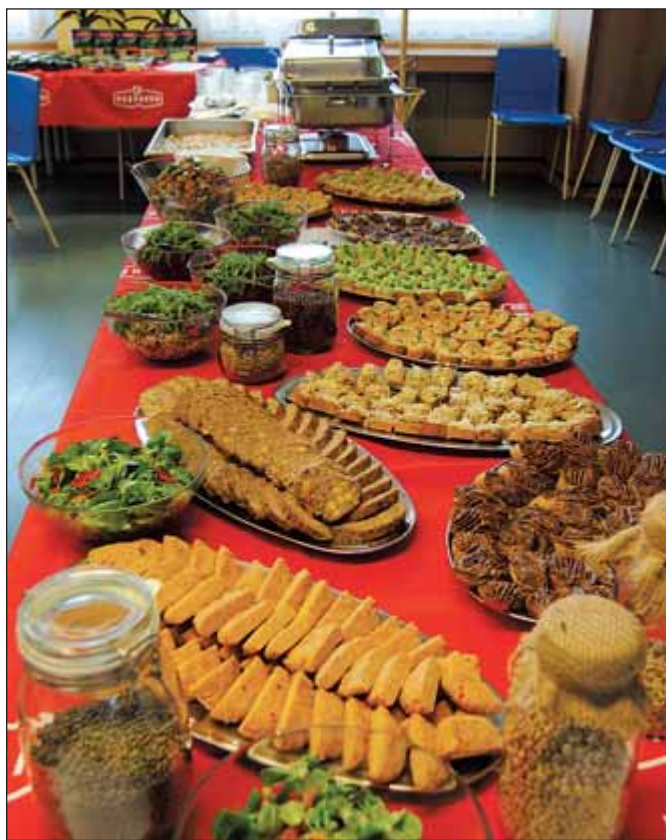
Při ochutávce bylo na výběr šestnáct vzorků, z toho dvě polévky