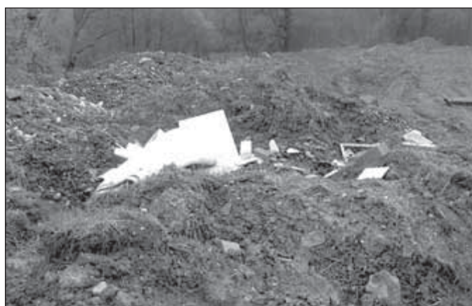
U sběrného dvora