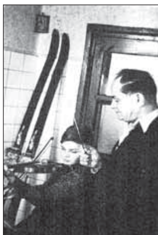
Hodina houslí v kuchyni (hostinec U Labutě v Zeilu)

Já měla jen obavy, co se stane s mým domečkem pro panenky. Jistěže jsem si ho nemohla vzít s sebou, ale ještě mnohem později – i po letech – jsem přemýšlela, jestli je v pořádku a kdo si s ním asi hraje.