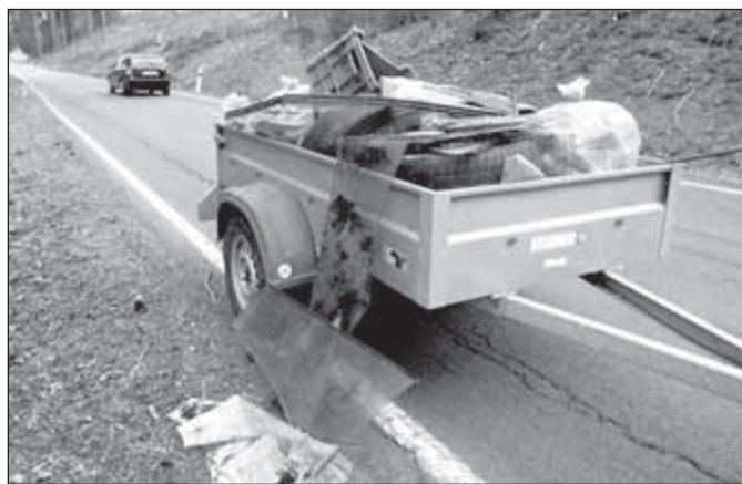
Výsledek sobotního úklidu mezi Malou a Velkou Štáhlí