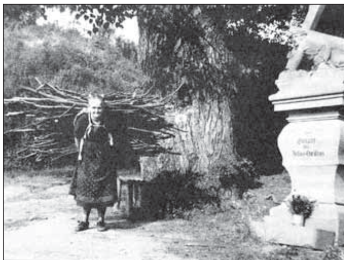
Lieslina matka s otepi dřeva na topení

Tou dobou, kdy jsme bydleli v Zeilu v baráku nad školou, jsem se loudala dolů úzkou uličkou od kostela, když mi naproti přicházel vysoký muž v dlouhém tmavém kabátě. Zarazila jsem se a prohlížela si