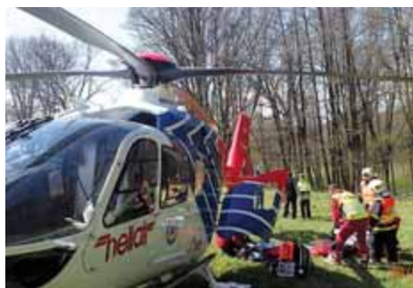
U Tvrdkova sjel automobil do potoka, jeden cestující zemřel