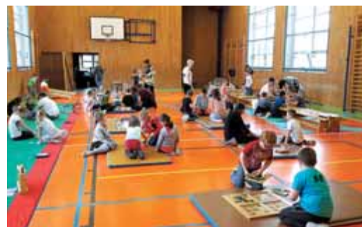
Den deskových her na ZŠ Jelínkova aneb Procvič si ducha i tělo!