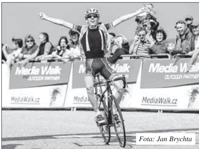
Fota: Jan Brychta