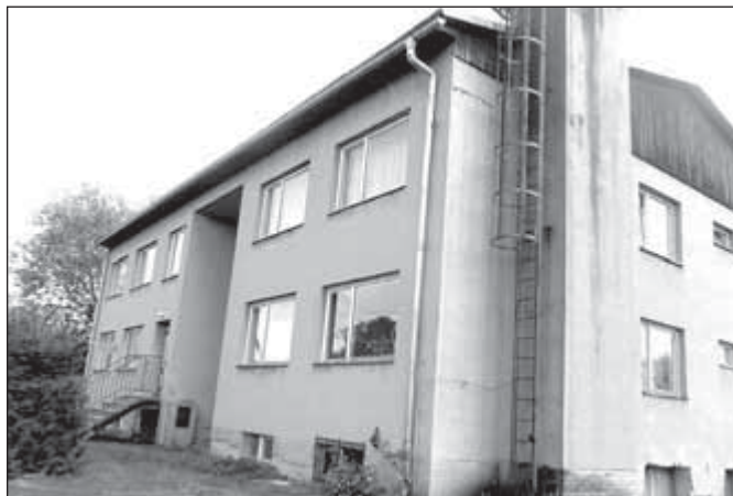
Bytový dům na Opavské ulici v Janovicích