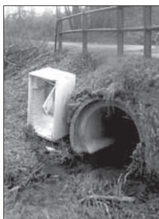
Mezi Jamarticemi a Velkou Štáhlí