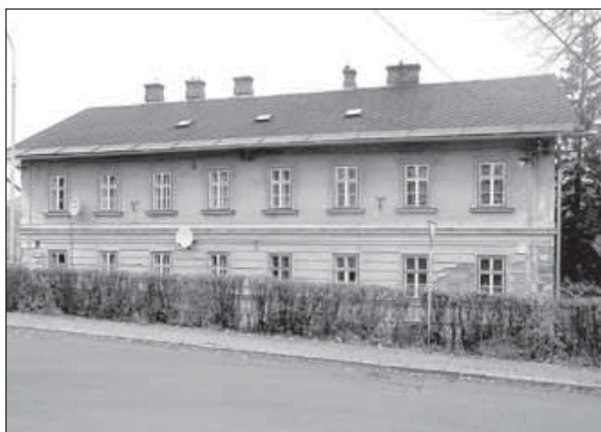
Bytový dům na Nádražní ulici č. 1