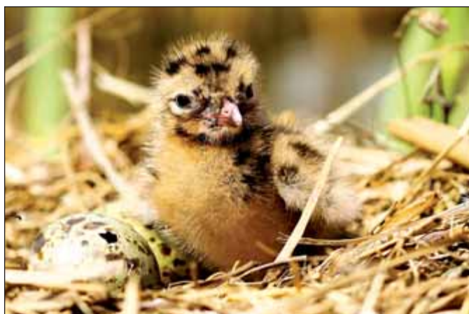
Mládě racka chechtavého