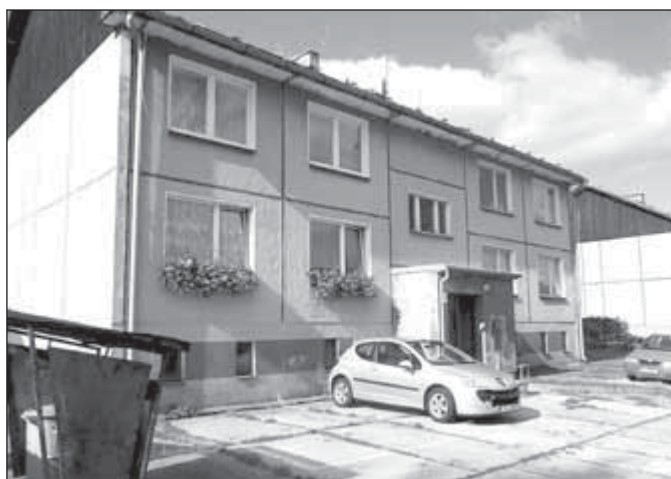
Bytový dům na ulici J. Fučíka