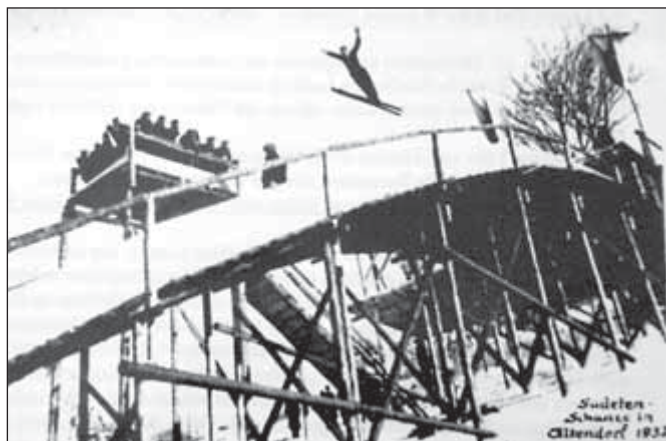
Skokanský můstek ve Staré Vsi, 1932

Své starší bratry jsem vůbec obdivovala pro jejich odvahu. Jelikož maminka hodně léčila heřmánkem a lipovým květem, museli mí tři bratři vylézt na vysoké stromy u kaple a sbírat květy lípy do pytlů.