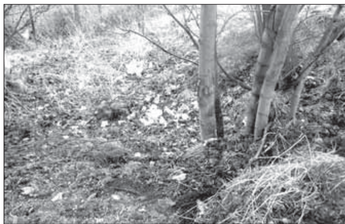
Jamartická autobusová zastávka u hřbitova