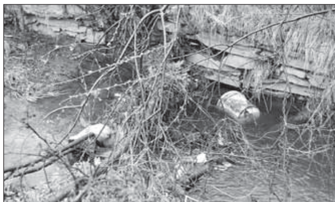
Kbelík v potůčku poblíž hasičské zbrojnice