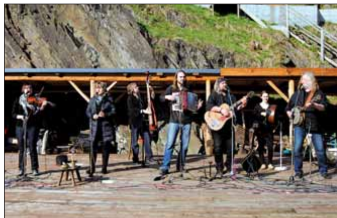
Malým čarodějnicím a čarodějům přišel k chuti opečený špekáček a dospělým koncert bluegrassové kapely Kelt Grass Band.