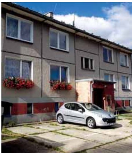
Město provede další projekty energetických úspor bytových domů