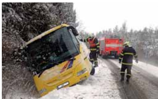
Řidiče potrápil aprílový návrat zimy