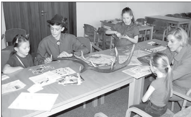
V prvním patře byla pro nejmladší návštěvníky připravena v mysliveckém koutku soutěž v malování, děti poznávaly druhy zvěře a rostliny