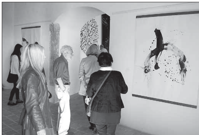
Velkoformátové kaligrafické obrazy se zaujetím vnímali pozorní návštěvníci