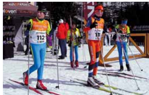
Naši běžkaři byli úspěšní na mistrovství Slovenska