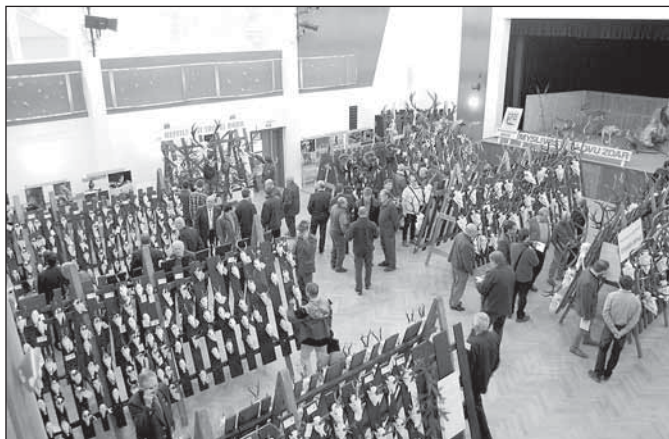
Ve velkém sále SVC Rýmařov byla vystavena téměř tisícovka trofejí

Ke cti myslivce a pro osobní vzpomínku patří samotná úprava trofeje.