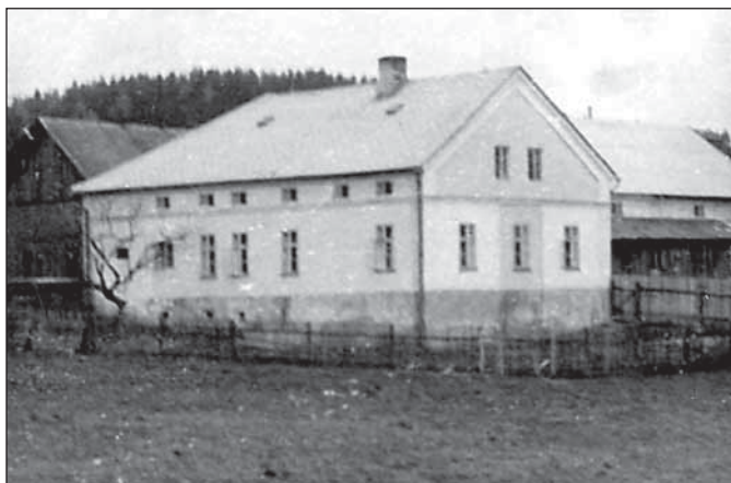
Stavení číslo 1 ve Vajglově, zbourané na konci 70. let