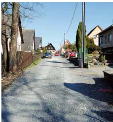
Po zimě budou pokračovat stavební práce ve městě