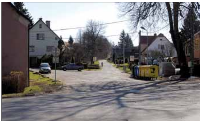
Na křižovatce ulic Okružní a Pivovarské probíhá oprava havárie kanalizace