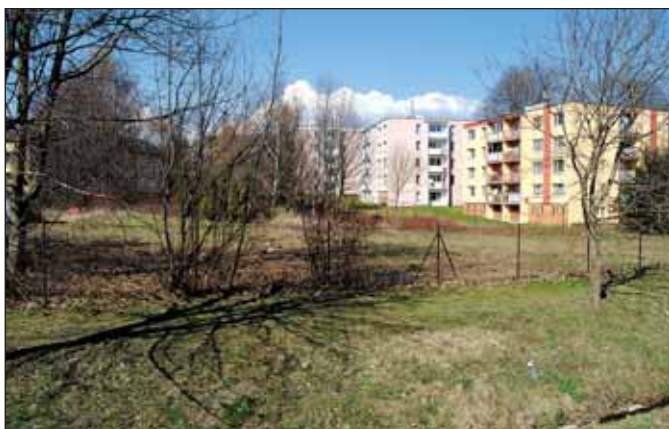
Připravuje se výstavba nového rybníku v místě původního zasypaného