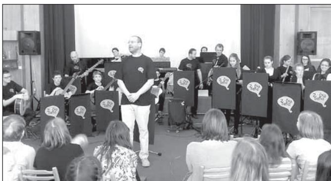
Pro žáky základní školy zahrál orchestr Zuškaband

O dva dny později, v pátek 24. března dopoledne, zahrál školní orchestr Zuškaband pro žáky základní školy v koncertním sále ZUŠ.