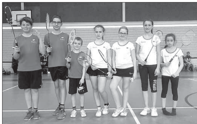
Badmintonisté SK Badec Ryo