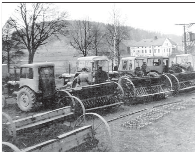
Prohlídka strojů před začátkem sezóny

V roce 1952 jsem šel na vojnu, sloužil jsem dva roky u protiletadlové obrany v Praze. Kasárna byla v Bohnicích – půlka patřila armádě, půlka psychiatrické léčebně. Prahy jsem si užil, chodili jsme do kina, do divadla, na sportovní události, na pivo k Flekům. Z Rýmařova nás bylo u našeho útvaru šest.