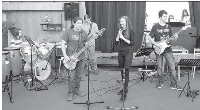
Školní rocková kapela