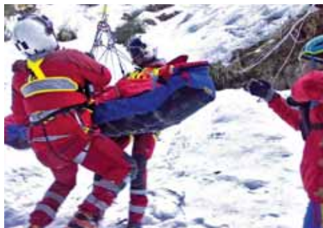
Zraněnou turistku v údolí Bílé Opavy zachraňoval vrtulník