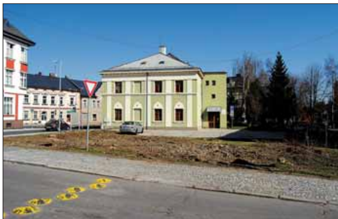
Náměstí Svobody bude mít nové parkoviště