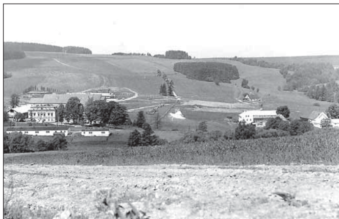
Vajglov, vlevo budova ředitelství Státních statků, vpravo hospodářství Šolců

V roce 1960 byl zrušen okres Rýmařov a ředitelství přešlo do Bruntálu. Statky se rozdělily. Pod Vajglov patřily vesnice Lomnice, Tylov, Valšov, Břidličná a Ryžoviště, pod Rýmařov zase Jamartice, Dolní Moravice, Nová Ves, Janovice, Stará Ves, pod Horní Město patřil Tvrdkov a okolní vsi, pod Huzovou Sovinec, Jiřkov, Těchanov, Arnoltice. Hutov byl izolovaný a postupně se vylidnil. Domy zchátraly, včetně velké budovy původního německého statkáře. V Hutově byl velký statek, s rozsáhlými pozemky, stájem pro šedesát kusů do-