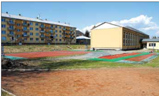
Rekonstrukcí projdou i stávající sportoviště v areálu ZŠ Rýmařov na ulici 1. máje