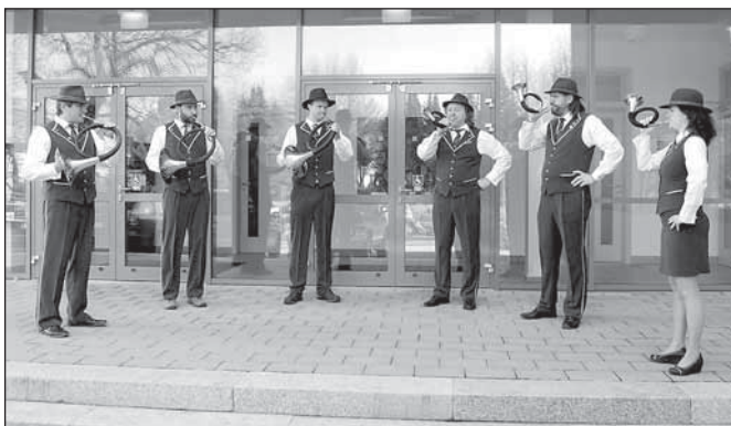
Výstavu trofejí zahájili trubači Rabštejn

Chovatelská přehlídka přinesla jedinečné zážitky nejen z vystavených trofejí, kterých byla téměř tisícovka, ale také ze setkání s přáteli, se kterými se mnozí potkávají pouze při podobných příležitostech.