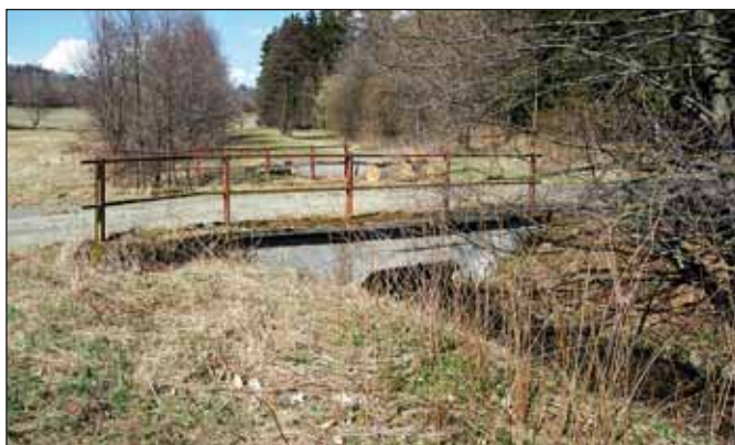
Mudlový potok projde revitalizací a v jeho levobřežní části vznikne retenční nádrž