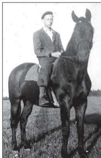
Jako praktikant na počátku 50. let