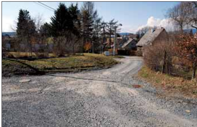
Letos by měla pokračovat II. etapa rekonstrukce komunikace v ulici Na Stráni