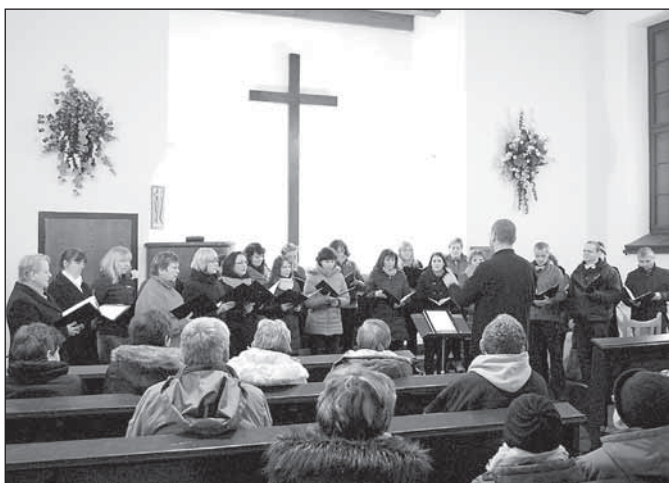
Pěvecký sbor Vox montana na koncertu v Husově sboru

Prvním ze tří koncertů žáků a učitelů hudebního oboru byl ve středu 22. března zahájen Festival souborů ZUŠ Rýmařov.