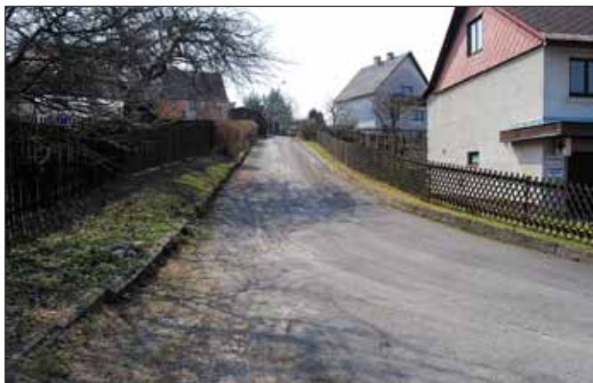
Opravovat se bude také komunikace mezi ulicemi Okružní a Na Stráni