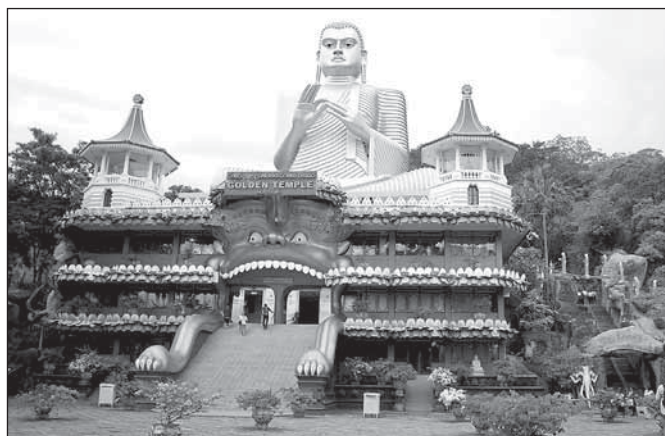
Zlatý chrám v Dambulle se zlatou sochou Buddha v pozadí