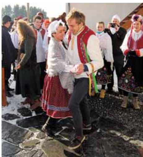
V okolních obcích stále dodržují tradice masopustu