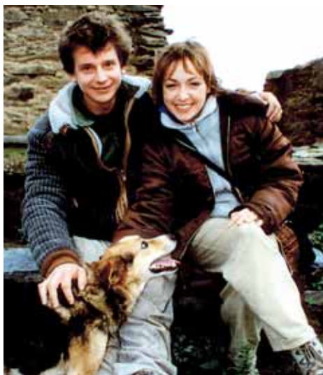
Herec z filmů Šťěstí a Divoké včely náhle zemřel