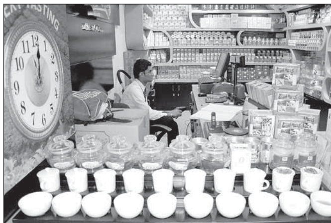
Značková prodejna kvalitního cejlonského čaje