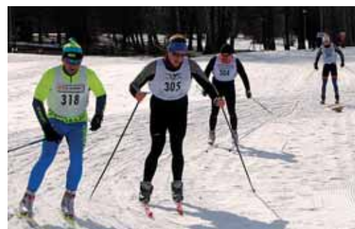
V zimním triatlonu startovalo devatenáct borců a dvě štafety