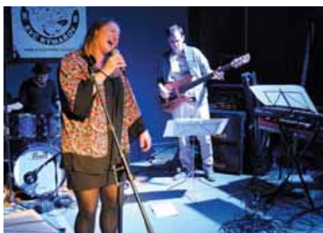
Sezónu v jazzclubu spustili hudební chameleoni Madfinger