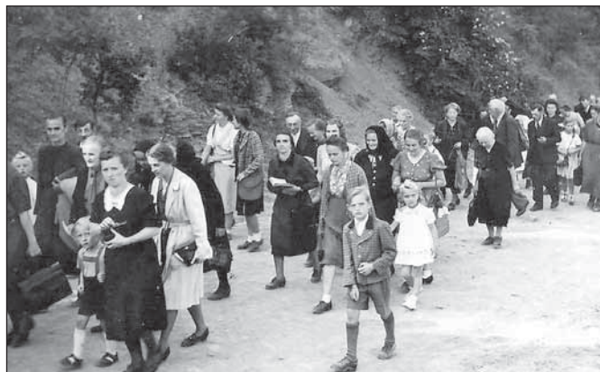
První pouť Rýmařovanů k zeilské kapli