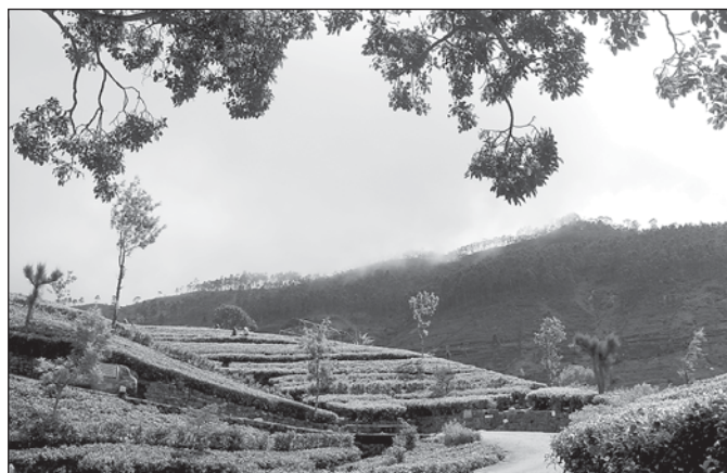
Cesta čajovými plantážemi na Liptonovu vyhlídku