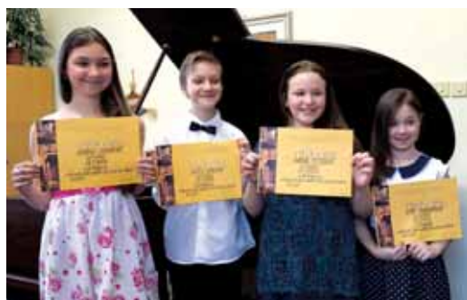
Mladí hudebníci z Rýmařova uspěli v okresním kole klavírní soutěže