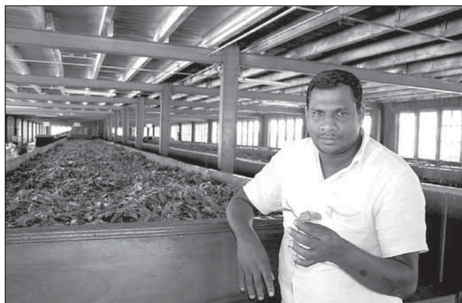
Čajová továrna Blue Field vysoko v horách Cejlonu vyrábí černý čaj

Právě soužití tolika náboženství na poměrně malém prostoru Zlatuši Knollovou překvapilo. Ve městech vedle sebe stojí buddhistické i hindu-