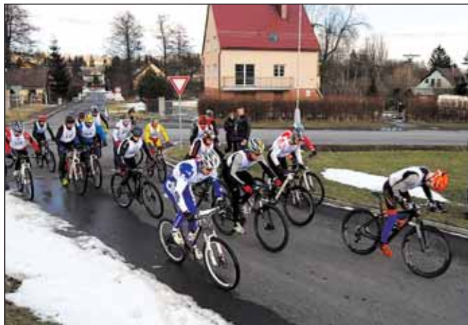
Závodníci odstartovali do první disciplíny

Pořadatelé i sportovci si pochvalovali nádherné slunečné počasí a doufají, že v pátém ročníku bude i sněhová pokrývka kvalitnější. JiKo