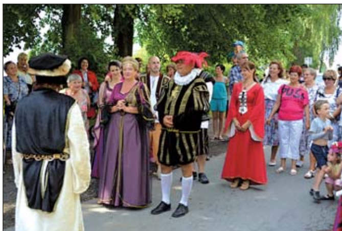
Loučení s císařem Rudolfem II. v Horním Městě