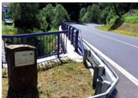
Silnice přes Valšovský Důl je od července v provozu