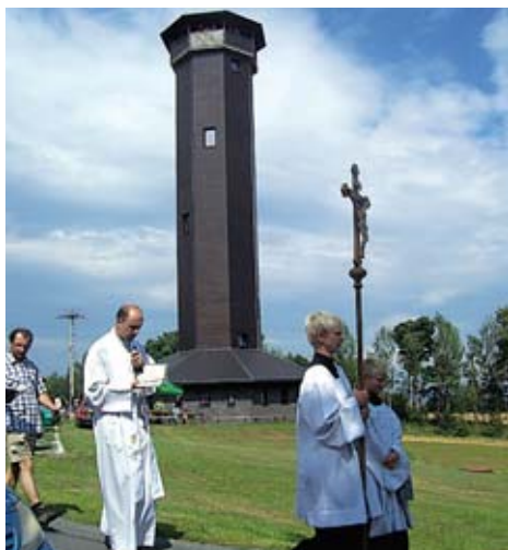
Svatoanenská pouť je v Ondřejově tradicí, vrací se i do Nové Vsi