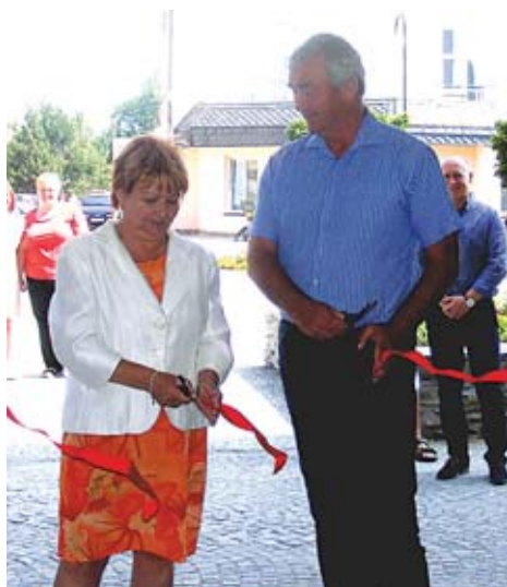
Bytový dům s pasáží na Radniční ulici byl slavnostně předán