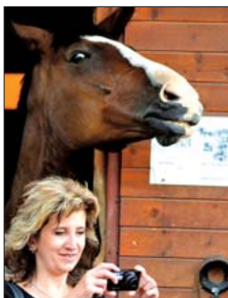
Úsměv patří na každé foto, byť by byl koňský