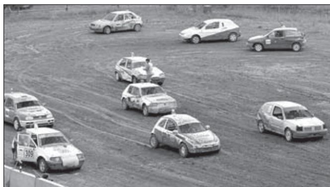
Start finálové jízdy divize nad 1 600 m 3