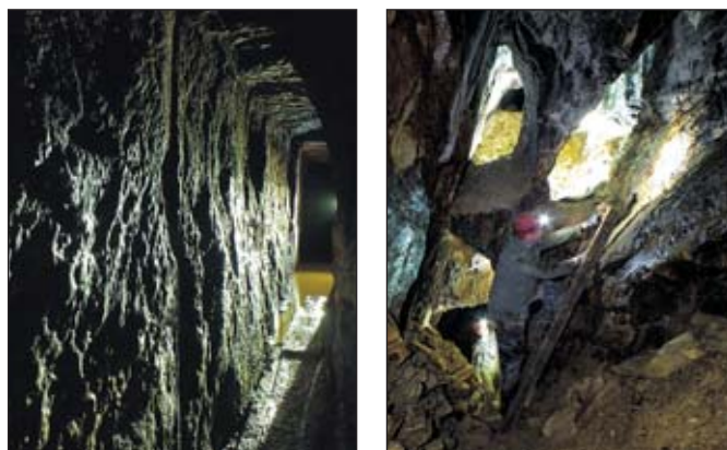
S velkým zájmem se setkala otevření štoly Antonína Paduánského s možností prohlídky