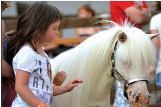
Malí i velcí obdivovali krásu a eleganci koní ve Skalách