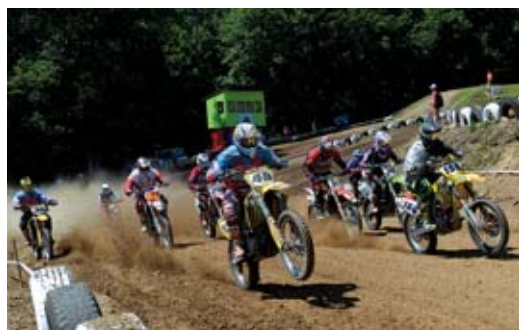
V Horním Městě na Josefcě obnovili po 25 letech motokrosovou trať