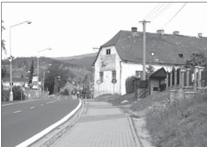
Cyklostezka v Janovicích