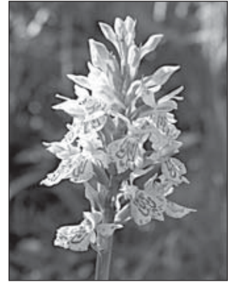
variabilní krása prstnatců

ktej se nechá nalákat barvou a tvarem květu, vlezte dovnitř, nektar nenajde, hladké vnitřní stěny mu však nedovolí vylézt ven, a tak využije boční průsvitná okénka, tím na sebe nalepí pyl a při následující misi jej přeneše na blizny dalšího květu. Podobně probíhá opylování i u řady jiných druhů orchidejí. Za mistry v oboru šálivých květů je nutno považovat zejména rostliny druhu tořič.