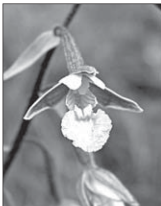
Orchidej krušík bahenní

Čeleď Orchidacea patří počtem druhů mezi největší v rostlinné říši. Řadí se k ní přibližně 20 až 30 tisíc druhů rostoucích s výjimkou pouští a arktických oblastí po celé Zemi. Centrum rozšíření se přitom nachází v tropických a subtropických oblastech, v Evropě roste pouze zlomek z celkového počtu druhů, přibližně 250, v České republice pak přibližně