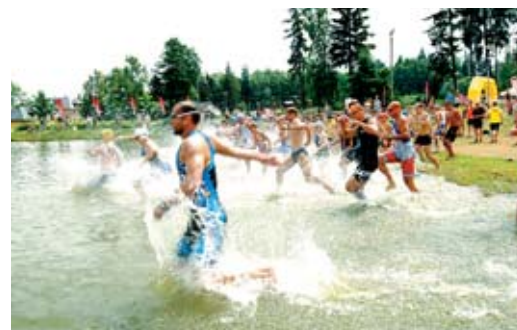
Jednadvacátý Edrovický triatlon provázely tropy i kroupy