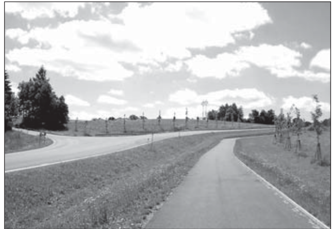
Cyklostezka do Ondřejova

Cyklista jedoucí po silnici Janovicemi k Penny marketu musí u čerpací stanice porušit veškerá vodorovná značení a ještě přejíždět do protisměru a před horizontem, za který není příliš vidět, aby se na novou stezku vůbec dostal. V takovém případě mi to nestojí za to riziko a volím raději hlavní silnici, která je zde rovnější a bez zbytečných kopečků. Podobné je to na ulici 8. května, kde navíc omezuje už tak docela úzký chodník nezbytně zábradlí dělící jej od silnice. Ale on tam stejně nikdo nejezdí, protože „tankodromu“ do Jamartice se každý cyklista raději vyhne obloukem. Poslední vada na kráse, kterou bych v této souvislosti rád zmínil, je ondřejovská cyklostezka. Spousta cyklistů, kteří