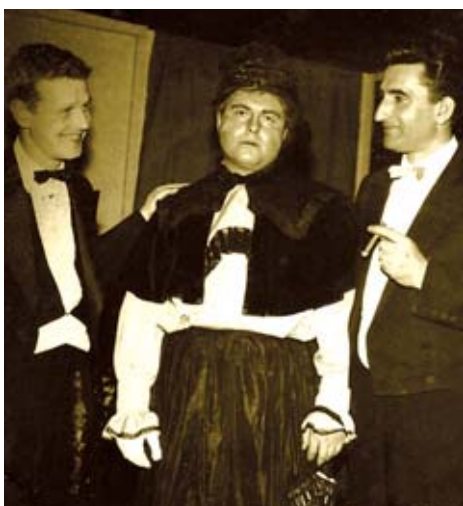
Ochotnické divadlo Mahen slaví v letošním roce 70 let