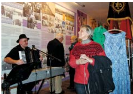
Nová expozice o textilnictví v Hedvě – další cíl turistů