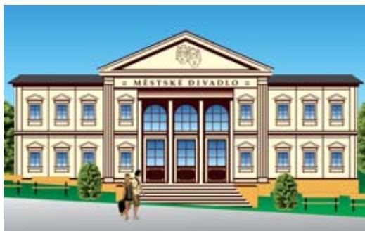
Co bude s budovou bývalého kina? Ochotníci navrhují obnovu divadla