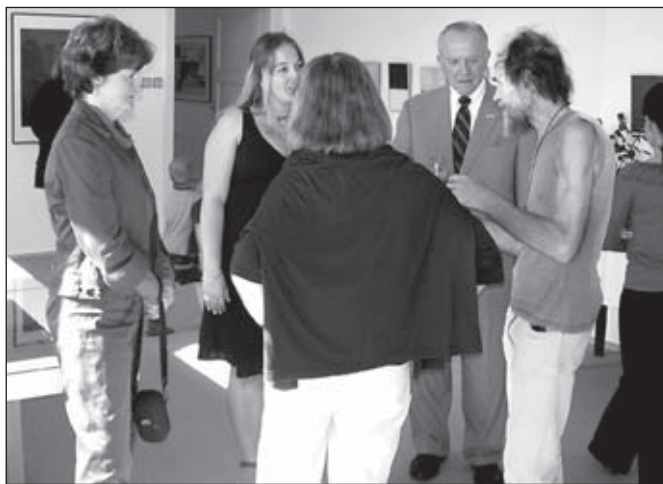
Výstava manželů Kovalových za účasti velvyslance USA Williama J. Cabanisse a jeho manželky

Těž nikoho nepřekvapí, že Rýmařov má vysoce kvalitní, v odborných kruzích nesmírně ceněné muzeum plné nevšedních sbírek a galerii, o které se nejen mluví, občas píše, ale oslovení umělci zde také rádi vystavují. Má pro ně stejně jako pro nás význam! Vzniklo zde obrovské tvůrčí zázemí pro začínající umělce a badatele, odborníky, návštěvníky a turisty, což bylo záměrem už první polistopadové rady a zastupitelstva města Rý-