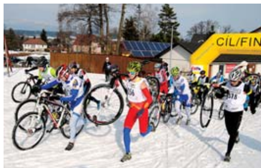
3. ročníku zimního DuKo triatlonu se zúčastnily tři desítky závodníků