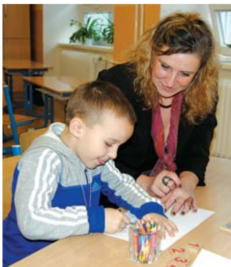
Zápis do prvních tříd: více předškoláků, více odkladů