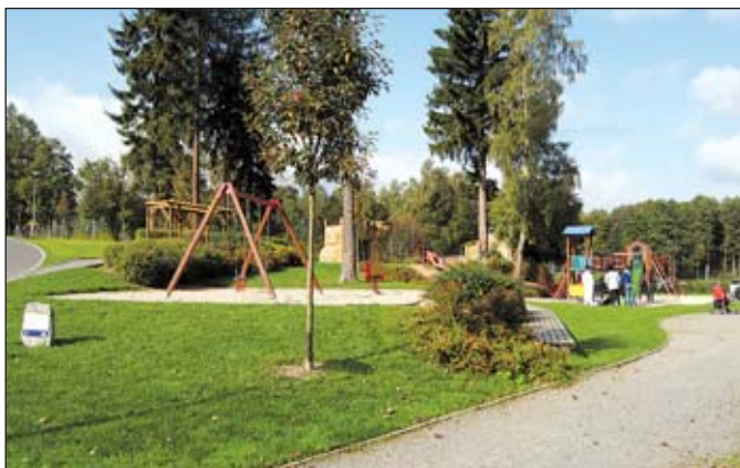
Sportovní areál v zahradě Hedvy