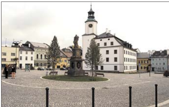
Náměstí Míru po rekonstrukci