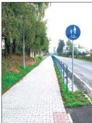
Cyklostezka Jamartice a Ondřejov