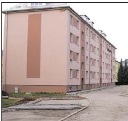
Zateplena je většina bytových domů v majetku města za 78 milionů Kč

Ze všech celostátních srovnání v jejich čerpání vycházíme jako špička. To byla a je obrovská zásluha především pracovníků odboru životního prostředí a regionálního rozvoje.