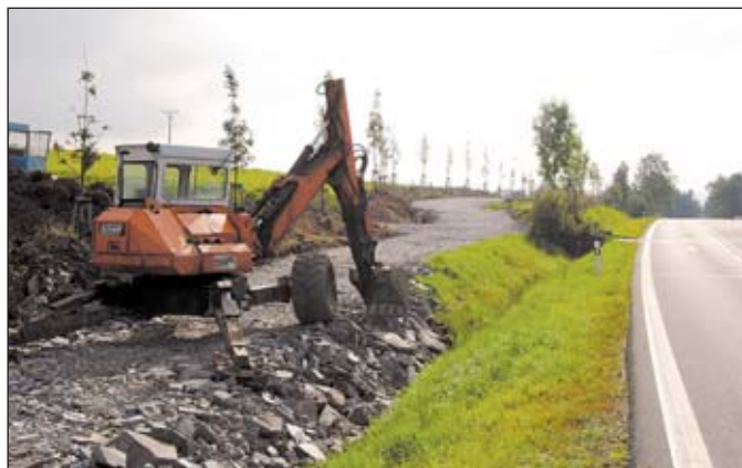
Cyklostezka Rýmařov – Janovice ve výstavbě