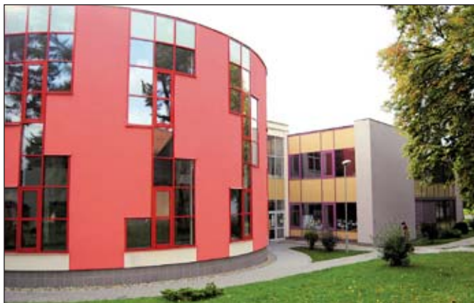
Středisko volného času