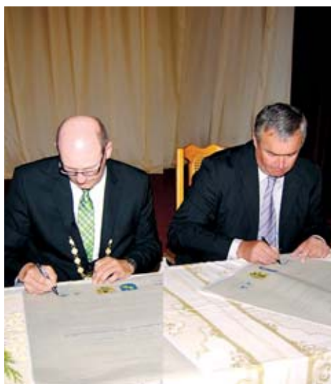
Novým partnerským městem Rýmařova se stal německý Zeil