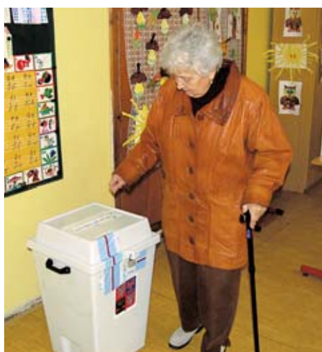
Jak budeme volit zastupitele aneb Co dokáže jeden hlas