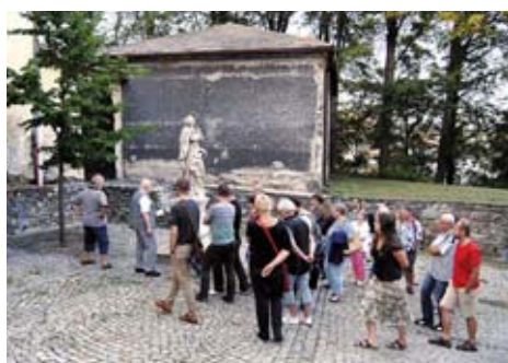
Dny evropského dědictví se poprvé uskutečnily i v našem městě