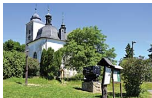
Na věčnost odešel hornoměstský farář a děkan Bohumil Měchura