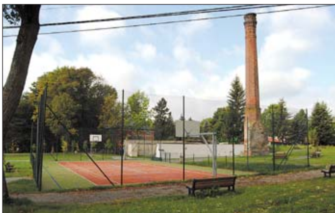
Multifunkční sportovní hřiště v Janovicích