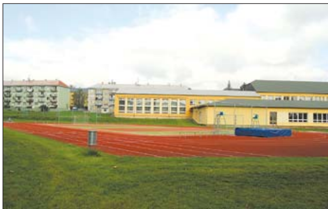
Atletické hřiště u ZŠ na ul. I. máje