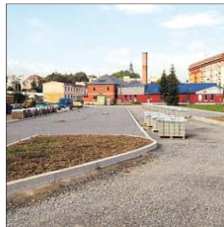
Budoucí parkoviště u sídliště Dukelská

Nechci předbíhat událostem ani nijak spekulovat, ale pokud byste byl zvolen starostou i pro další volební období, v pořadí již čtvrté, pokud byste vy sám samozřejmě chtěl, k čemu by vás tato skutečnost zavazovala? Máte