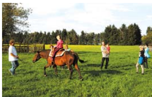
Spanilá jízda s hnojem, borůvkové koláče i sekáč roku ve Stránském