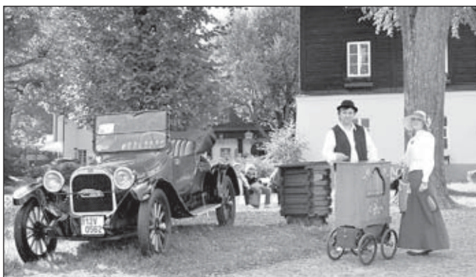
V Karlově Studánce se sešli flašinetáři a pouliční pěvci, zájem ale budil i tento americký vůz firmy Dodge Brothers z r. 1918 se startovním číslem 3. Firma byla tehdy 3. největší automobilkou v USA