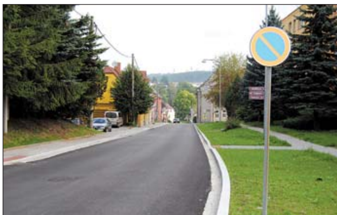
Nově opravená komunikace na Havlíčkově a Národní ulici