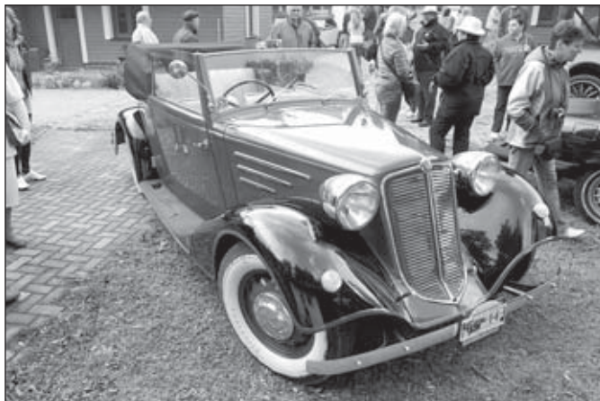
Stejně jako další veteránské vozy budila velký zájem i tato Tatra 75 z r. 1936