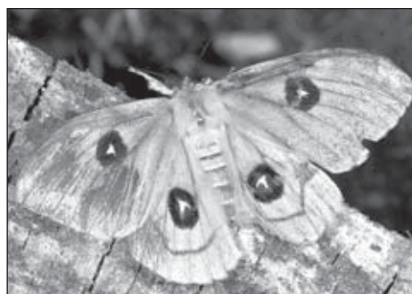
Martináč bukový ( Aglaia tau )

Lišajové jsou aktivní zejména v noci, a tak nám jejich přítomnost uniká. Výjimkou je dlouhozobka svízelová, která je naopak aktivní ve dne a dřív nebo později si jí všimneme, jak se jako kolibřík vznáší u květů hadince či jiných druhů kvetoucích rostlin a dlouhým sáskem saje nektar. Je to zážitek téměř exotický.