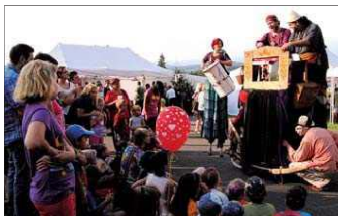
Divadlo na chůdách Kvelb