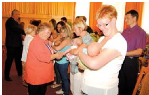
Zástupci města na sklonku léta přivítali nové občánky