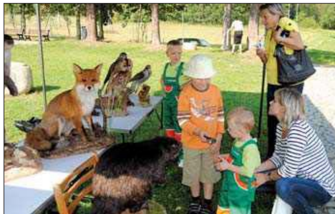
Prezentační stánek Lesů ČR