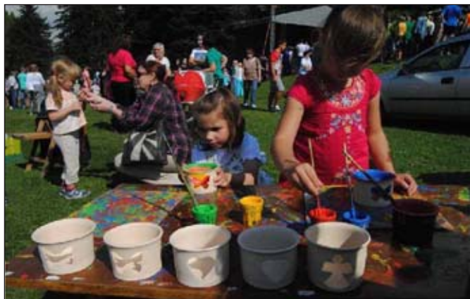
Sřředisko volného času uspořádalo pro děti výtvarnou soutěž