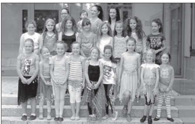
Se Šeherezádou po stopách Orientu