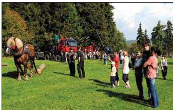
Ukázky lesní techniky a těžby dřevní hmoty