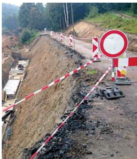
Kdy bude průjezdná silnice do Dlouhé Loučky?