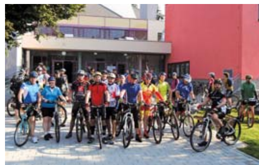
Na Rýmařovskou padesátku vyrazily více než dvě stovky účastníků