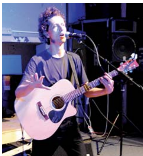
Festival Krosna dědka Pradědka aneb Všechny (jiné) tváře folku