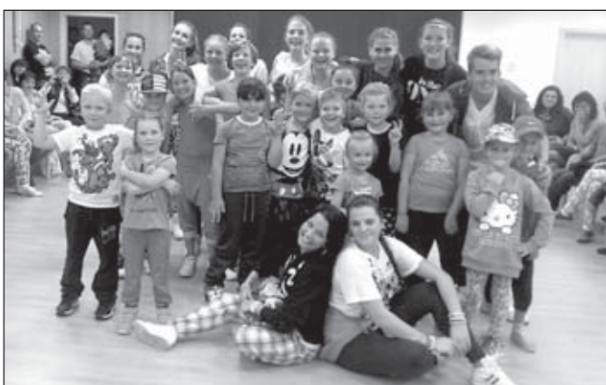
Letní soustředění taneční skupiny Move2you