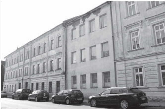
Budova SSOŠ Prima