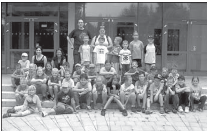
Kluci a holky v akci