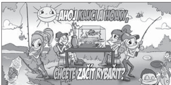
Ilustrace: MO ČRS Belá pod Bezdězem

Český rybářský svaz, místní organizace Rýmařov, otevírá ve školním roce 2014/2015 v Rýmařově a Břidličně rybářský kroužek. Přihlásit se mohou zájemci ve věku od 6 do 14 let v Rýmařově u pana Mácky na tel: 725 686 710 nebo u pana Čecha na tel: 605 437 235, v Břidličně u pana Bajgra na tel: 605 479 093.