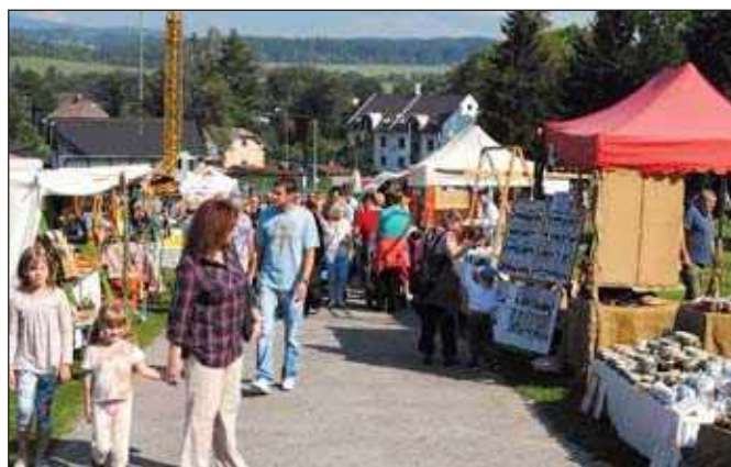
Firmy ve stáncích prezentovaly nabídku svých produktů