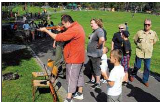
Návštěvníci akce si mohli zasířilet ze vzduchovky