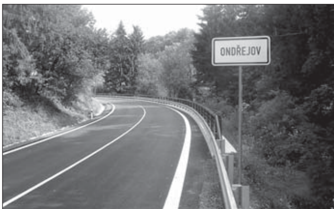
Foto a text: Ing. Jaroslav Kala, krajský zastupitel, místostarosta

Závěrem bych chtěl říci, že po- kud nás poslanci a senátoři nevy- slyší a nezmění zákon o veřej- ných zakázkách, budou se tyto „lotroviny“ dít dál. Pokud by se chtěl někdo odvolávat jen tak a musel by například zaplatit kauci ve výši 10 % z ceny zakáz- ky, asi by si to rozmyslel. Propadlou kauci bych navrhl dát do fondu dopravní infrastruktury. Ale čas ukáže, zda to bude u zá- konodárců průchodné.