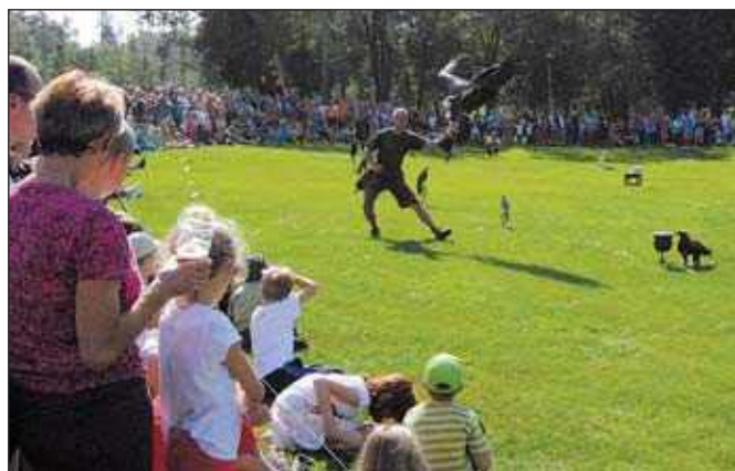
Ukázky sokolníků s dravými ptáky