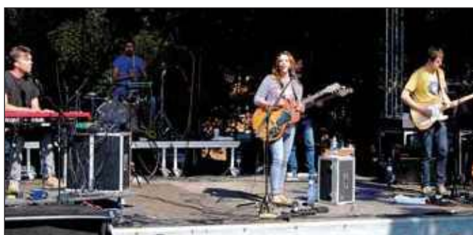
Koncert Anety Langerové