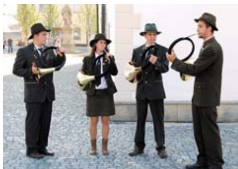
Po dvou letech se opět konaly Dřevařské, lesnické a myslivecké dny