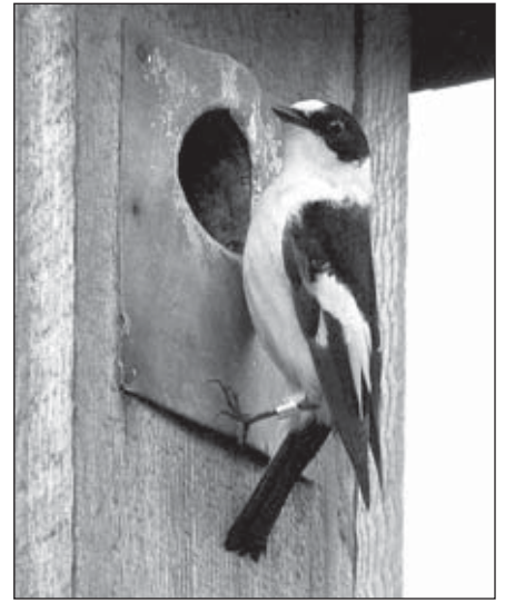
Lejska bělokrký, sameček u hnízdní budky