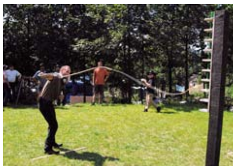
Velká cena Indiana 2014 měla premiéru v areálu westernové školy