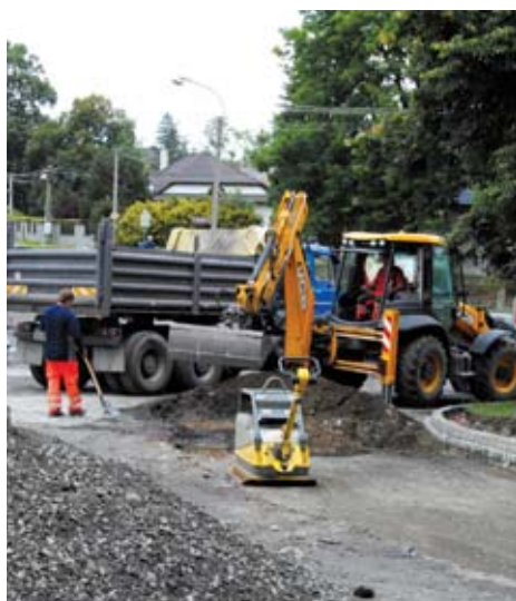
Aktuální stav investic, oprav a rekonstrukcí probíhajících ve městě