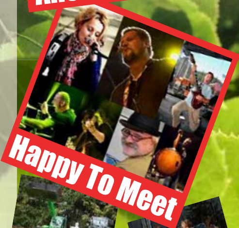
Happy To Meet