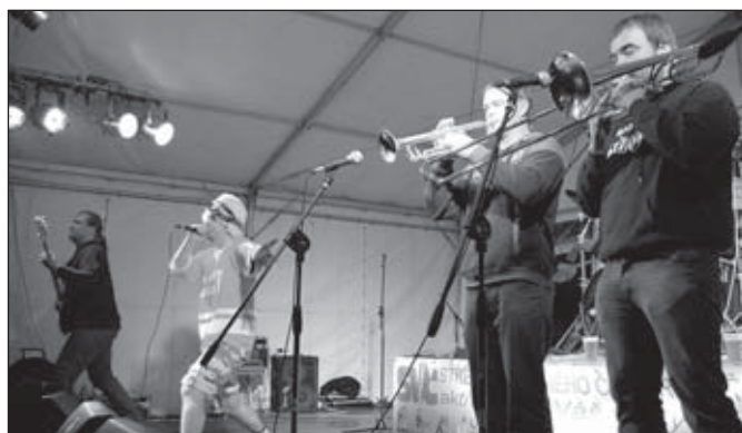
Burani z New Jersey