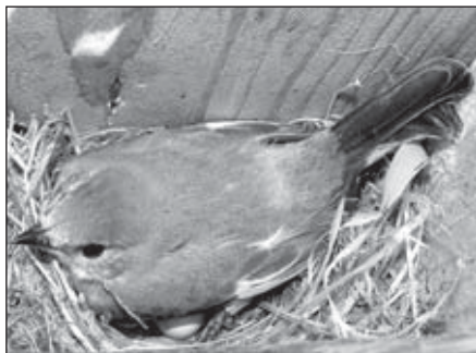
Lejsk bělokrcí, samička zahřívá v budce vajíčka

Hned v úvodu je nutno podotknout, že lejsk není rejsek, což si lidé často pletou. Lejscí