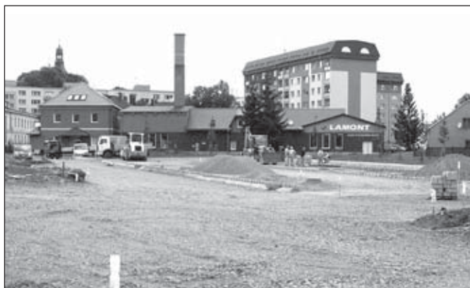
Parkoviště na sídlišti Dukelská

Pokračuje výstavba nové tržnice. Stavba je již ve své závěrečné fázi, kdy zbývá dodat a zabudovat mobiliář tržnice a zadláždění.