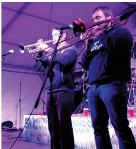
U zámku proběhl ska a reggae festival Rýmařovská Skatastrofa