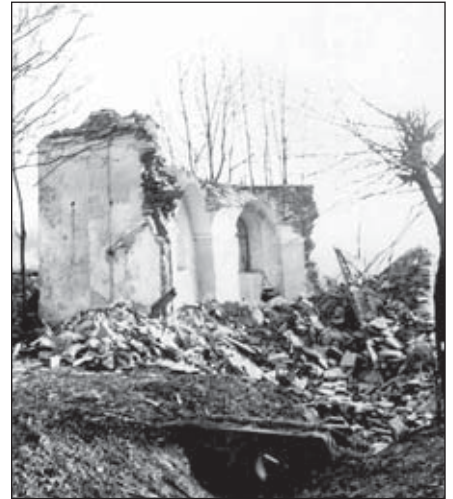
Poslední zbytky bourané kaple v Tylově, asi rok 1965 – kaple trpěla vlhkostí, voda musela být odváděna drenáží