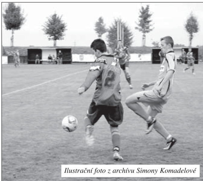
Ilustrační foto z archivu Simony Komadelové