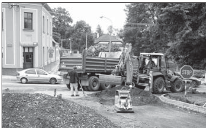
Křižovatka Národní a Bartákovy ulice

hajaným investicím patří zateplení a výměna oken na budově kuželny (1,188 mil. Kč vč. DPH) a Sokolovské 29, 31, 33 se sídlem SSOŠ Prima (3,615 mil. Kč vč. DPH), které by měly být dokončeny z převážné části do konce stavební sezóny. Vítězným dodavatelem staveb je firma RIO, s. r. o. Jde o významné budovy v majetku města a jejich nové fasády významně zkvalitní i veřejné prostranství města.