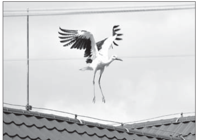
Čápi na komíně v Janovicích vyvedli jedno mládě, 20. července opustili hnízdo. Na snímku mládě v letu.