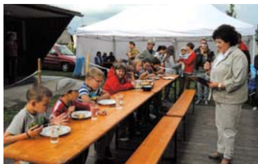
Vítěz spořádal v Ondřejově pětaticet knedlíků za necelé dvě minuty