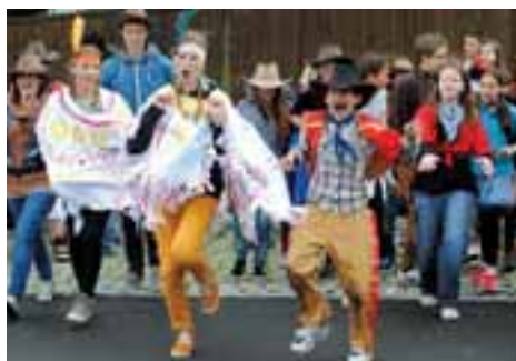
Při oslavách Majáles ovládli město indiáni, kovbojové a banditi