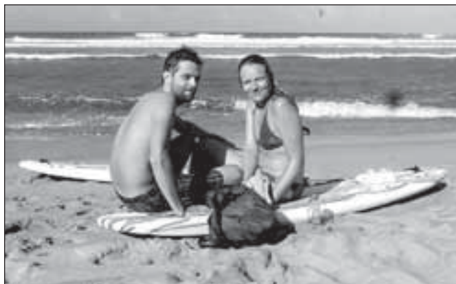
Náš poslední surfvací víkend

Během našeho pobytu jsme se zúčastnili také oslav 170. výročí nezávislosti, které připadá na 27. února. Roku 1844 se po povstání na východní části ostrova Dominikánská republika odtrhla od Haiti a byla vyhlášena jako nezávislý stát. Ačkoliv byla později krátce pod nadvládou Španělska i USA, slaví se tento den jako národní svátek dne nezávislosti. Během celého února se konají po celé zemi barevné karnevaly, které vrcholí koncem měsíce. Hlavní postavou karnevalu je ďábel, což ale v žádném případě neznamená, že by ho místní uctívali. Je to právě naopak a jde spíše o satiru. My jsme slavili s místními na vesnici, kde si děti ze školy připravily pestrý program s muzikou. Naše kamarádka byla ale ve městě La Vega,