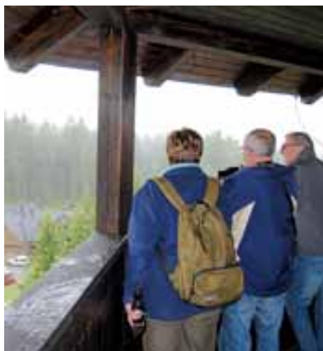
V Nové Vsi byl otevřen rekreační areál s třicetimetrovou rozhlednou