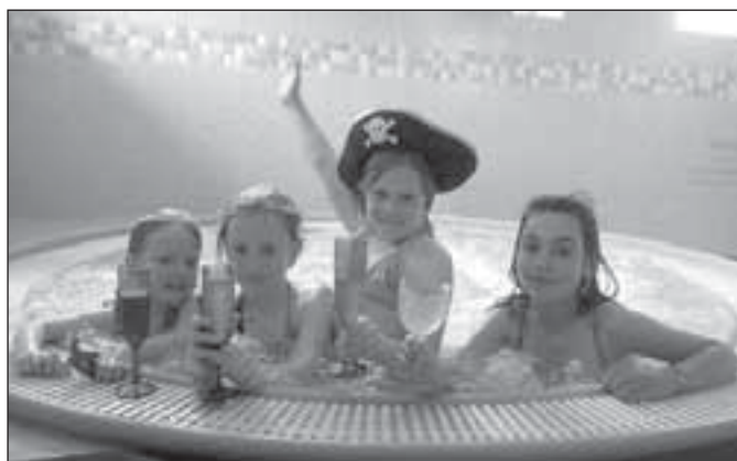
Pirátský den dětí v aquacentru

Foto a text: Renáta Polišínská, manažerka Hotelu a Aquacentra Slunce