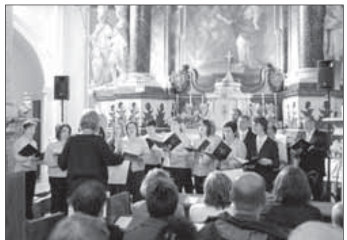
Návštěvníky kaple V Lipkách přivítal pěvecký sbor Bernardini z Břidličné