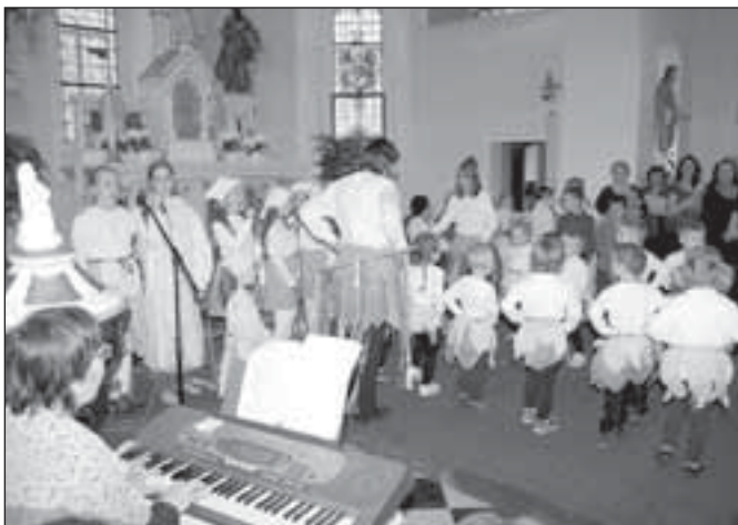
Děti z Mateřské školy a Základní školy ve Staré Vsi společně s pěveckým sborem dospělých Vox montana Základní umělecké školy Rýmařov