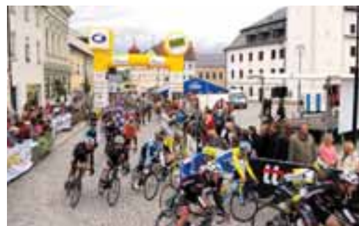
Rýmařov byl historicky poprvé cílovým městem první etapy Závodu míru