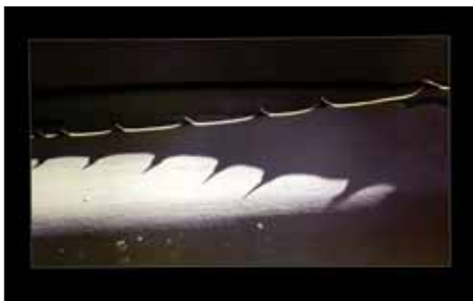
Bedřich Randýsek - Aloe (2. místo Příroda)

CZ PL E43 / E43 2007-2013 PROGRAM SPOLUPRÁCE A INICIATIVY EVROPSKÝ ÚSTAV PRO REGIONÁLNÍ ROZVOJ - EUROPEAN INSTITUTE FOR REGIONAL DEVELOPMENT PROGRAMOWE WSPÓŁPRACY I INICJATYWY "Kulturalnym szlakiem pogranicza i Kulturalną ścieżką pograniczą", reg. č. PL.3.22/2.2.00/12.03420.