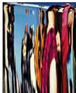
Bohumil Švéda - Mimoszemšťané (2. místo Volné téma)