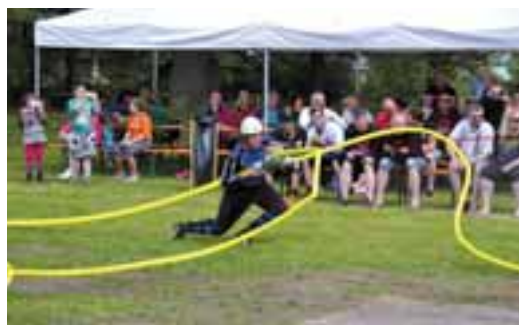
U janovického zámku proběhlo druhé kolo Hasičské ligy Praděd