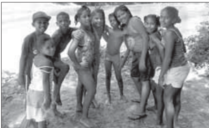
Koupání s dětmi v řece Yas

Vánoce byly zajímavé. Místním zvykem je totiž dvanáct dní před Štědrým dnem každé ráno v pět hodin jít v průvodu vesnicí, hrát na trubku, bubínky a místní hudební nástroj güira vyrobený z cínového plechu a připomínající naše struhadlo. První den, kdy nás takto skupina věřících vzbudila brzy ráno, jsme byli v šoku a nevěděli, co se děje. Další rána jsme si jen rezignovaně zakryli uši polštářem a zkoušeli znovu usnout. No a na Štědrý den, který se tady stejně jako u nás slaví 24. prosince, jsme v duchu rčení „když je nemůžeš porazit, přidej se k nim“ vstali před svítáním a šli do vánočního průvodu s místními. Zpívalo se, hrálo na bubínky, choďilo od domu k domu, aby se k nám přidalo co nejvíce koledníků. Průvod jsme zakončili v kostele a po mši se pro zahřátí servíroval čaj a sušenky pro všechny. Místní si s námi povíдали, zajímali se, co tu děláme,