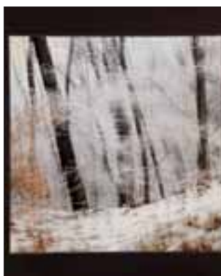
Miroslav Olšák - Krajina ticha (1. místo Příroda)