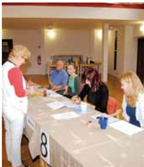
Volby do Evropského parlamentu poznámala nízká volební účast