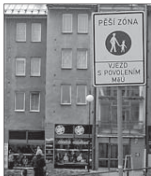
Pěší zóna na Radniční ulici

Značky Pěší zóna (č. IP 27a) a Konec pěší zóny (č. IP 27b) označují oblast, například část obce, určenou především pro chodce; ve spodní části značek se vyznačuje vhodným nápisem nebo symbolem, kterým vozidlům je vjezd do této oblasti povolen, příp. v jaké době; značka č. IP 27b může být umístěna vlevo při výjezdu z pěší zóny z opačné strany značky č. IP 27a. V pěší zóně smějí chodci užívat pozemní komunikaci v celé její šířce, přičemž se na ně nevztahu-