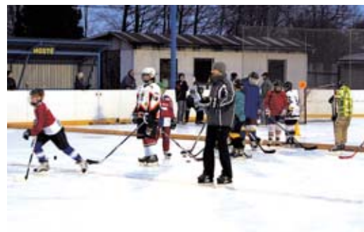
Mladí hokejisté ukončili letošní sezónu sportovním odpolednem