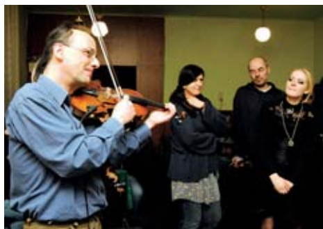
Vernisáž výstavy foto poetů v muzeu pokračovala koncertem na Růžku