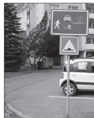
Obytná zóna na sídlišti Pivovarská

V obytné zóně a pěší zóně smí řidiči jet rychlostí nejvýše 20 km/h. Přitom musí dbát zvýšené ohleduplnosti vůči chodcům, které nesmí ohrozit; v případě nutnosti musí zastavit vozidlo. Stání je dovoleno jen na místech označených jako parkoviště.