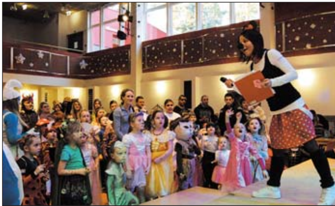
Karneval Z pohádky do pohádky v SVČ Rýmařov