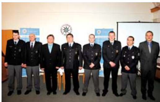
V Bruntále ocenili nejlepší policisty, mezi nimi i dva Rýmařováci