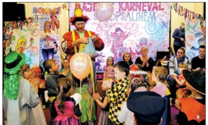
Karneval s Hopsalínem MŠ Jelínkova