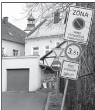
Zóna na Husově ulici se zákazem parkování mimo vyznačená parkoviště

Vzhledem k tomu, že někteří řidiči ve městě neustále porušují zákon č. 361/2000 Sb., o provozu na pozemních komunikacích a o změnách některých zákonů, zejména co se týká zákazu zastavení a stání, parkování mimo vyznačená parkoviště, povolené rychlosti v obci či v obytných zónách ad., rozhodl se odbor dopravy a silničního hospodářství Městského úřadu v Rýmařově formou seriálu upozornit na význam některých dopravních značek, umístěných na území města a v jeho místních částech.