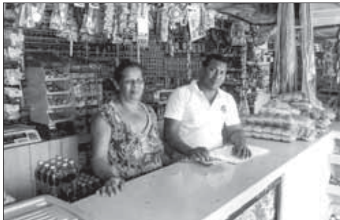
Naši milí sousedé

Kromě těchto domácích mazlíků máme na farmě ovečky (které svým krátkým lesklým sestříhem připomínají spíše kozy), krávy, slepice, husy a včely. Z ostatních zvířat, která sice nechováme, ale čas od času na ně na farmě narazíme, jsou to žáby, jedovaté stonožky, nejedovatí hadi, chlupaté tarantule a jednou se k nám dokonce zatoulal krab a želva. A samozřejmě nemůžeme opomenout všudypřítomné moskyty a šváby. Není náhoda, že se písnička „La cucaracha“ (šváb) stala jedním z našich místních popěvkových hitů.