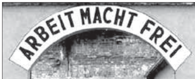
Koncentrační tábor Terezín, vstupní brána 1943