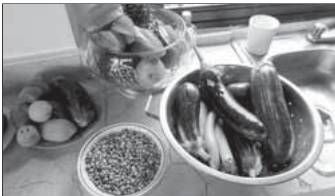
Tohle všechno jsme si vypěstovali

Typický pracovní den začíná dobrou snídaní. Obvykle máme ovesné vločky, čerstvé mléko a místní