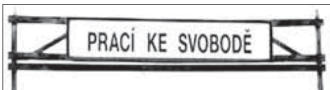
Vězeňský tábor Vojna, vstupní brána 1953

boře nechyběl ani „appelplatz“, kde stávali málo oblečení vězni za trest celé hodiny i v tuhých mrazech, někdy i několikrát denně. Zde se konaly pravidelné „filcun-ky“, zevrubné prohlídky, zda delikventi něco neskrývají. Nechyběly tělesné tresty, snahy vymýt lidem mozky v kulturní místnosti a zlomit je ke spolupráci s dozorcí. V dusné atmosféře se dařilo udavačům. Vzorní pracovníci mezi vězni mohli spolu s táborovými špicly využívat jisté úlevy. U spoluvězňů sice ztratili jakýkoli kredit, ale nabízel se jim na rozdíl od ostatních lepší ubytování, balíčky z domova či návštěvy příbuzných. Kriminální vězni byli v Bytízu oddělení. Sebevraždy střídala podezřelá úmrtí či předčasné vyčerpání. Podvýživní lidé umírali na banální nemoci, jiní po úrazech v dolech i střelami strážní. Popel mrtvých vydávali jejich pozůstalým teprve od roku 1955. Většina odsouzených pracovala