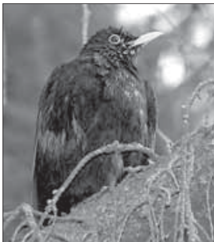
Kos černý, samec

V únoru jsme ještě nemohli očekávat přilet tažných ptáků, krom několika výjimek. Jednou z nich je brávník ( Turdus viscivorus ) z čeledi drozdovitých. Na svých potulkách ho můžeme slyšet někdy už v polovině února! Mnohé tento časný zpěv už jistě překvapil a marně se tázali, co to může být, který pták se to v zimě „zbláznil“. Inu - právě brávník. Jeho hlas nelze přeslechnout, ani když je pták vzdálen půl kilometru. Je totiž silný, a protože si brávník ke své produkci vybírá vyvýšená místa (nejčastěji vrcholky stromů), nese se daleko. Zní hlaholově, jednotlivé trylky nejsou stejně dlouhé a jdou rychle za sebou. Mezi slokami jsou krátké pauzy. Máme-li dalekohled a štěstí, můžeme si tohoto zpěváka prohlédnout - pokud sám přiletí blízko nebo se nám v terénu podaří přiblížit se na dostatečnou vzdálenost.