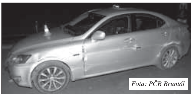
Fota: PČR Bruntál

kde se čelně střetl s felicií 51leté řidičky. Viník nehody se pokoušel z místa odjet, kvůli těžkému poškození auta se mu to však nepodařilo. Čtyři cestující z felicie utrpěli lehké zranění, tři z nich převezli zdravotníci k ošetření do nemocnice. Řidiči passatu policisté naměřili nejprve 2,09 promile a po půl hodině 1,92 promile alkoholu v dechu. Muž policistům tvrdil, že auto v době nehody neřídil, že ho měl řídit jeho kamarád, který po nehodě utekl a jehož jméno nezná. Policisté ale toto tvrzení při šetření nehody vyvrátili. Způsobená škoda na vozidlech činí 70 tisíc korun.