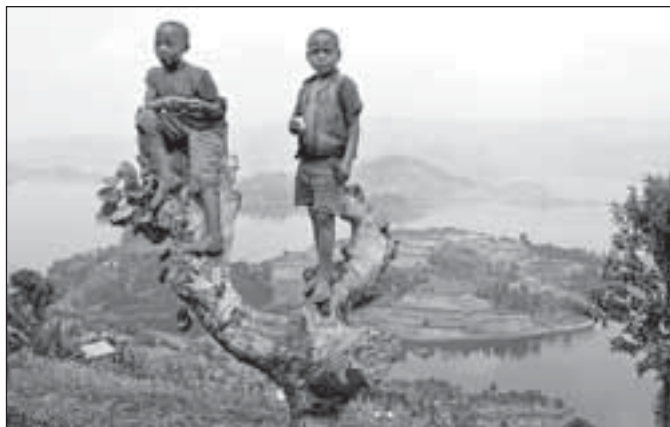
Kluci od jezera Bunyonyi

nocidou, posluchači přednášky si ale prohlédli hlavně rwandský venkov, zejména plantáže zeleného čaje v oblasti Pfunda. Posledním videem se vrátili z vnitrozemí