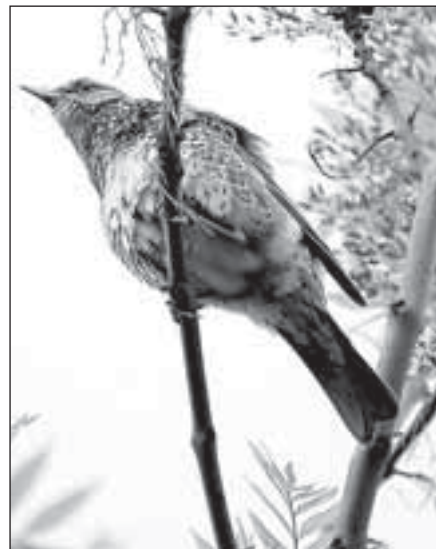
Drozd kvíčala, samec

a kdo je všímavý, zjistí, že ptačích druhů je u nás víc, než by byl laický předpoklad. Ornitolog ví, čím je to dáno: tažní ptáci přilétají a zimní hosté ze severu ještě neodletí. A tak tu vedle konipasa bílého (objevuje se kolem 10. března), drozda a někdy dokonce čápa máme např. kání rousnou, která hnízdí až v tundře. Tato káně se u nás někdy zdrží až do dubna. Z dalších severských hostů můžeme u nás každý rok pozorovat pěnkavu jikavce, zmíněnou cvrčalu, dřemlíka tundrového a občas brkoslava severního, v nižších polohách pak vícero druhů vodních ptáků, jejichž typickým zástupcem je hohol severní.