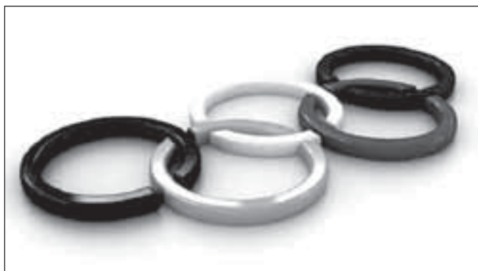
Foto na titulní straně: