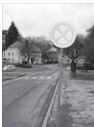
Dopravní značka B 28 na Bartákově ulici

Vzhledem k tomu, že někteří řidiči ve městě neustále porušují zákon č. 361/2000 Sb., o provozu na pozemních komunikacích a o změnách některých zákonů, zejména co se týká zákazu zastavení a stání, parkování mimo vyhrazená parkoviště, povolené rychlosti v obci či v obytných zónách ad., rozhodl se odbor dopravy a silničního hospodářství Městského úřadu v Rýmařově formou seriálu upozornit na význam některých dopravních značek, umístěných na území města a v jeho místních částech.