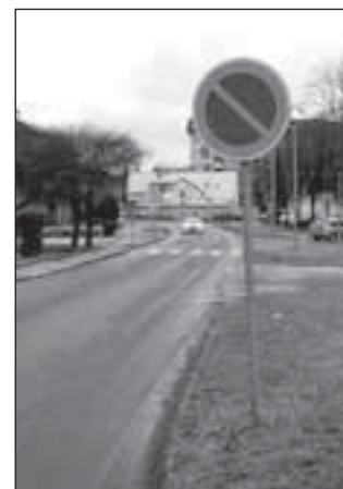
Dopravní značka B 29 na Bartákově ulici

Značka Zákaz stání (B 29), na níž může být v dolní části červeného kruhu vyznačena doba, po kterou zákaz platí, ukončuje platnost značky B 28 (Zákaz zastavení) a značek pro parkoviště (IP 11a až IP 11c, IP 11f až IP 12, IP 13b a IP 13c).