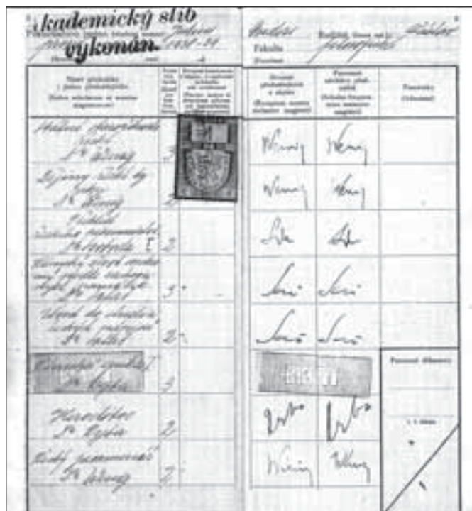
Herodotos, Dějiny řecké lyriky, špatná „průprava“ pro Bytíz

Místem dalšího utrpení se stal tábor Svatopluk rovněž na Hornoslavkovsku. Stovka vězňů zde od