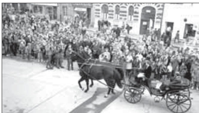
Otevření radnice r. 1994