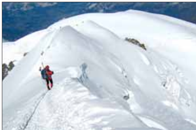
Nekonečný sestup z Mont Blancu