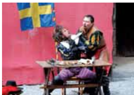
Hofmistrova závěť ukončila letošní sezónu na hradě Sovinci