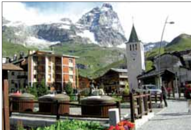
Italské městečko Cervinie a pohled na Velký Matterhorn