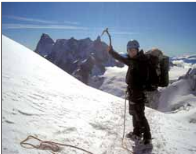
Pohled na Grandes Jorasses zpod Aiguille du Midi

li ve Středisku volného času, při jedné z jejich tréninkových hodin na horolezecké stěně. Do Alp se vydali společně, na vrchol nejvyšší hory Evropy ale stoupali dvěma cestami, které svým způsobem prezentují i jejich přístup k horolezectví.