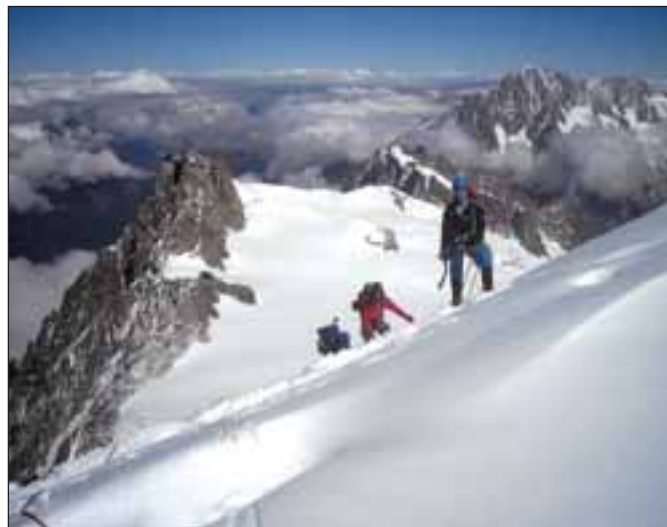
Výstup na Mont Blanc du Tacul s výhledem na Aiguille du Midi