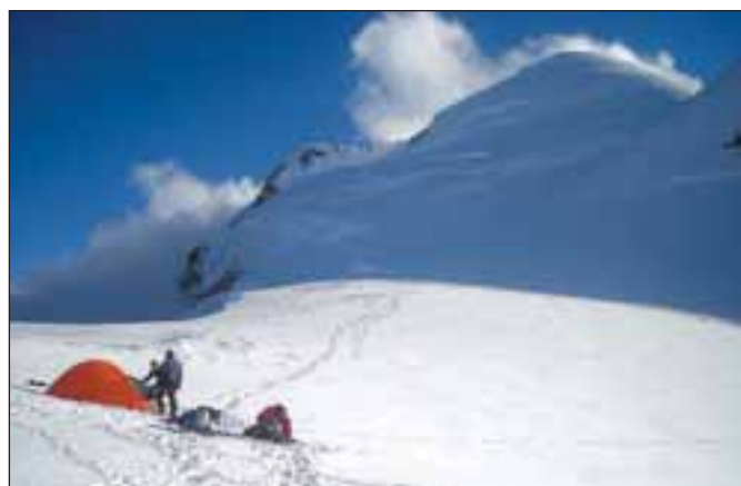
Příprava nouzového noclehu v sedle Brenva pod vrcholem Mont Blancu

T. N. Já se věnuju horolezectví šest let. Myslím, že mojí silnou stránkou je univerzálnost. To znamená lezení v létě i v zimě, na skalkách i horách. Mám za sebou tři zimní a tři letní sezóny v Tatrách, lezení ledů v Rakous-