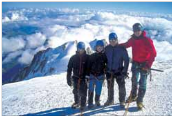
Na vrcholu Mont Blancu s pohledem na cestu, kterou horolezci šli

rá motivace, ne? Ostatně, kvůli přízni žen děláme i horší věci. Stoupat na vrcholy, to je dneska z čistě horolezeckého hlediska passé. Velká část už byla dosažena, mnoho jich bylo „pokořeno“ nebo „dobyto“. Pro nás (a teď