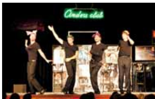
Herci Divadla Radka Brzobohatého excelovali v komedii Vyhazovači