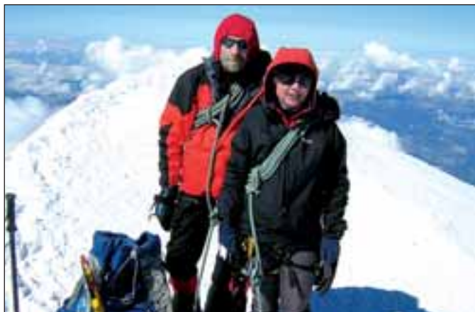
Vrcholové foto z Mont Blancu