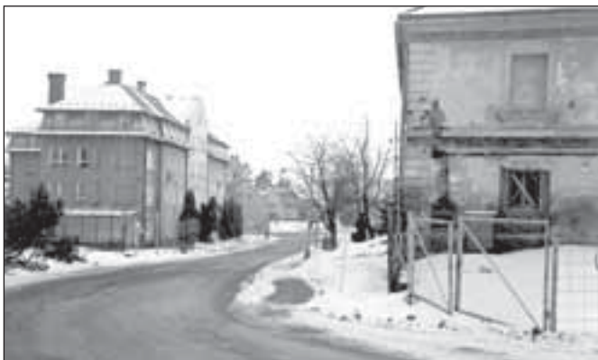
Pivovar r. 1994