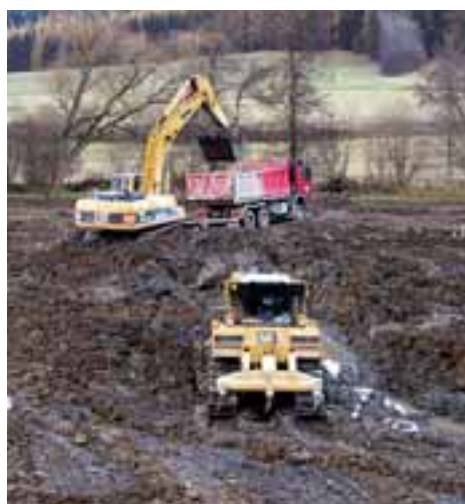
Mokřadní tůň u Jamartic přinese zvýšení biodiverzity v krajině