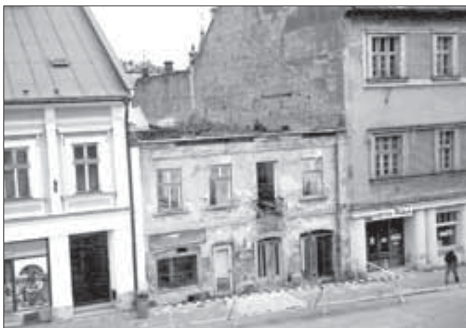
Náměstí Míru r. 1995

Volby do městského zastupitelstva se konaly 18. a 19. listopadu. V Rýmařově se před nimi zaregistrovalo devět politických stran. Jejich úspěšnost byla následující: