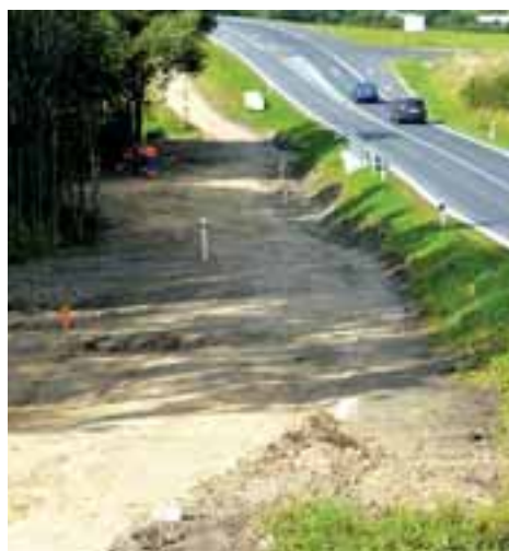
Vzniká cyklostezka z Rýmařova do Ondřejova