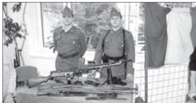
Výstavu fotografií a dokumentů doplnili členové klubu vojenské historie expozicí výzbroje a výstroje rumunské královské armády ze 30. a 40. let

Mramorový pomník s bronzovou pamětní deskou a dominantní plastikou orla byl vybudován nejen jako pocta houževnatému let-