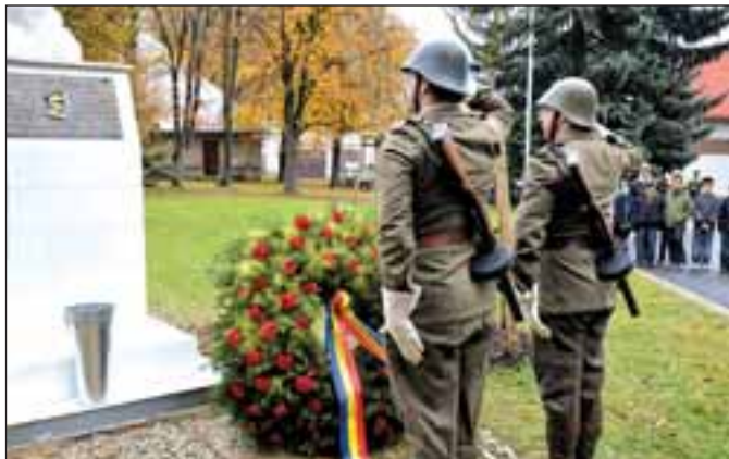
Členové klubu vojenské historie pokládají věnce k památníku