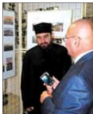
Vernisáž výstavy v SVČ