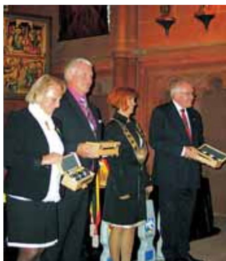
Partnerská města slavila kulaté výročí spolupráce