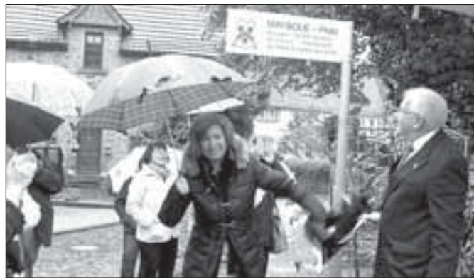
Slavnostní odhalení Maybolského náměstí

každoroční pracovní setkání zástupců Sdružení pro mezinárodní spolupráci všech partnerských měst, jehož hlavní náplní byly kromě rekapitulace akcí stávajícího roku především návrhy akcí a projektů připravovaných jednotlivými partnerskými městy v roce následujícím.