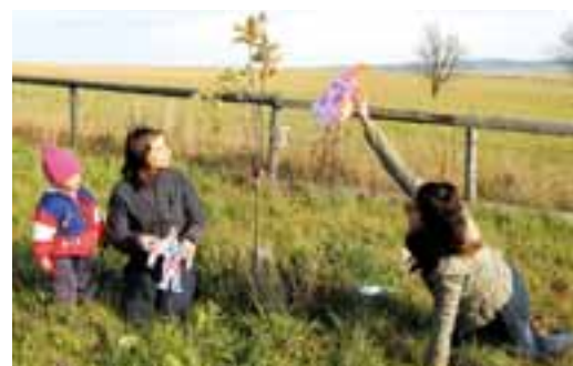
Na Usedlosti Jasanka v Albrechticích u Rýmařova se slavil Den stromů