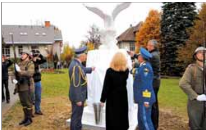
Slavnostní odhalení památníku rumunskému letci