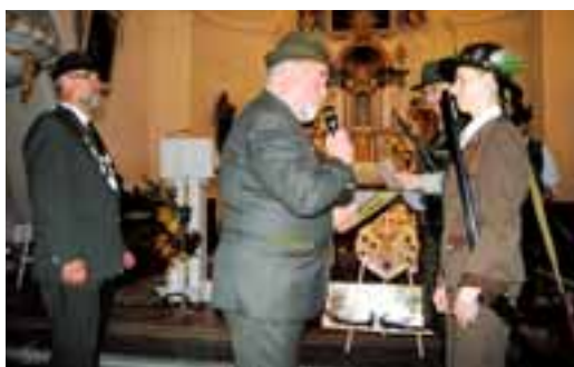
Svatohubertská mše v Malé Morávce uctila patrona myslivosti