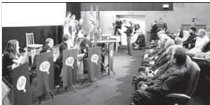
Před oficiálními projevy si přítomní vyslechli krátký koncert v podání hudebníků ZUŠ Rýmařov

Výstavu fotografií a dokumentů doplnili členové klubu vojenské historie expozicí uniforem, výzbroje a výstroje rumunské královské armády ze 30. a 40. let. Předvedli zbraně, helmy, typické rohaté čepice, ale i autentické zápisy z bojů na Hronu nebo polní oltář rumunských vojáků. Expozici doplnily ukázky výstroje československé armády včetně letecké uniformy ze 30. let. ZN