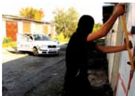
Bezpečnost občanů a firem zajišťuje nová posila