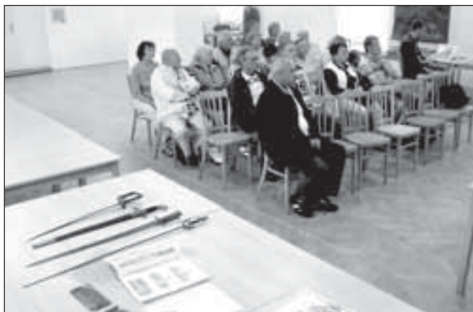
Beseda občanského sdružení Staré Sovinecko v Lomnici