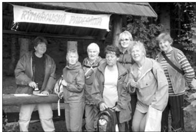
Jeseníky, Jelení studánka

Je pravdou, že v mnoha odbozech KČT, stejně tak v rýmařovském, chybí členové mladší a střední generace. Je však mnoho těch, kteří raději chodí do přírody sami nebo se svou rodinou a přáteli. Je mnoho i těch, kteří mají raději rychlejší pohyb v přírodě a jezdí na výlety na kolech. Na stavu turistiky se podepisuje i finanční situace rodin, dojíždění za prací, nezaměstnanost ad. Není možné nutit lidi, aby pěstovali pěší turistiku nebo cykloturistiku, stejně tak není možné nutit někoho ke členství v KČT, i když to přináší určité výhody a stávající členy by to jistě potěšilo. Je možné pouze lidi přesvědčovat a doporučovat jim vhodné trasy.