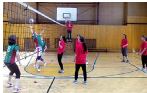
Mladým rýmařovským volejbalistům se daří, po 4. kole jsou druzí