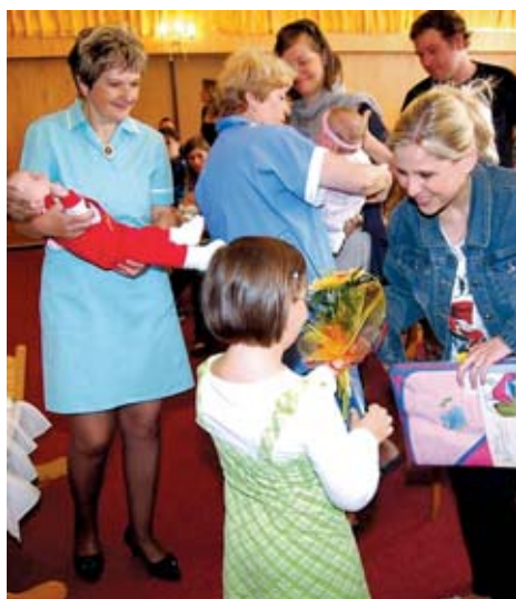
Zástupci města slavnostně zapsali do knihy nově narozené občánky