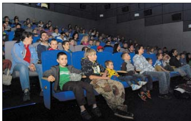
Kino promítalo hlavně pro děti - animovaný Čtyřlístek