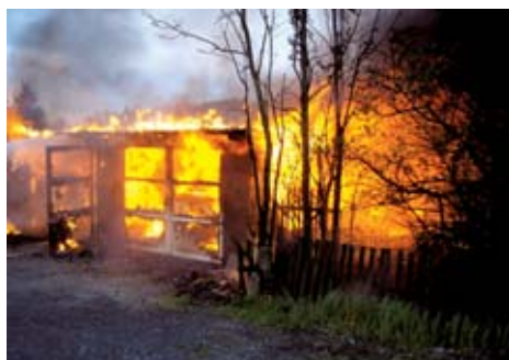
Ve Staré Vsi shořela dřevěná garáž i se zaparkovaným vozidlem