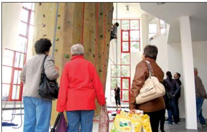
Po celý den byla budova SVČ v obležení zvědavých návštěvníků, pro které byl připraven bohatý program