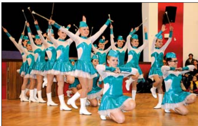
V odpoledním programu vystoupily zájmové kroužky z Rýmařova i Polska, venku hrálo divadlo na chůdách