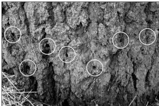
Místa děr navrtaných do kmene