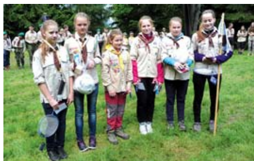
Na Svojsíkův závod přijeli Na Stráň skauti z celého okresu Bruntál