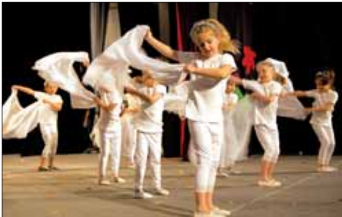
MŠ 1. máje, Vánoční