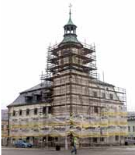
Na radnici se opravuje fasáda, obnoveny budou i věžní hodiny