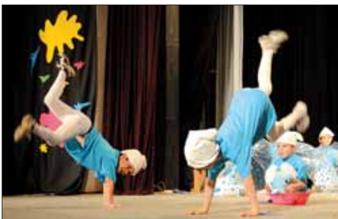
MŠ Revoluční, Šmoulové