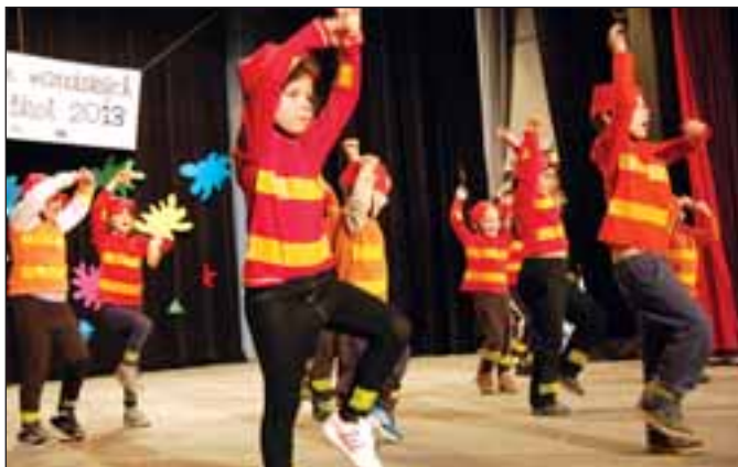
MŠ Velká Štáhle, Hasiči