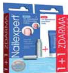
Nailexpert 1+1 ZDARMA