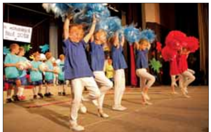
MŠ 1. máje, Zelená je tráva