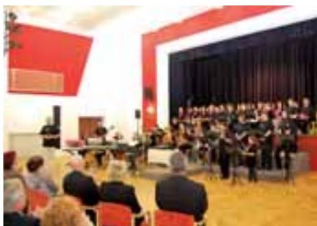
Kulturní stánek Rýmařova byl po rekonstrukci slavnostně předán