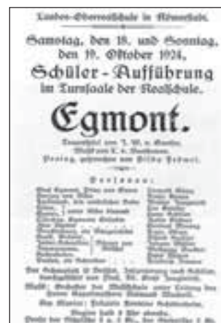
Pozvánka na představení Egmonta