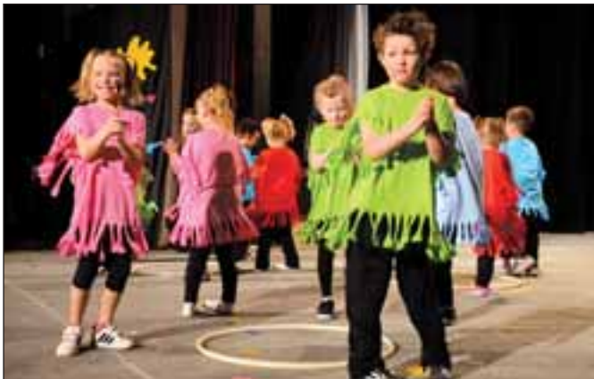
MŠ Horní Město, Strašidylko Emílek