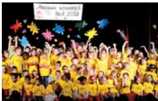
Společná přehlídka mateřinek dostala letos mezinárodní punc