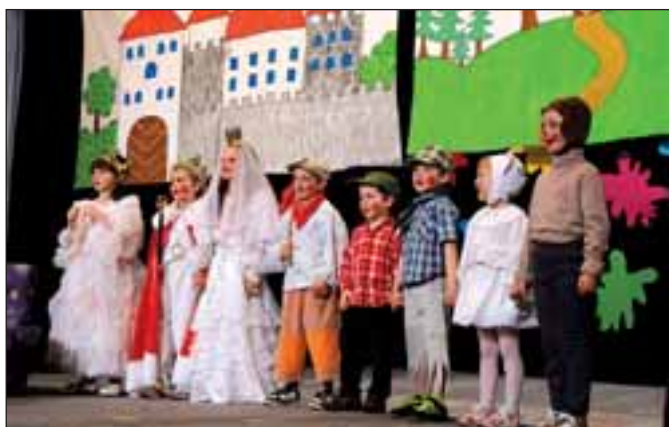
MŠ Malá Morávka, O smutné princezně