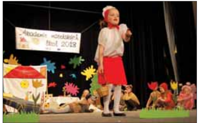
MŠ Jelínkova, O červené Karkulce