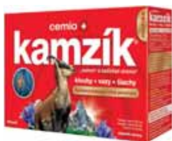
Kamzík 60 KAPSLÍ