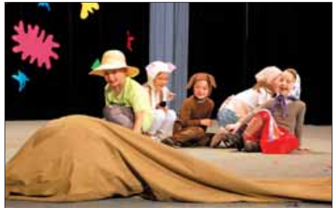
MŠ 1. máje, Pohádka o řepě