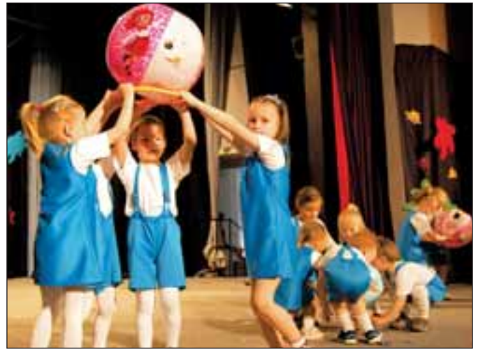
MŠ Revoluční, Balonem na vesmír