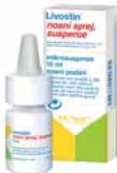
Livostin NOSNÍ SPREJ