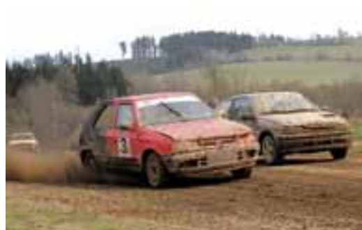
Poslední dubnovou sobotu zahájili autokrosaři novou sezónu