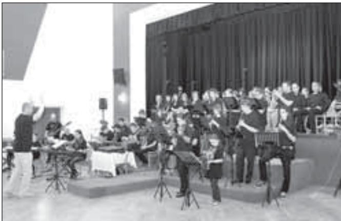
Zuškaband a Vox montana na slavnostním koncertu