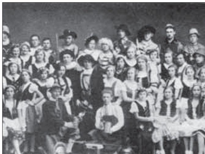
Představení Fausta z r. 1932

(Prameny: Göttlicher, Walter a kol.: Festschrift zur 100-Jahrfeier der Landes-Ober-Realschule Römerstadt 1873-1973 , 1973, s. 65-66; Jungwirth, E.: Die Tafelbilder der Rosenkranzkapelle. Die Bilder der Porkirchen. Römerstädter Ländchen , 1931, s. 81-94; Petermayr, K.: Ernst Jungwirth. Ein vergessener Pionier der Innviertler Volksliedforschung. Im Vierteltakt , März 2000, s. 7.)