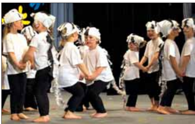
MŠ Horní Město, Zebra