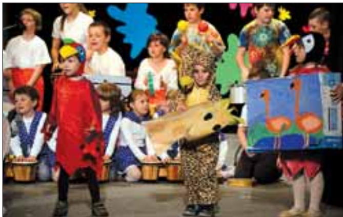
MŠ Stará Ves, Afrika