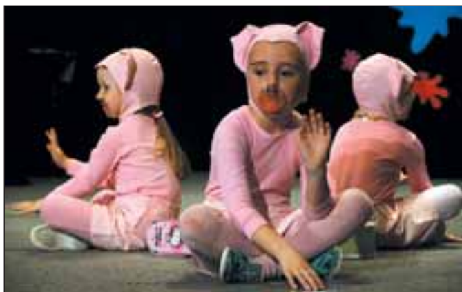
MŠ Jelínkova, Tři čunčci jdou