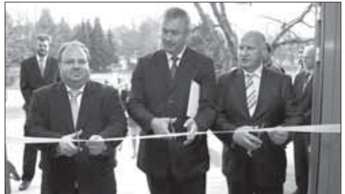
Zleva: hejtman kraje Miroslav Novák, starosta města Petr Klouda a poslanec Parlamentu České republiky Ladislav Velebný