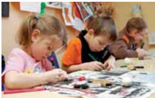
Ve Středisku volného času se děti o prázdninách nenudíly