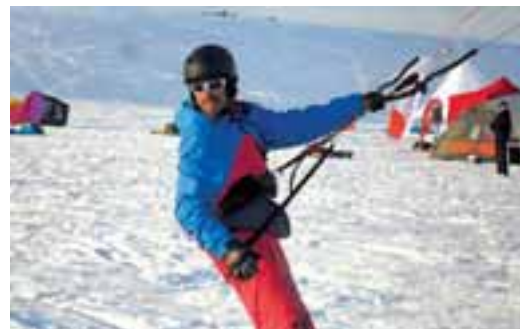
V Ryžovišti se jel poslední závod Českého poháru ve snowkingingu