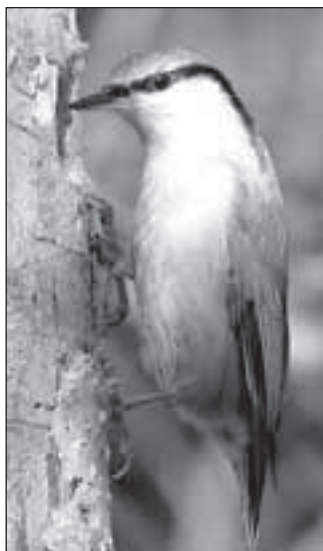
Břhlík lesní si prohlíží dutinu

hlížejí různé stromové dutiny a vyvěšené hnízdní budky a začí-