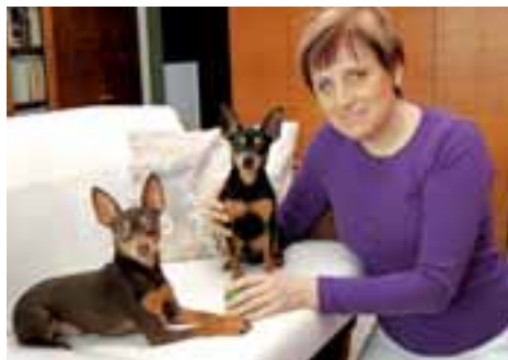
Když se z konička stane kůň – reportáž o psích šampiónech