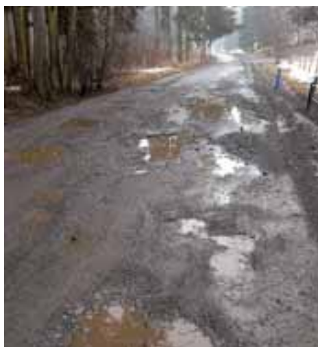
Téma vydání - Cestou necestou aneb Kdy opět na silnice?