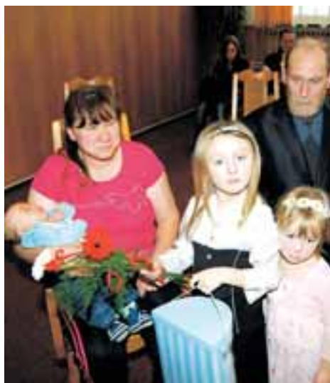
Vítání dětí se zúčastnilo i první rýmařovské miminko roku 2013