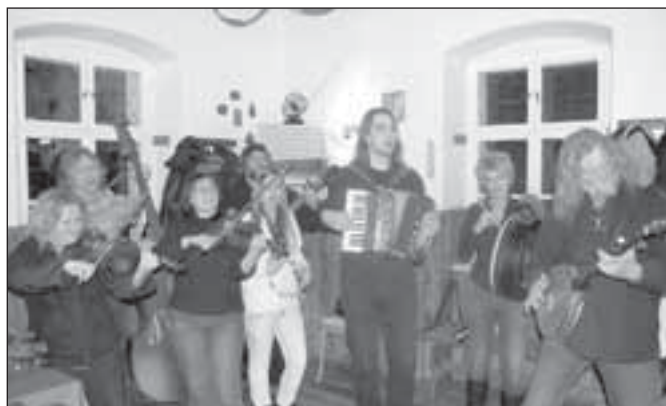
Kelt Grass Band