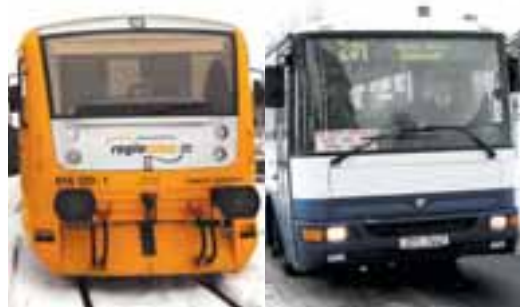
Nové jízdní řády 2012/2013 – odjezdy autobusů a vlaků z Rýmařova