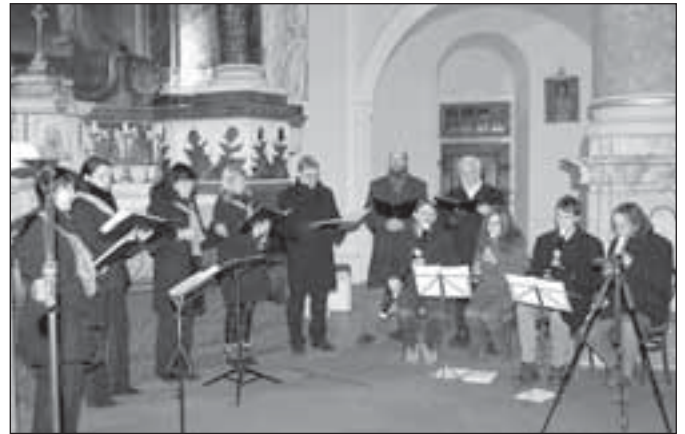
Komorní sbor Florian z Jeseníku s Jeseníckým flautinem