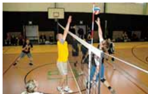
Volejbal žil i v době sváteční