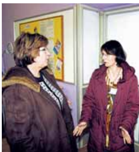
Ministryně Ludmila Müllerová navštívila Rýmařovsko