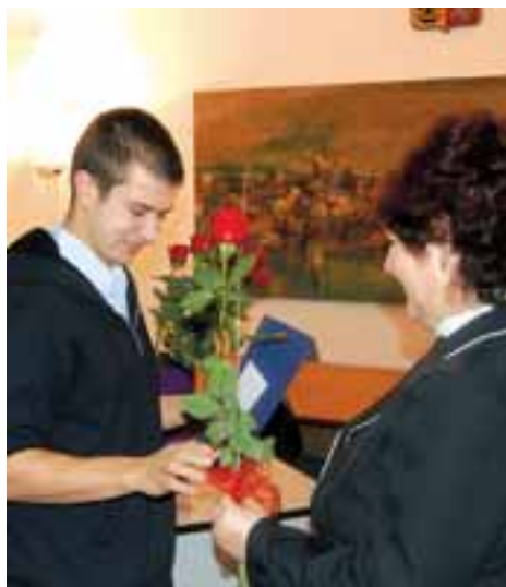
Město ocenilo úspěšné studenty