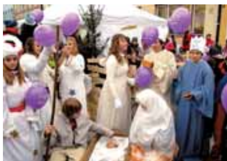
Ohlédnutí za adventem a vánočními svátky