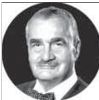
Karel Schwarzenberg (23,4 %)