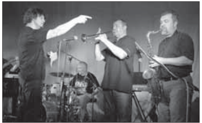
Krásné nové stroje