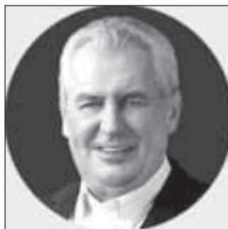
Miloš Zeman (24,2 %)

V Rýmařově se volilo ve 12 volebních okrscích, celková účast byla 52,21 % a odevzdáno bylo celkem 3732 platných hlasů. V Rýmařově zvítězil Miloš Zeman, který od voličů obdržel celkem 1025 hlasů, na druhém místě skončil Jiří Dienstbier s 831 hlasy a třetí Jan Fischer s 693 hlasy. Nejvyšší volební účast zaznamenal okrsek č. 9 - Ondřejov (71 %), naopak nejnižší účast byla v okrsku č. 4 - náměstí Míru, Školní náměstí, ulice Horní, Jungmannova, Národní 2 - 15 a Příkopy (35,76 %).