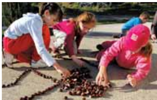
Nedělní škola řemesel ve Stránském: Kaštánkohraní pro malé i velké