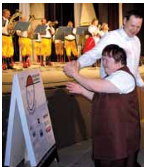
Koncert pro Kouzelnou buřinku se konal již popáté