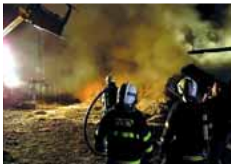
Devět hasičských jednotek zasahovalo v Břidličné u požáru stájí