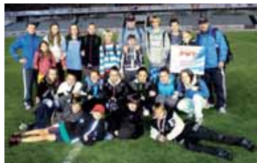
Úspěšné pražské finále Odznaku všestrannosti pro žáky ZŠ Rýmařov