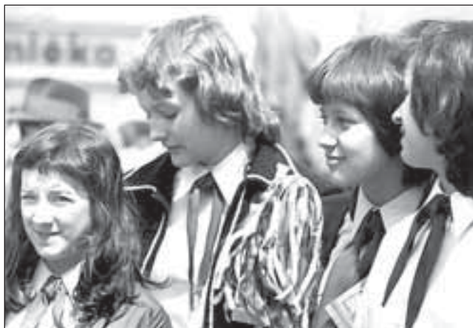
1. máj 1974