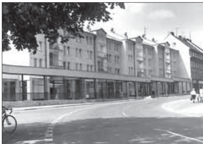
Výstavba - Gottwaldova - Radniční