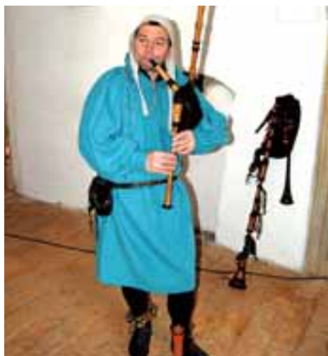
Hofmistrova závěť uzavřela brány hradu Sovince pro letošní rok