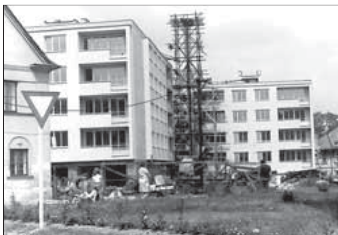
Výstavba - Dukelská, 1975

A závěrem jedna tragická událost - autohavárie s nešťastným koncem. Stala se v neděli 10. listopadu 1974 mezi Rýmařovem a Malou Štáhlí. V osobním autě jelo pět mladých lidí. Na konci rovného úseku řidič nezvládl řízení