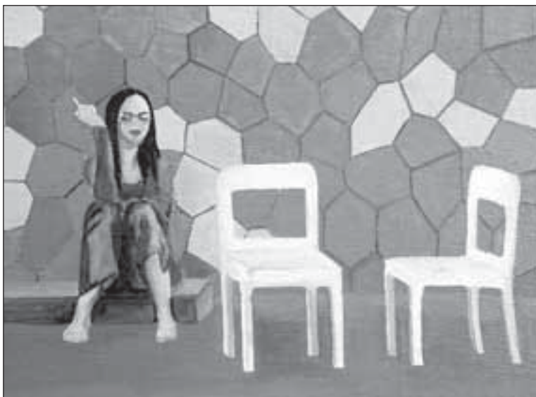
Ilustrace: Daniela Pospíšilová

„E... Do-dobry,“ zakoktala. Usmál se a zmizel za dveřmi. Ještě otočená k němu zaškorbtla na posledním schodě a málem spadla. Zachytila se zábradlím. Jako omámená pokračovala dál. Vyšla do večerních ulic s viditelně lepší náladou a zapálila si další cigaretu. Potáhla a usmála se tak, že z ní kouř vyšel nosem.