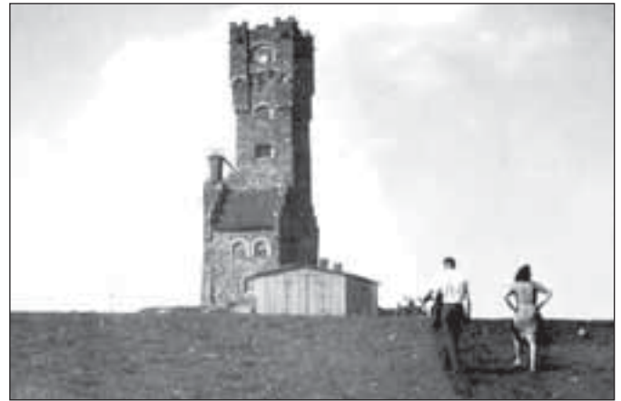
Cestou na Praděd

jektu. Nakonec ale rozhledna musela být v roce 1957 pro svůj stav, hlavně z hlediska bezpečnosti návštěvníků, uzavřena. Ve stěnách byly zjištěny až 6 cm široké trhliny, které často prostupovaly celou zdí do délky až 3 m. Přípravovaná rekonstrukce, při níž měla být věž uvnitř zpevněna železobetonovou rámovou konstrukcí a zevně opevnuta ocelovými pásy, se už neuskutečnila. Věž se ještě před příchodem dělníků pro zajištění generální opravy dne 2. května 1959 samovolně zřítíla. Od té doby byl na vrcholu Pradědu vedle Poštovní chaty jen malý objekt meteorologické stanice (z roku 1951) a pro turisty malá provizorní dřevěná útulna. Pod vrcholem Pradědu byly ale v té době už provozovány nové horské chaty - Barborka (1942), Ovčárna (1953) a Kurzovní chata (1955).