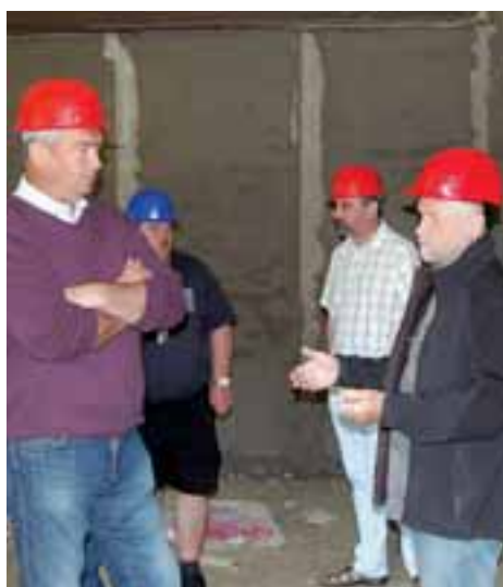
Rekonstrukce hrubé stavby Střediska volného času je hotova