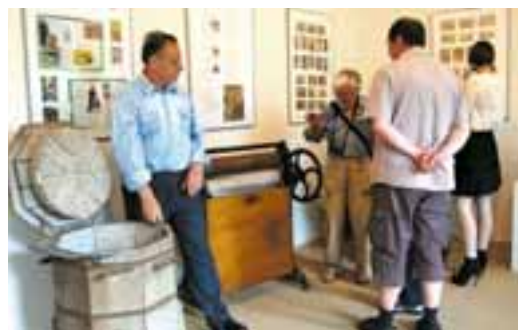
Od valchy k pračce, od mandlu k žehlicímu prknu - výstava v muzeu