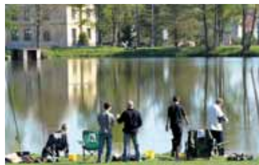
Zlatá udice 2012: Rybářské závody mládeže na edrovickém rybníku