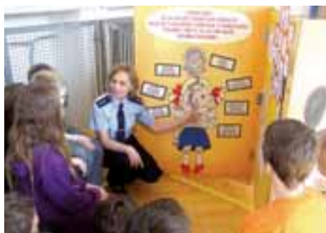
Policejní projekt na ZŠ Rýmařov: Tvoje správná volba