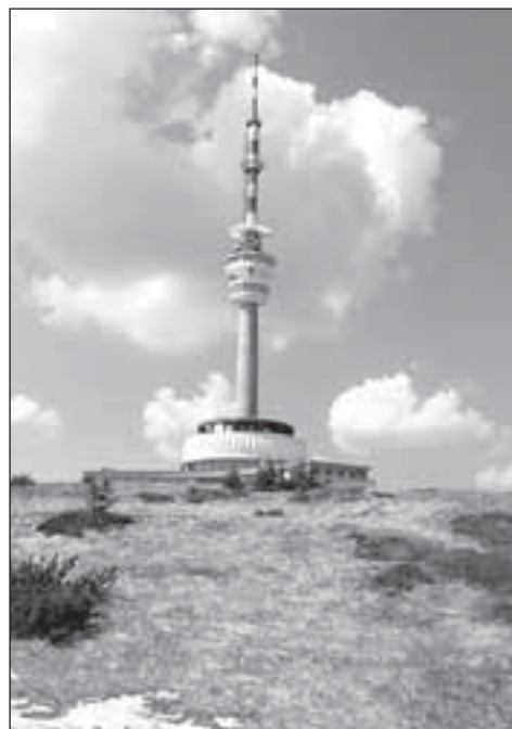
Vysílač na Pradědu

Po skončení války a po osvobození v roce 1945 byla rozhledna opět dána do provozu, její správce Státní lesy v Karlovicích uvažoval dokonce o její rekonstrukci. Konkrétního dlouhodobějšího správce však věž neměla, protože s poválečným odsunem Němců zanikl i dřívější sudetský turistický spolek MSSGV. V roce 1951 se správy rozhledny ujal spolek Turista Praha, který zahájil nezbytné kroky k záchraně tehdy už značně zchátralé stavby. Měla být snesena horní část a zbudována nová nosná konstrukce, z toho ale sešlo, a tak se věž jen částečně opravovala. Svě vykonali i vandaloové, kteří ničili interiér i stavbu samotnou, do objektu střechou a okny navíc silně zatékalo. Rozhledna tak chátrala nadále, a to přestože bývalý KNV Olomouc svým usnesením ze dne 20. 6. 1956 rozhodl o postupné opravě a rekonstrukci celého ob-