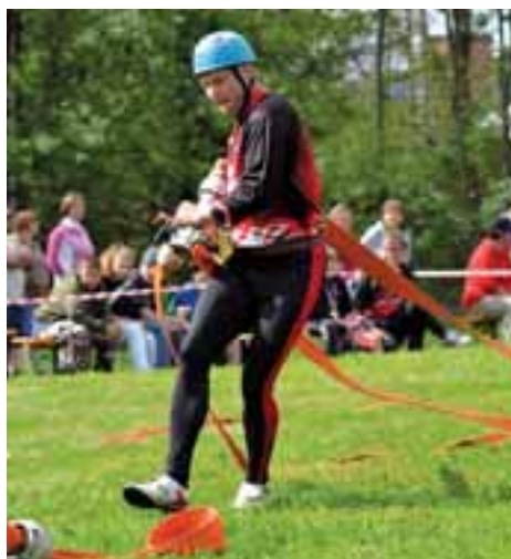
Dobrovolní hasiči změřili své síly v Janovicích