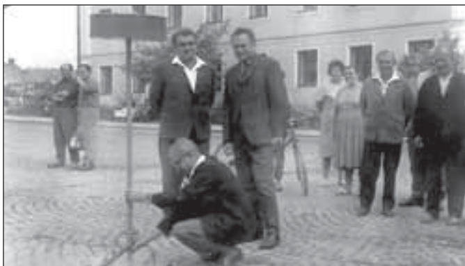
Slavnostní zapálení plynu, 3. 8. 1967

vsak nevyřešila všechny požadavky na umístění dětí.