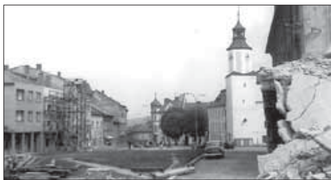
Bourání Jungmannovy ulice, 1967

tů a dvou distribučních jednotek na Gottwaldově (dnes Radniční) ulici a na náměstí. Na Hornoměstské ulici otevřela 9. září Hedva nové jesle pro 70 dětí. Jejich výstavba začala v roce 1964 a stála 1,4 mil. korun. Ani kapacita nových jeslí