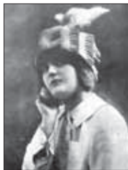
Klobouk bordeau sláma