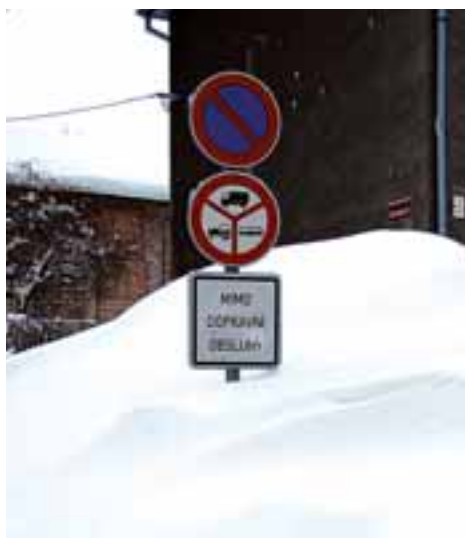
Město Rýmařov kalamitní stav vyhlásit nemuselo