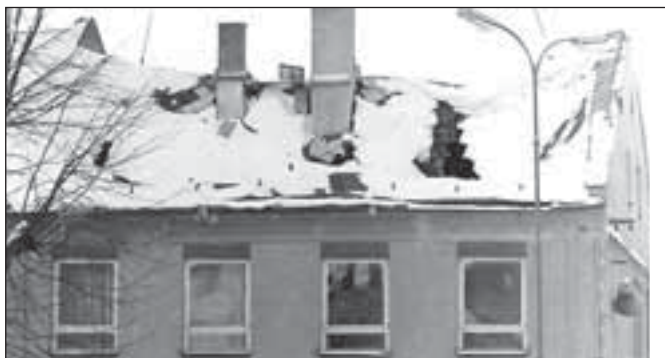
Propadlá střecha Domu služeb, únor 1967