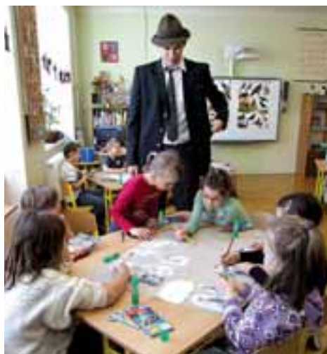
Zábavná minimyslivost pro žáky I. stupně ZŠ Rýmařov