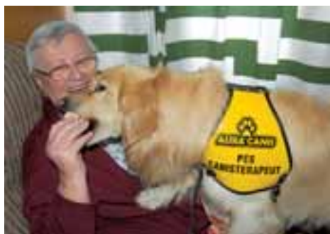
Jak psi pomáhají klientům Diakonie a Buřinky