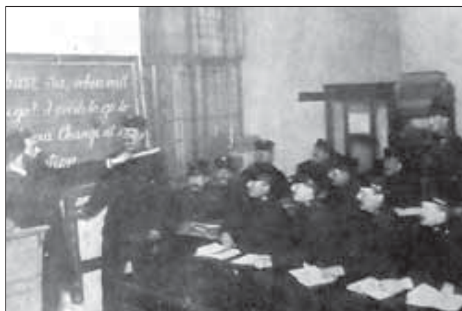
Škola tramwayových konduktérů ve Vídni, kteří učí se anglicky a francouzsky, aby mohli dorozumět se s cizinci

Jak čáp přezimuje. Jistý šlechtic polský dal na své usedlosti nedaleko Lvova lapit čápa, jemuž navlečen na krk železný kroužek s nápisem „Haec ciconia Polonia“ (tento čáp jest z Polska). Na jaře vrátil se čáp, byl opět chycen a na jeho krku vedle železného kroužku nalezen nový proužek zlatý s nápisem: „India cum donis omittit ciconiam Polonia“ (Indie posílá obdarovaného čápa zpět Polákům).