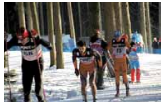
Rýmařováci startovali ve světovém poháru běhu na lyžích