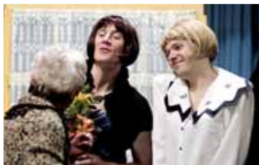
Amatérský spolek Mahen zve na premiéru