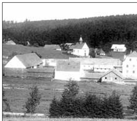
Veverří kolem roku 1900 (kaple Nejsvětější Trojice a dědičná rychta)

Text a repro: Jiří Karel (L. Vargová, L. Horáčková, M. Menšíková: Zdravotní péče o brněnské obyvatele v 18. a 19. stol., Brno 2010, Maehrens Maenner, lékařský časopis, Brno 1910)