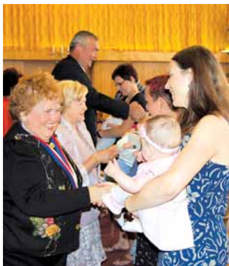
V neděli uvítalo město Rýmařov do života nové občánky