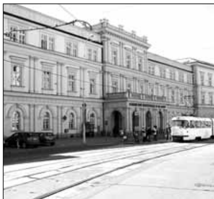
Nyní Fakultní nemocnice sv. Anny

Zřejmě jej dobré bydlo, jak to u mladých bývá, poněkud pájilo, a tak vyrazil na zkušenou do tajemného Orientu. Zastihl ještě poslední léta Osmanské říše přímo v jejím srdci, a nikoli v podřadné instituci. Přijal místo v nejlepší zdravotnickém zařízení na východ od monarchie, v německé nemocnici v Cařihradu. Německo tehdy podobně jako jiné státy usilovalo o přizvání Turků a prezentovalo se nejlépe, jak umělo, třebaže ruský car nazýval sultánův stát nemocným mužem na Bosporu.