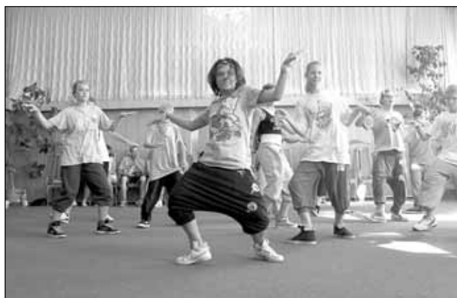
Taneční soustředění Move2you