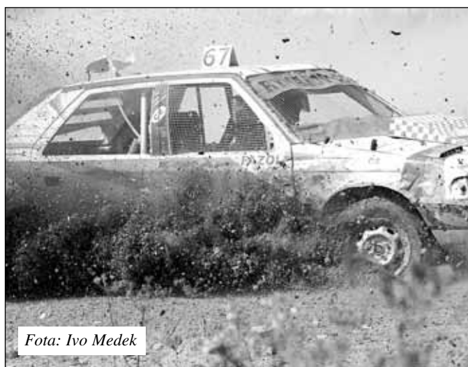
Fota: Ivo Medek