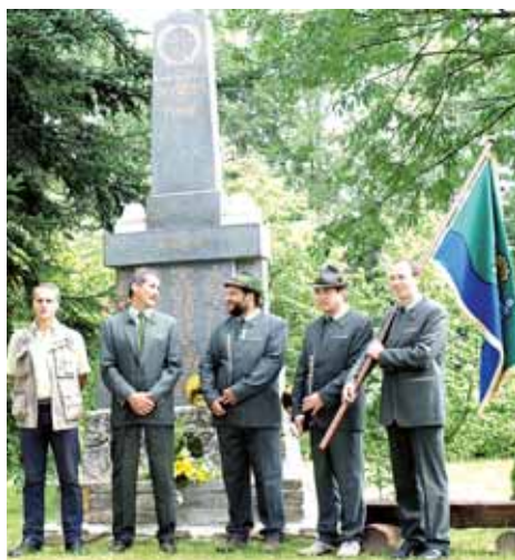
Obec Stará Ves oslavila 450 let od svého založení