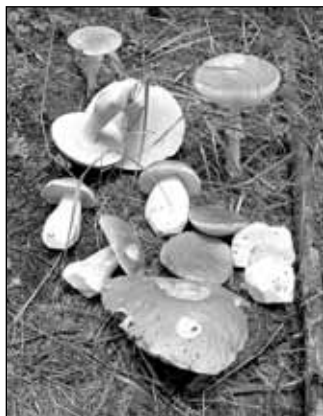
Pestrá nabídka lesa