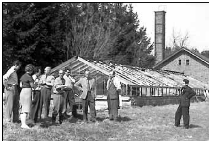
Jaro 1961, část učitelů jedenáctiletky na nově získaném pozemku na Hornoměstské ulici

Druhým rokem pokračovaly adaptační práce v kině za 1 220 tisíc Kčs. Dokončena byla přestavba polikliniky na Pivovarské ulici nákladem 700 tisíc Kčs, v květnu byla budova předána veřejnosti.