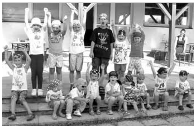
Se Sluníčkem za piráty