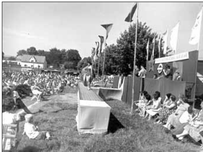
V rámci Mezinárodního družstevního dne připravila Jednota módní přehlídku na hřišti Jiskry