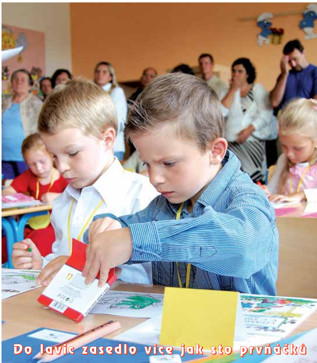
Do lavic zasedlo více jak sto prvňáčků