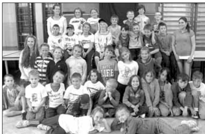
Prázdniny v pohybu