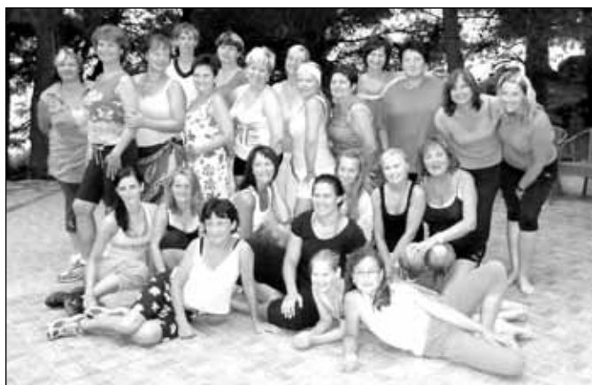
Léto s tancem