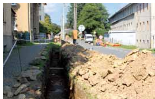
Na Bartákově ulici probíhá rekonstrukce plynovodu