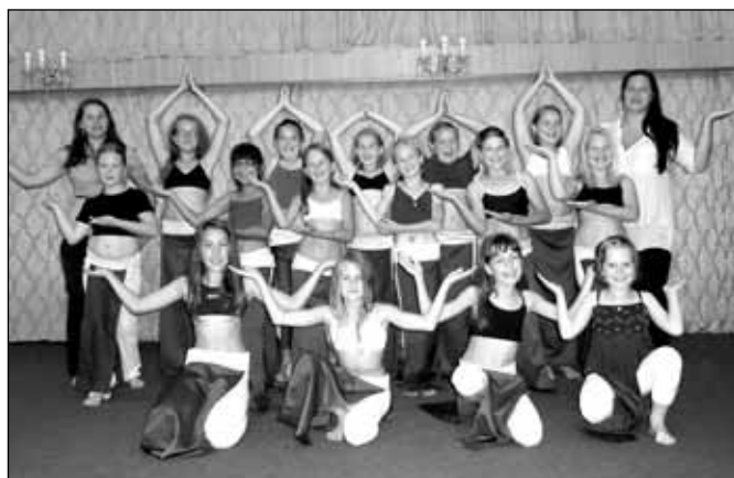
S Kleopatrou k pyramidám