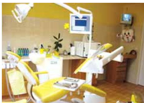
Kam a kdy k lékaři v Rýmařově: adresy, ordinační doba, kontakty