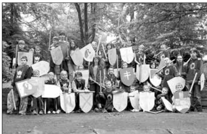
Putování za svatým grálem