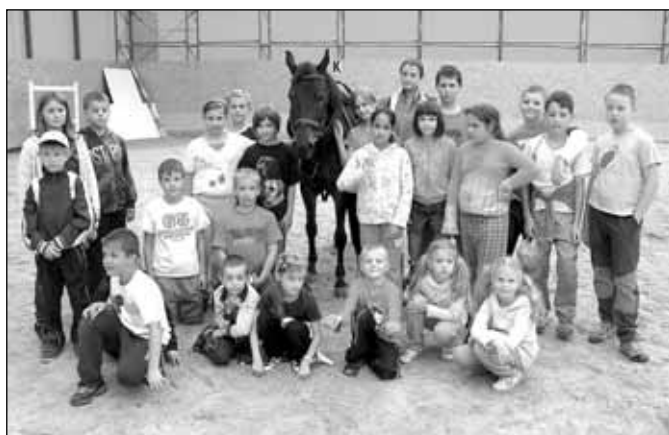
Cesta kolem světa za 5 dní