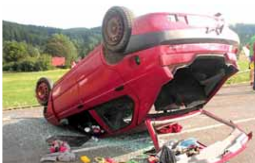
Že alkohol za volant nepatří, už ví i 22letý řidič vozu Alfa Romeo