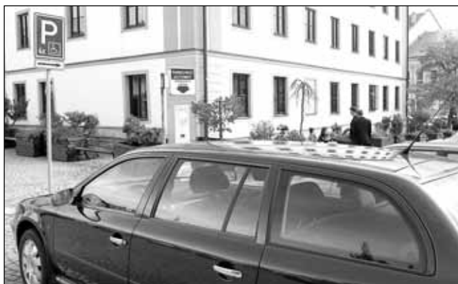
Parkovací automat na nám. Míru

V letošním roce byla do rozpočtu odboru DaSH na posudky a projekty schválena částka 30 tisíc Kč. Do 31. července 2011 nebyl