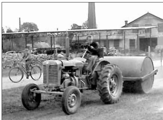
Budování školního hřiště na Palackého ulici, 21. 10. 1961

Také výbojkové osvětlení od nádraží až k Edrovicím bylo úspěšně zvládnuto, bylo však dosti poruchové. Tolik akcí mohlo být zahá-