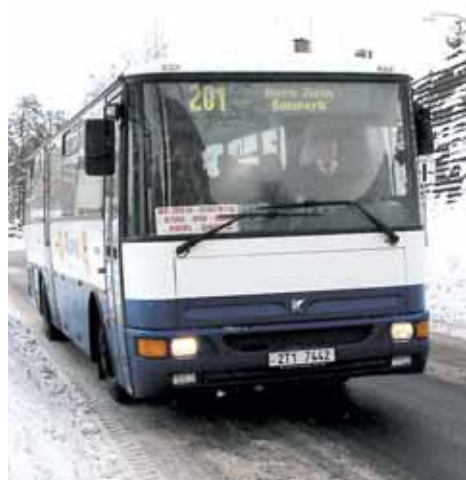
Jízdní řády pro rok 2011 – odjezdy autobusů a vlaků z Rýmařova