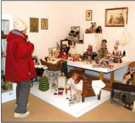
Vánoční čas patří hlavně dětem - muzeum pro ně připravilo výstavu starodávných hraček...