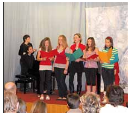
K Vánocím patří také hudba - vánoční kolekty při besídce ZUŠ...