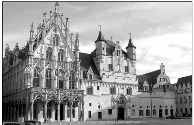
Radnice v Mechelen