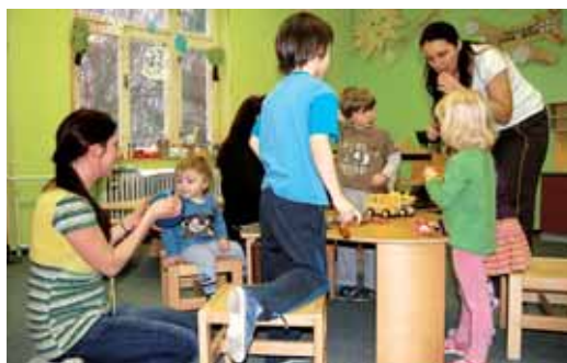
Středisko volného času najdete od ledna na Bartákově ulici