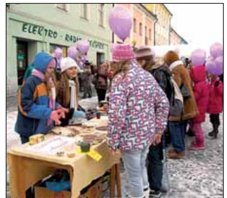
...nebo při vypouštění balonků s přáním Ježíškovi