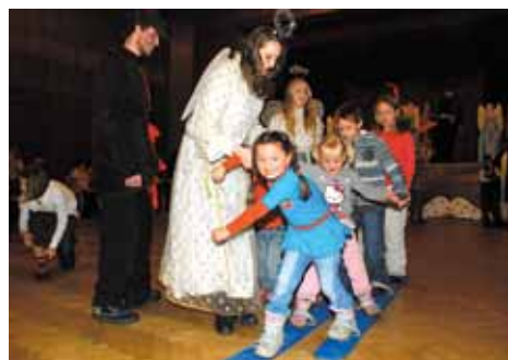
Od Mikuláše po Tři krále aneb Jak v Rýmařově ubíhal sváteční čas