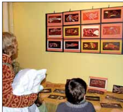
...a vánočního kapra „servírovali“ i mladí výtvarníci ze ZUŠ