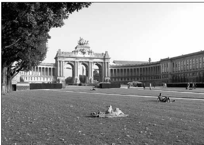
Vítězný oblouk v Bruselu

si být přece přístupné, kdyby se věřící chtěl pomodlit. Navštívili jsme tedy nádhernou katedrálu v Mechelen, zasvěcenou světcí s nezvyklým jménem Sint Romboud (česky sv. Rombold). Dóm naplněný nádhernými plastikami, oltáři zářícími zlatem či úžasnými deskovými malbami skvělých starých Vlámů. Za vraty skleněná kukaň s příjemnou starou paní, jsme z Česka, kde už se platí vše a stále víc kromě vzduchu, nebo se mýlím? My honem do kapsy se zděšením, kolik bude vstupné. Paní se upřímně směje, tady se neplatí a s fotoaparátem na krku mě odhadne. Říká synovi anglicky, Belgičan by totiž věděl, a jestli chce tatínek fotografovat, tak samozřejmě může cokoliv. V obrovitém prostoru je pohoda, cvičí tu chrámový sbor v prastarých lavicích otřelých staletími, nedařle si tisknou ruce milenci, tam se modlí starý muž, je stále živo a všude Japonci. Druhý den Brusel, u vítězného oblouku neodoláme ohromnému vojenskému muzeu, třebaže nejsou dějiny moderní Belgie od roku 1830 dlouhé, jsou sály naplněny k prasknutí, opět fotografuji anglický tank z roku 1918, poslední typ spitfira s pětististou vrtulí, třímotorový junkers, uniformy pilotů RAF, co sloužili s našimi. Jen je po válce doma nezavírali do vězení a nevráždili. Celá ta nádhra zdarma, ono se totiž v Belgie neplatí ani v muzeích či galeriích, a jsou tak plné lidí. Když to světová organizace muzeí a galerií navrhla i nám s tím, že kultura patří všem, ohrozil naše chamtivé kulturtrégrejny infarkt. Zázrak jménem Ypry (Iper), měs-