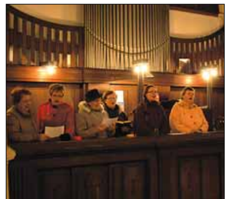
...a úplně na konec novoroční koncert Rýmařovského chrámového sboru