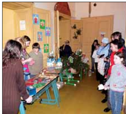
Nakoupit dárky pod stromeček jste mohli na jarmarku základní školy...