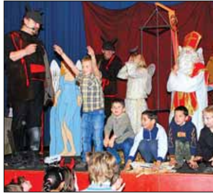
...Středisko volného času zase mikulášské soutěže