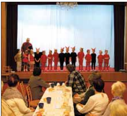
...na odpoledne rýmařovské Diakonie zase za seniory