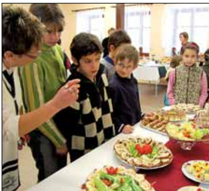
Inspiraci pro vánoční stůl nabídli žáci ZŠ na Školním náměstí...