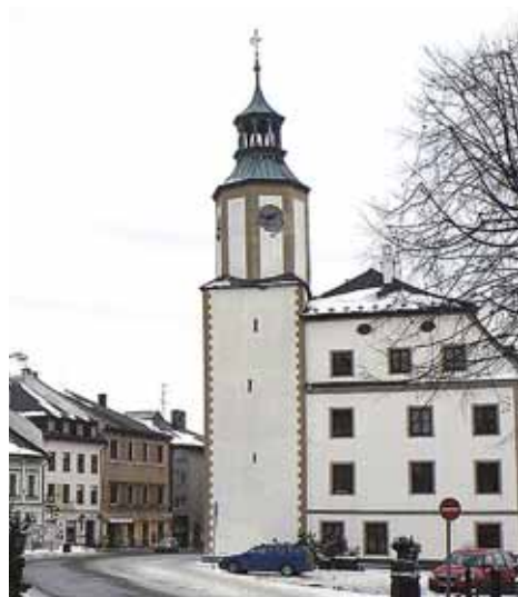
Zastupitelstvo schválilo rozpočet na letošní rok