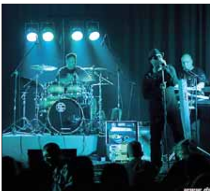
...Bigbeatové Vánoce...