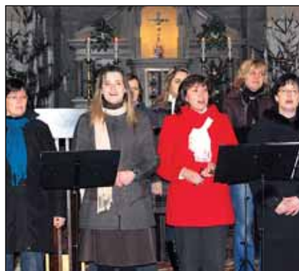
...vánoční koncert Variací v kostele arch. Michaela...