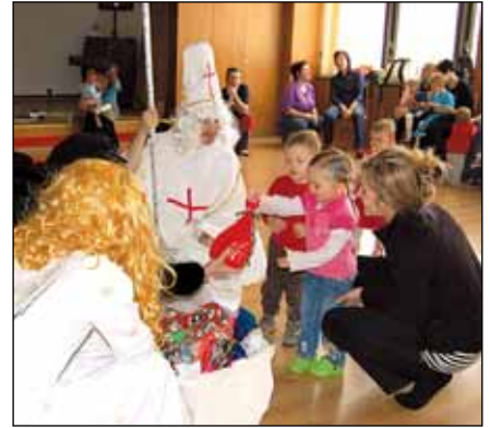
Do mateřského centra Sluníčko přišel Mikuláš za nejmenšími dětmi...