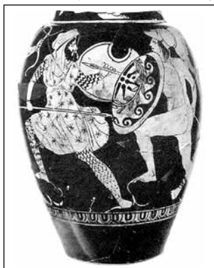
Peršan a řecký hoplita

Termínem barbar označovali staří Řekové původně všechny, kdo mluvili cizím, pro ně nesrozumitelným jazykem. Slovo je to zvukomalebné, bar-bar znamená totéž, co naše bla-bla. Jinak toto označení nemělo pro cizince hanlivý význam. Situaci v tomto směru změnily řecko-perské války. Slovo barbar se tehdy užívalo hlavně pro označení Peršanů, ovšem úměrně s tím, jak se ve válce Peršané chovali, měnil se i význam označení barbar. Ještě Hérodotos mluví o barbarech (Peršanech) jako o schopných skvělých děl a činů, ale v souvislosti se svým vítězstvím na sebe a svou kulturu i politickou organizaci Řekové začali stále více pohlízet