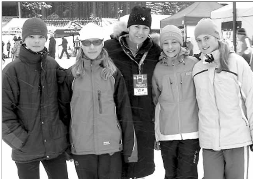
Starší žáci Ski klubu RD Rýmařov s Kateřinou Neumannovou.

Výsledky všech rýmařovských běžců na lyžích můžeme jistě hodnotit jako kvalitní a proto jim gratulujeme a přejeme úspěchy i v příštích sezónách.