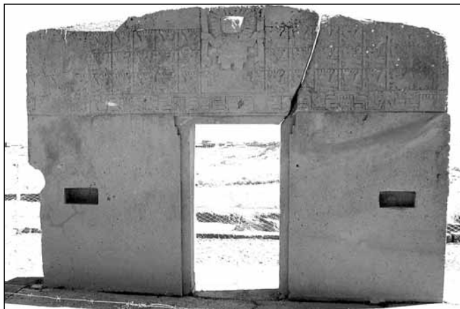
Sluneční brána Tiwanaku, údajně nejstarší kalendář na světě

benů And vytvořila zejména vulkanická činnost. Zajímavostí je, že na Sajamě, ve výšce přes 6 000 m, pořádají Bolívijci každoročně fotbalové zápasy. Rádi také pozvou na Altiplano fotbalisty z jiných zemí, kteří zde pak nejsou schopni ani přeběhnout hříšně, a radují se z jejich porážky. Oblast je zajímavá nejen geologicky a krajinově, pro nás bylo zážitkem též pozorování typických divokých lam, majestátních kondorů či pštrosů nandu, chvíle štěstí jsme prožívali též při koupání v liduprázdných přírodních termálech.