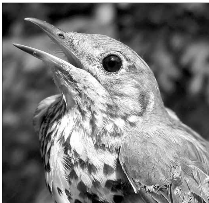
Drozd brávník zvěstuje jaro

Muzeum v Bruntále si Vás dovoluje pozvat na slavnostní otevření nové lesnické expozice v karlovické kosárně ve čtvrtek 1. dubna 2010 v 10.00