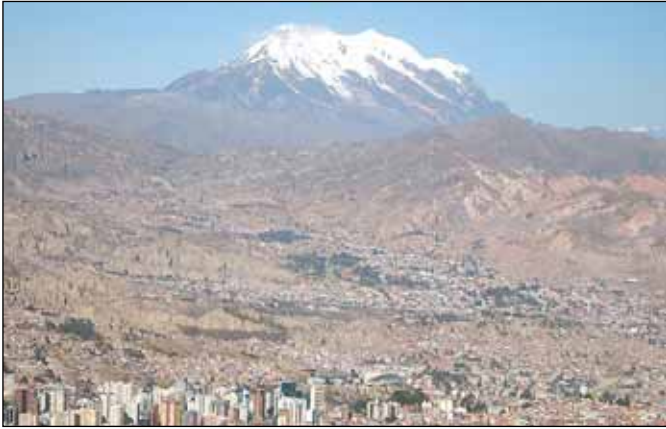
La Paz, v pozadí Illimani