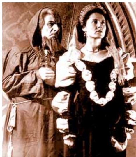
Galerie Octopus: od 7. 4. výstava k 65. výročí divadla Mahen