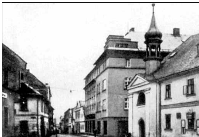
Kaple sv. Josefa v 1. pol. 20. stol.

Dne 25. května přijíždí do Rýmařova třiašedesát příslušníků Stráže