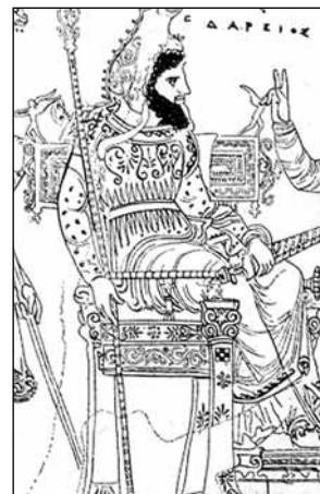
Perský král Dareios