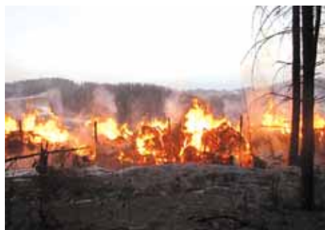
V Malé Morávce shořely bývalé stáje