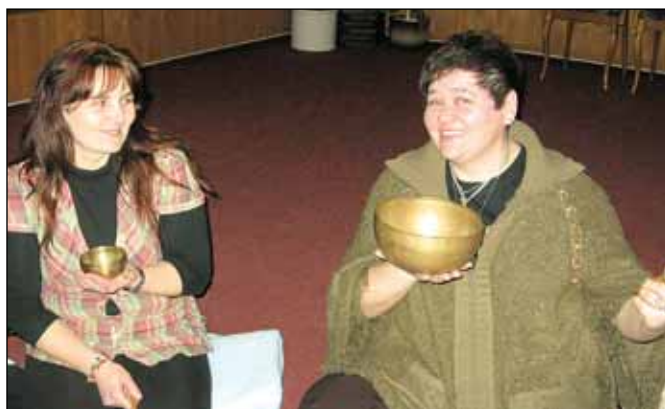
Práce s tibetskou miskou