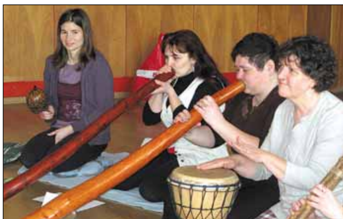
Tibetské hudební nástroje