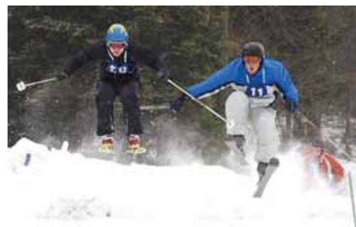
Ve Staré Vsi se jely závody ve snow- boardcrossu a skicrossu