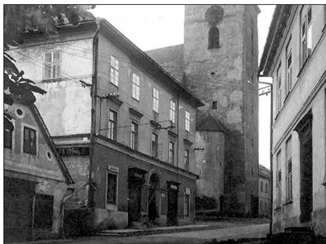
Národní ulice v roce 1923

Mezi školou a zástavbou na opačné straně Národní ulice v jednom směru a zdi a kostelem ve směru druhém se kdysi nacházel městský hřbitov. Vědění, válka a víra tak tvořily pěkný významový trojúhelník, v jehož středu seděla smrt. Existenciální symbolika prostoru nicméně dlouho nevydržela, neboť přibývalo a začali spolu nepřijemně soutěžit o místo, bylo tedy nutné jejich shromaždiště přesunout. Novým cílem pohřebních průvodů se stal pozemek pod dnešním Střediskem volného času. Nelze se zbavit dojmu, že bychom byli často velmi překvapeni, vědět, po čem šlapeme. Vrátime-li se zpět na Národní č. 2, v rohu dnešního second handu se kupříkladu nacházela kostnice, kde se schraňovali ti, kteří při výkopu nových hrobů vyšli na světlo boží a museli uvolnit místo mladším. Posvátná půda ovšem nechránila před strachem a pověrami, spíš naopak, byly zde například nalezeny kostry s lebky mezi kolony - důsledek tehdejší ochrany proti upírům, ježž metodologickou bohatost dokládají četné archeologické nálezy. Useknutí hlavy bylo procedurou z těch jednodušších. Jen tak mimochodem, tradice zohavování mrtvol kvůli strachu z vampyrismu pokračo-