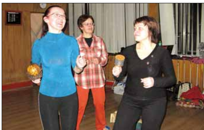
Tanec s rytmickými nástroji