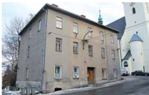
Od kostnice a lékárny k second handu aneb Historie Národní č. 2