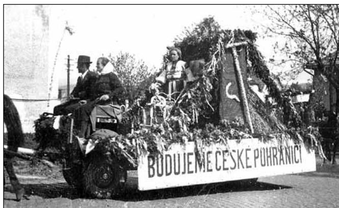
Hraničáři hlásají: Budujeme české pohraničí