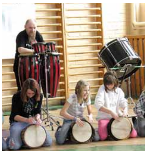
Malí bubeníci hráli na Základní škole v Břidličné s Jumping Drums