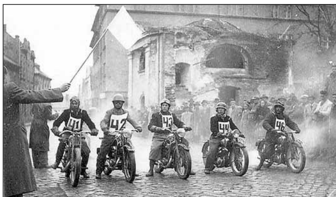
V pozadí kaple sv. Josefa, 50. léta