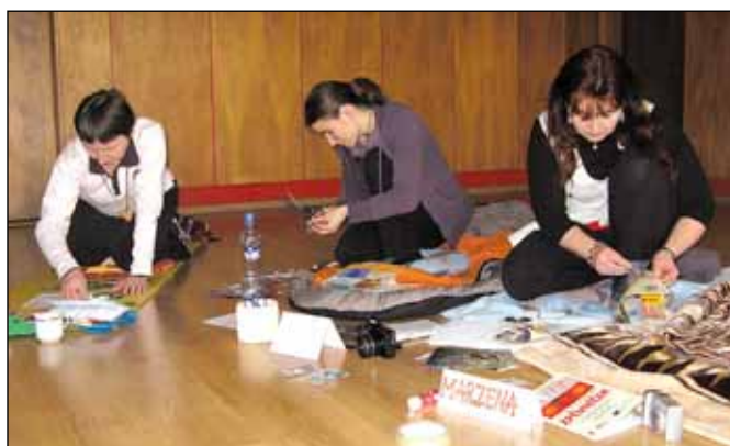
Výroba zvukových koláží