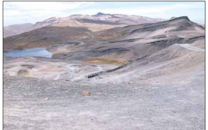
Start Chorro Trail