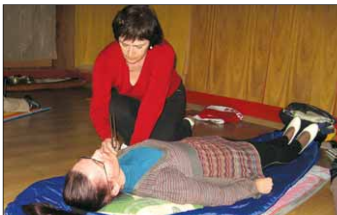
Práce s ladičkou