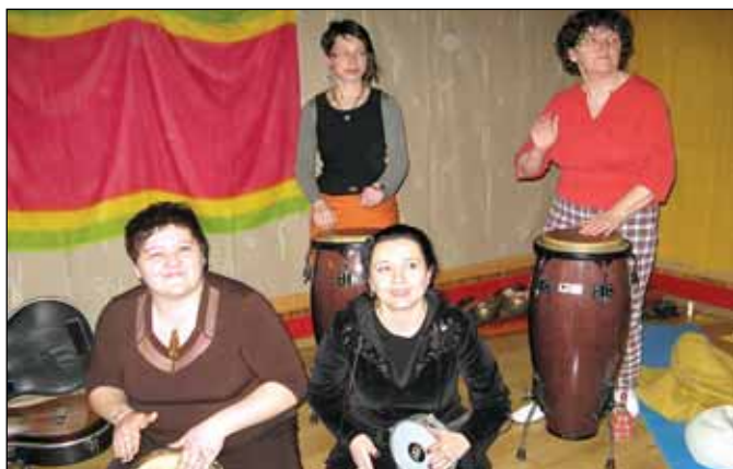
Bubny a bubínky