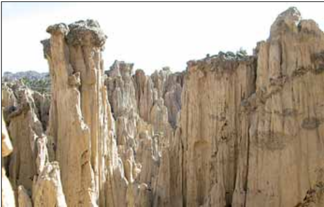
Zemní pyramidy Moon Valley