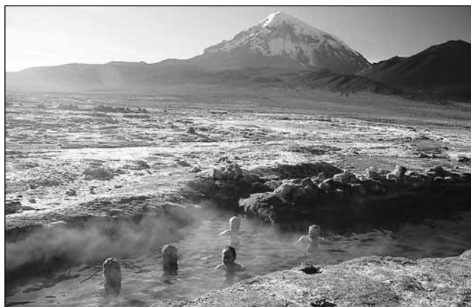
Termál pod Sajamou

Dále jsme absolvovali tzv. Chorro Trail - pěší trek po incké stezce spojující Altiplano s Amazonií (z 4 800 m n. m. do 1 500 m). Cestou jsme prošli několika vegetačními pásmy od pásma alpinského, prakticky bez vegetace, až po pásmo tropické. V tomto pralese jsme viděli zcela běžně růst mnoho rostlin, které u nás pěstujeme jako pokojové. Obdobnou trasu mezi Altiplanem a nížinou jsme absolvovali též na kole, a to po tzv. Cestě smrti (neopakovatelné je na tom