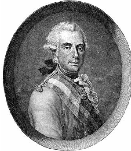
Gen. Gideon Arnošt Laudon

kou jízdu, jež bývala často najímána do cízích služeb, považovala Evropa za jednu z nejstatečnějších a nejnebezpečnějších vojáků. Polští huláni na tradičně dokonale vycvičených koních byli ozbrojeni rovněž karabi-