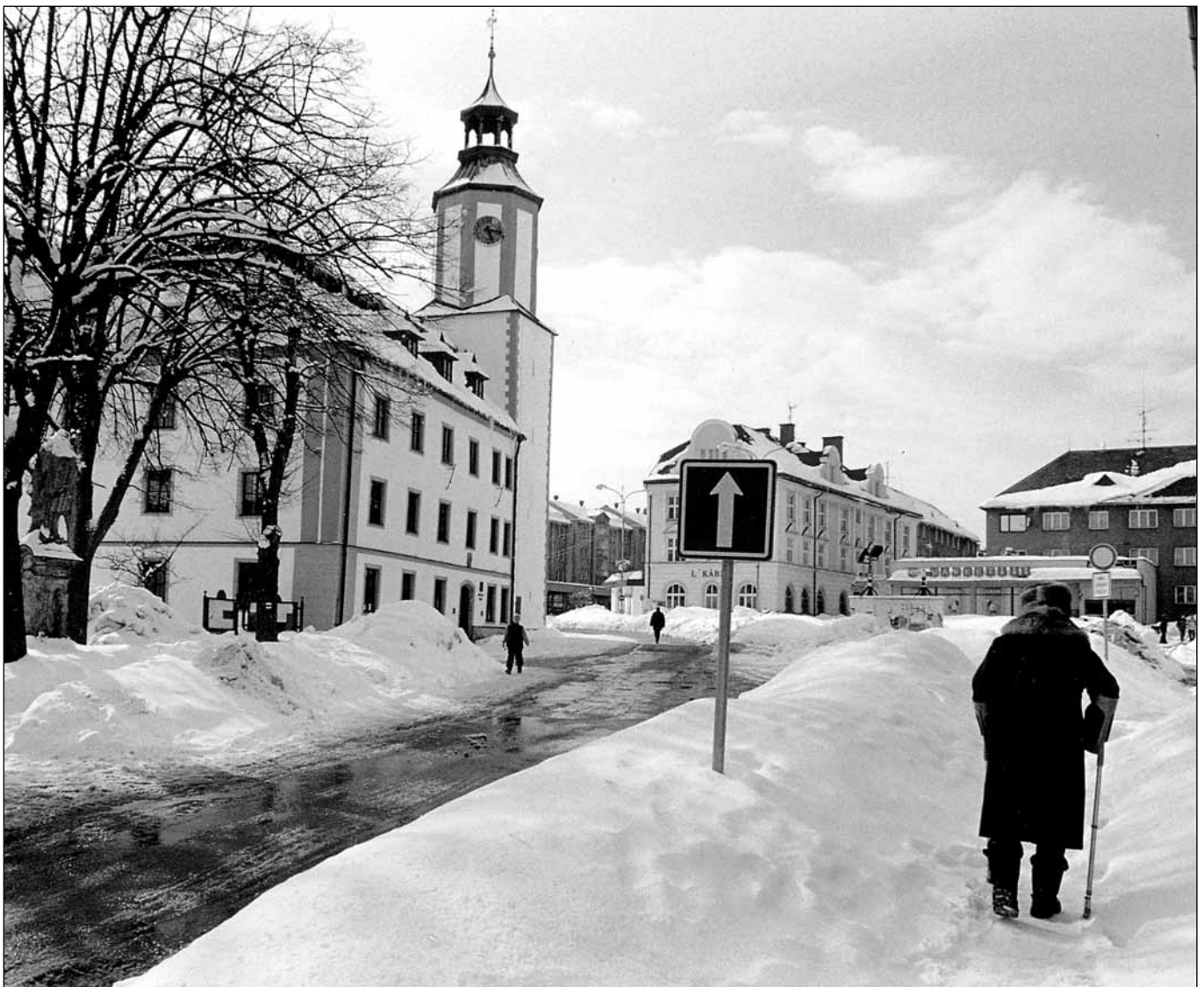
Zima v Rýmařově