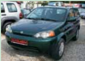
Honda HR-V 1,6 77 kW, r.v. 1999