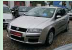
Fiat Stilo 1,6 - 16 V LPG 76 kW, r.v. 2002

ABS, klima, 6 míst, servis. kniha 164.900,- Kč