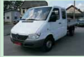
Mercedes-Benz Sprinter 311 CDI valník, r.v. 2001

7 míst, tachograf, tažné zařízení 279.900,- Kč + DPH