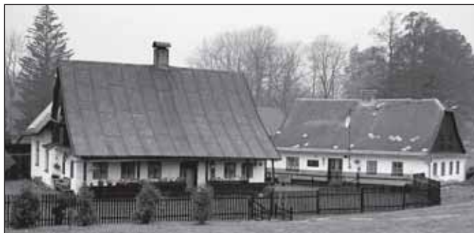
Jesenické domy v Janušově

Naše výlety k zajímavým stavbám rýmařovského regionu a spolu s tím do historie okolních obcí se pomalu chýlí ke konci. Čekají nás už jen dvě zastávky – první v Edrovicích a Janovicích, druhá ve Staré Vsi, kde třileté putování po pozoruhodnostech Rýmařovska zakončíme.