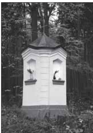
Boží muka v Novém Poli

lezce barevné fotografie Karla Schinzela, stojí další drobná sakrální stavba, kaplička se zvonící,