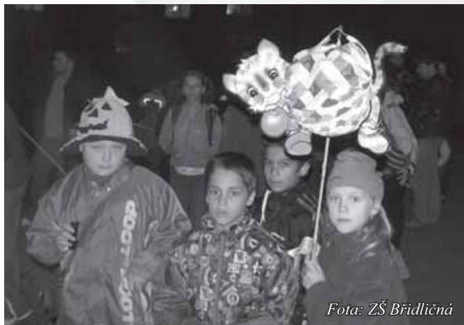
Fota: ZŠ Břidličná