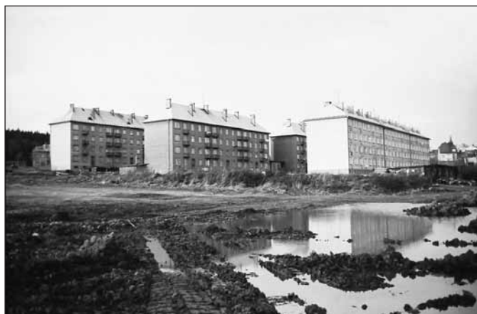
1. etapa stavby domů na Hornoměstské ulici, 1966