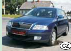
Škoda Octavia II 1,6 75 kW, r.v. 2005

1. majitel, klima, servis. knížka 249.900,- Kč