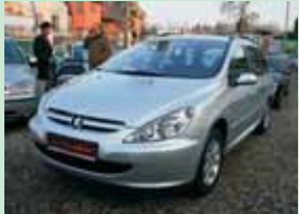
Peugeot 307 1,6 i 16V LPG combi, 80kW, r.v. 2002