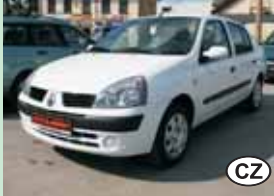
Renault Thalia 1,4 Authetique Plus, 55 kW, r.v. 2005

klima., or. navigace, 6 o převodovka 269.900,- Kč