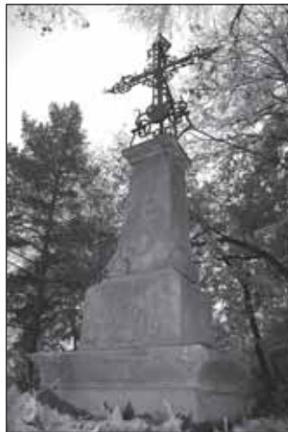
Kříž v Edrovicích

Z památek zůstal v osadě zachován kovaný kříž na pískovcovém podstavci z poloviny 19. století, údajný výrobek janovických železáren, spíše však tepaná kovářská práce. Poblíž restaurace U Hrozna, rodného domu vyná-