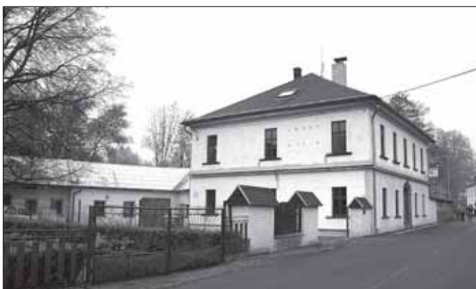
Dům Leopolda Spitzera

jednoduchým oltářem, několika obrazy a sochami, která slouží zároveň jako pomník první svě-