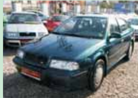
Škoda Octavia 1,9 TDI SLX 66 kW, r.v. 1997