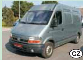
Renault Master 2,2 dCi 66 kW, r.v. 2001

1. majitel, 3 místa, servis. kniha 179.900,- Kč