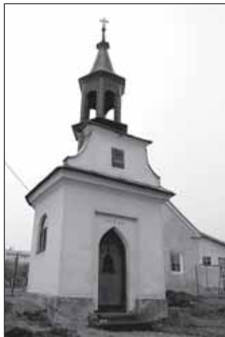
kaplička v Edrovicích

byl vždy osadou spíše zemědělskou; rozkládá se v relativně úrodném údolí Podolského potoka, podél důležité dopravní spojnice se Šumperkem. Podle urbáře rabštejnského panství byl Janušov jednou z nejbohatších vsí, skutečný rozkvět jí