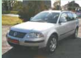
VW Passat 1,9 TDI, combi 96 kW, r.v. 2004