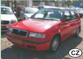
Škoda Felicia 1,3 LX 50 kW, r.v. 1999