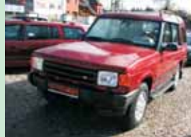
Land Rover Discovery 2,5 TDi 83 kW, klima, r.v. 1996

1. majitel, klima, 4x4, tažné, 7 míst 159.900,- Kč