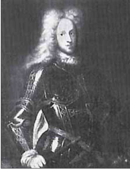
Velmistr František Ludvík z Falce-Neuburgu (1694-1732)