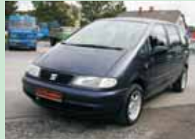
Seat Alhambra 1,9 TDi 66 kW, r.v. 1996