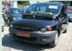
Fiat Multipla 1,9 JTD 81 kW, r.v. 2002

ABS, klima, 6 míst, servis. kniha 164.900,- Kč