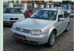
VW Golf 1,9 TDi HIGHL, 85 kW, r.v. 2000

1. majitel, klima, servis. knížka 249.900,- Kč