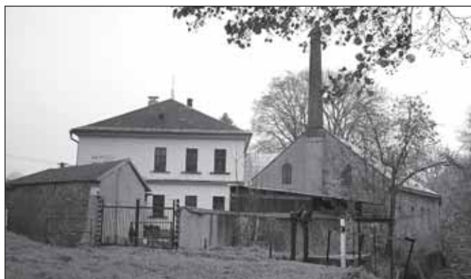
Spitzerova likérka v Janovicích

Název vsi Janovice se objevuje teprve v souvislosti se vznikem tvrze nedaleko Janušova, která nahradila nepohodlný a špatně přístupný skalní hrad Rabštejn, původní sídlo panství. Renesanční tvrz, kterou dal v letech 1520 – 1530 vystavět zástavní držitel panství Petr ze Žerotína, se stala základem pro nynější ja-