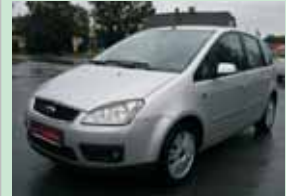
Ford C-MAX 2,0 TDCI GIHIA, 100 kW, r.v. 2004

klima., or. navigace, 6 o převodovka 269.900,- Kč