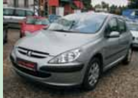
Peugeot 307 2,0 HDi 66 kW, r.v. 2005

1. majitel, klima, servis. hniha 189.900,- Kč