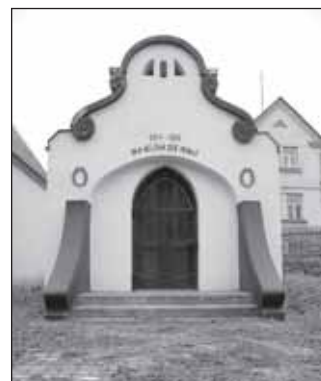
Pomník padlých v Janušově

K zajímavým stavbám Janušova patří i stylově ojedinělý pomník padlých z první světové války, stojící u státní silnice č. 11. Bíle omítnutá menší stavba s tmavě hnědými architektonickými prvky nese stopy doznívající secese. Její průčelí zdobí dva věnce, nade dveřmi nápis 1914 – 1918 Den Helden der Heimat (Hrdinům vlasti) a ve štítu vsazený dělostřelecký náboj. Za prosklenými dveřmi lze spatřit tři desky se jmény 74 padlých obyvatel Janušova, Janovic, Nového Pole a Růžové.