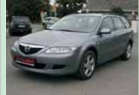
Mazda 6 2.0 TDi combi 100 kW, r.v. 2005

1. majitel, klima, 4x4, tažné, 7 míst 159.900,- Kč