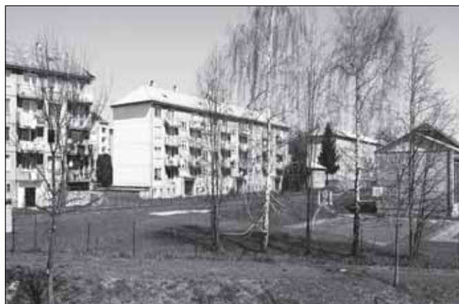
Sídliště na Hornoměstské ulici, 2008