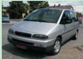
Fiat Ulysse 2,0 JTD 80 kW, r.v. 2001