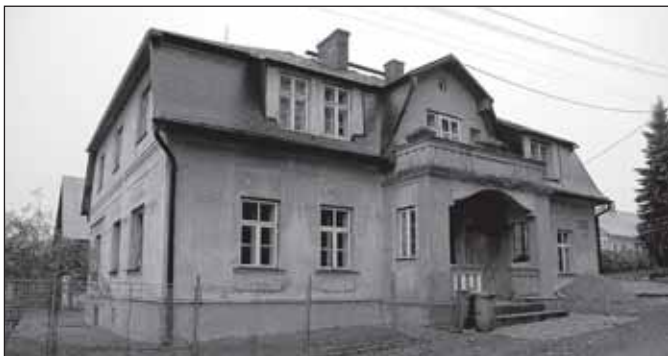
Dřívější hostinec v Novém Poli

lezce barevné fotografie Karla Schinzela, stojí další drobná sakrální stavba, kaplička se zvonící,