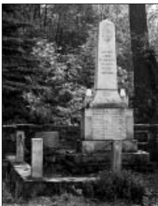
Jiříkov - renovovaný památník

Dalším výsledkem byla poválečná vlna sociálního i nacionálního