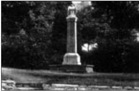
Ryžoviště - původní památník (dobová pohla.)

zámek ve Vídni a Rakousko-Uhersko se definitivně rozpadlo. Osamocené Německo podepsalo příměří a první světová válka skončila. Konečná mírová jednání byla zahájena na zámku Versailles u Paříže. Byl uzavřen tzv. versailleský mír.