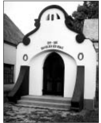
Janovice - památník

Poněkud kuriózní proměnu prodělal také pomník v Tvrdkově - deska se jmény osmnácti padlých občanů obce byla umístěna na „mohyle“ z křemenných balvanů s plastikou orlice na vrcholu. Deska byla v roce 1948 nahrazena deskou se jmény prvních českých osídlenců obce, ta však byla v padesátých letech zničena a v roce 1963 při příležitosti oslav VŘSR byla vsazena nová deska z bílého mramoru s nápisem „Z vděčnosti svým osvoboditelům“, později nahrazená stávající žulovou deskou se zájmenem změněným na „našim“. Orlice patrně vzala za své hned v prvních poválečných dnech. Podobně byl přebudován