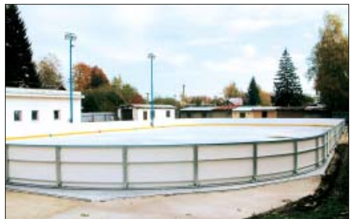
15. listopadu mohou příznivci bruslení poprvé vyrazit na rýmařovskou umělou ledovou plochu