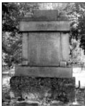
Stará Ves - část žulového pomníku