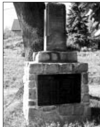
Ondřejov - žulový památník

konci druhé světové války zlikvidovány - např. v Albrechticích u Rýmařova nebo ve Stránském, z řady dalších pak byly odstraněny „německé“ symboly (orlice, rovnoramenné „tlapaté“ kříže, dubové ratolesti, meče apod.) a také desky s vesměs německými jmény obětí první světové války a to, co zbylo, pak bylo použito jako podstavce pro tehdy „aktuální“ pomníky na počest osvoboditelů od nacistického jha. Snad nejtypičtějším příkladem aktivit horlivých funkcionářů minulého režimu je pomník v Sovinci - na mohutném tělese pomníku jsou sochy dvou vojá-