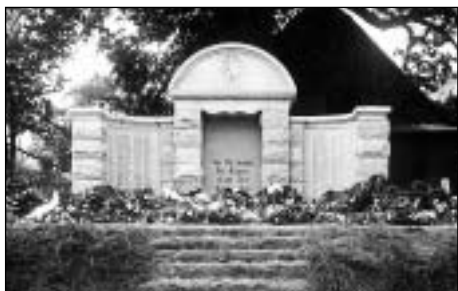
Rýmařov - pomník (dobová pohlednice)

První světová válka. Pojem, který se většiny současné mladé generace dotýká stejně okrajově, stejně jako obrozenecké hnutí, francouzská revoluce nebo třeba kolektivizace zemědělství. Ano,