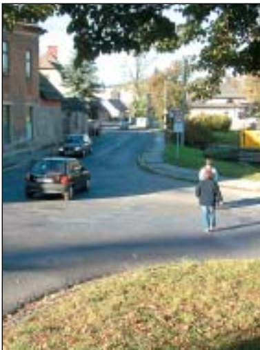
Přechody pro chodce: Jak bezpečně na druhou stranu?