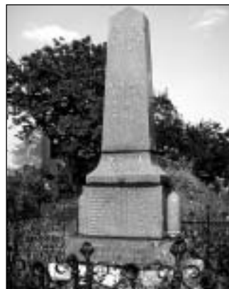
Ruda - žulový památník

V prvních letech Československé republiky bylo vybudováno mnoho pomníků se jmény těch, kteří v první světové válce padli, zemřeli na následky zranění a nemocí nebo se stali nezvěstnými. Vztah obyvatel obcí k pomníkům byl většinou přímo osobní - mezi uvedenými jmény byl vždy někdo, kdo byl buď přímo členem rodiny nebo k ní měl blízký vztah. I přes velký časový