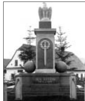
D. Moravice - původní pomník (dobová pohlednice)

chopili, že prohráli válku. Ztroskotala i rakousko-uherská ofenzíva na Piavě v Itálii. Jednání o příměří začala u Padovy v severní Itálii mezi zmocněnci Dohody a Rakouska-Uherska; k podpisu příměří došlo 3. listopadu. 11. listopadu rakouský císař Karel I. podepsal abdikáční listinu, opustil Schönbrunnský