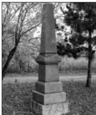
Těchanov - pomník z leštěné červené žuly

Rusku a Itálii, mezi nimi jedno české jméno - Franz Horak. Památník ve formě kapličky ve Velké Štáhli skrývá uvnitř desky se jmény 32 obětí, na prvním místě je uváděn baron v. Stutterheim a mezi německými jmény objevíme také jméno Hajek. V Edrovičích sice zůstala podobná stavba sloužící jako zvonice zachována, desky se jmény však chybí. Ve Stříbrných Horách umístili desku se jmény 14 padlých a zemřelých do místní kaple, ta dodnes podává např. svědectví o tom, že jen několik dní po zahájení války s Ruskem tam 14. srpna 1914 padl první z místních občanů - Otto Pösel, na ruské frontě zahynulo ještě devět dalších. Svým způsobem ojedinělým je pomník v Těchanově - na rozdíl od většiny památníků, které jsou zhotoveny ze světle šedé nebo tmavé žuly, je zde použita žula červená. Žádná jména však na pomníku uvedena nejsou. V Horním Městě se údajně tehdejší radní při jednání o vybudování pomníku neshodli, a obec tak zůstala bez památníku. Při bližším zkoumání jmen pad-