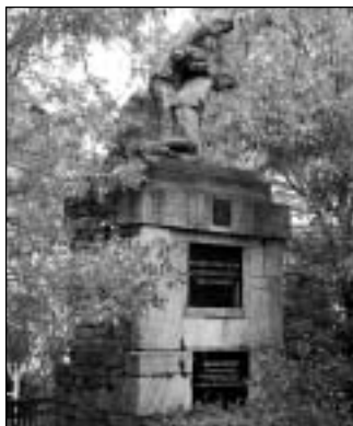
Sovinec - památník obětí za osvození a očistu našeho pohraničí

Vyhlášení války předcházelo atentát na rakouského následníka trůnu a jeho manželku hraběnku Žofii Chotkovou,