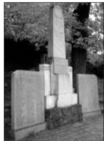
M. Morávka - současná podoba pomníku