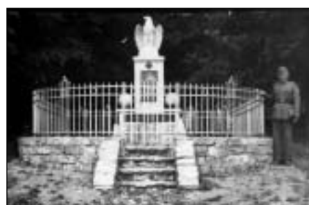
Stránské - původní pomník (dobová pohl.)

v Brestu německý mírový diktátor (brestlitevský mír: Rusko se vzdalo Finska, pobaltských států, Polska a Ukrajiny). Následně se všechna pozornost soustředila na frontu západní, kam Německo přesouvalo svoje divize z východu, a částečně i na frontu italskou, kam zase přesunulo svoje síly Rakousko-Uhersko. Pro československý odboj měl tento mír negativní následky, protože se objevila možnost, že nakonec Rakousko-Uhersko a Německo válku vyhrájí.