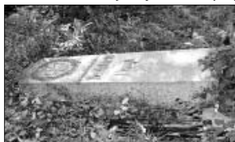
Horní část pomníku ve St. Vsi s křížem a vavřínovými ratolestmi leží na zemi za pomníkem