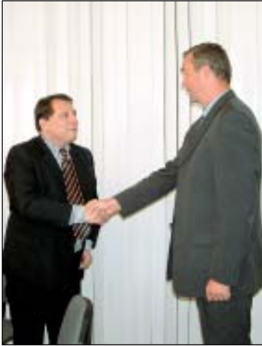
Rýmařovskou radnici navštívil premiér Jiří Paroubek