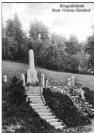
M. Morávka - pův. pomník (dobová pohlednice)