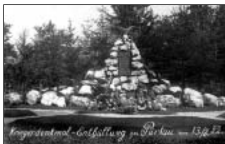
Tvrdkov - pomník z r. 1922 (dobová pohlednice)

Jarní německá ofenzíva na západní frontě však neměla úspěch a Němci po-