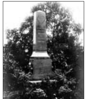
Rešov - žulový památník (dobová pohlednice)