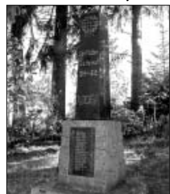
Harrachov - pomník

Náhoda tomu chtěla, že při přípravě tohoto článku jsem jako poslední navštívil Malou Morávku. Udržovaný mramorový pomník uvádí 43 jmen obětí z Malé Morávky a 19 z Karlova, je také upraven, ale způsobem zcela odlišným od těch, o kterých jsme dosud psali. Po obou stranách pomníku jsou umístěny žulové panely se 185 jmény (trojnásobek jmen z první světové války) označenými jako „oběti války a násilí v letech 1930 - 1945/49“. Jak výmluvně