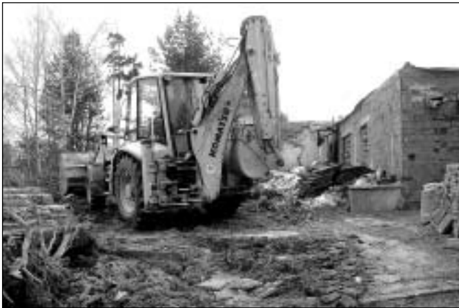
Přípravné práce k výstavbě bytového domu na tř. Hrdinů

řízení a investice by se měla uskutečnit v průběhu léta. Projekt zahrnuje novou uměle chlazenou plochu, která najde multifunkční uplatnění. Mimo zimní sezónu bude sloužit jako tenisové kurty. Plocha by měla mít rozměry 57,5 metrů na délku a 27,5 metrů na šířku,“ upřesnil starosta Petr Klouda. Zimní stadion bude sloužit bez ohledu na případné výkyvy teplot či občasně oblevy nepřetržitě od listopa-