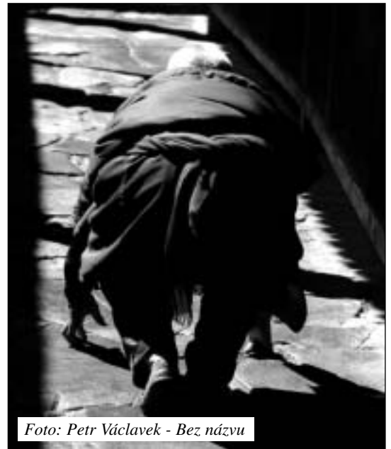
Bez názvu