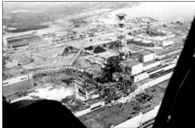
Černobyl pár dní po havárii

Až dosud nebyl prokázán žádný vliv černobylské havárie na výskyt vrozených vad či jiných geneticky podmíněných odchylek, a to ani u rodičů, kteří přežili akutní nemoc z ozáření (stejně tomu bylo i u obětí atomových útoků v Japonsku).