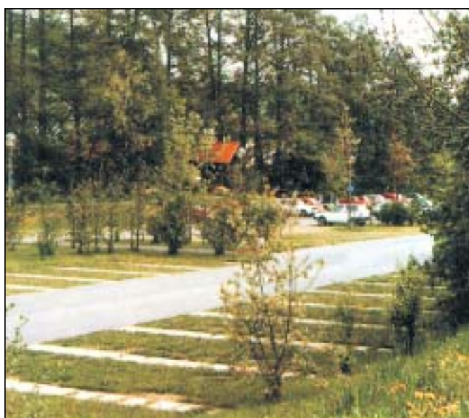
Možná podoba parkoviště