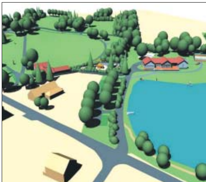
Víceúčelové hřiště, komerční objekt