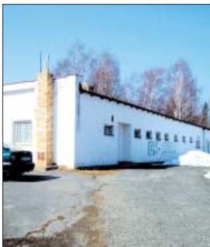
Objekt sauny u Edrovického rybníka