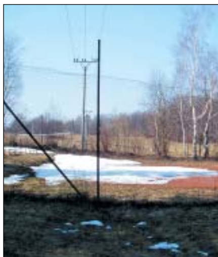
Volejbal. hřiště u rybníka