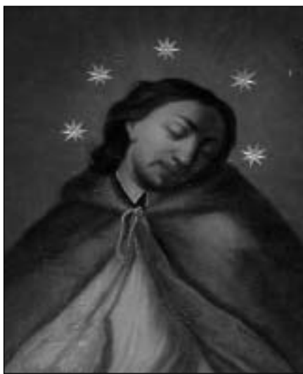
Obraz sv. Jana Nepomuckého v Růžencové kapli kostela sv. Michaela

V roce 1761 jsem do kostela sv. Petra namaloval 3 obrazy, sv. Petra uzdravujícího chromého, sv. Pavla křtícího Dionýsa a sv. Petra trestajícího Ananiáše. Do Brušperka jsem namaloval oltářní obraz svatého rytíře Jiřího. Do Rýmařova votivní obraz proti dobytčím nemocem, sv. Leonarda, sv. Vendelína, sv. Teklu. Do Rýmařova jsem v roce 1766 nama-