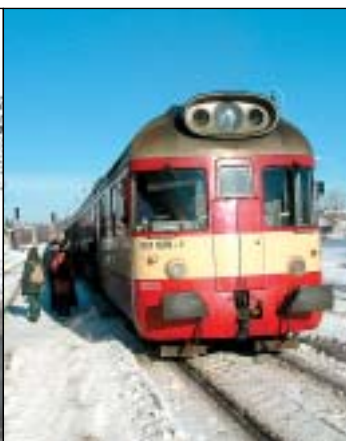
Nové jízdni řady - odjezdy autobusů a vlaků z Rýmařova