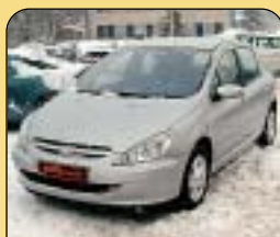
Peugeot 307 2.0 HDi, 1. maj., r. v. 2001, 60 tis. km, klima, 4x airbag, ABS, rádio, palub. poč., el. zrc. a okna, centrální, CD. Cena: 269 000 Kč.