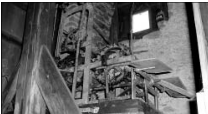
Stroj věžních hodin z roku 1877