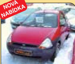
Ford Ka 1.3 Cool, r. v. 1998, 66 tis. km, klima, 2x airbag, ABS, imob., posil. řízení. Cena: 98 000 Kč.