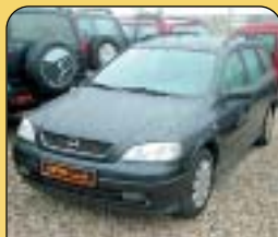
Opel Astra Combi 1.6 16V, 1. maj., r. v. 1998, klima, 4x airbag, ABS, rádio, multif. volant, el. zrcátka a okna, centrální a další. Cena: 149 000 Kč.