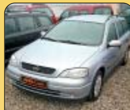
Opel Astra Combi 1.7 dTi, 1. maj., r. v. 1999, klima, 2x airbag, ABS, imob., alarm, el. okna, posil. říz., centrální. Cena: 169 000 Kč.