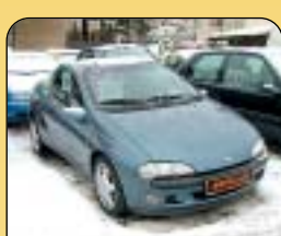
Opel Tigra 1.4i 16V, 1. maj., r. v. 1999, 98 900 km, klima, airbag, rádio, centrální, imob., el. okna, posil. řízení. Cena: 139 000 Kč.