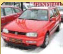
Volkswagen Golf Variant 1.9 TDI, autom., r. v. 1996, 140 tis. km, klima, 2x airbag, alarm, el. okna, posil. říz., centrální, el. zrc. Cena: 129 900 Kč.