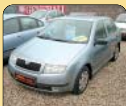
Škoda Fabia 1.4 MPI 50 kW, CZ, 1. maj., r. v. 2001, 51 tis. km, airbag, rádio, posil. říz., centrální, zámeč. řadičí páky. Cena: 178 000 Kč.