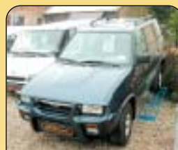
Ford Maverick 2.7 TD GLS 4x4, 7míst., r. v. 1996, 170 tis. km, rádio, centrální, imob., el. okna, el. šibr, posil. říz., tažné, el. zrcátka. Cena: 249 000 Kč.