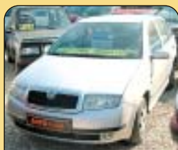
Škoda Fabia Combi 1.4 16V Comfort, r. v. 2002, 78 900 km, klima, 2x airbag, ABS, centrální, el. okna, vyhř. el. zrcátka. Cena: 218 900 Kč.