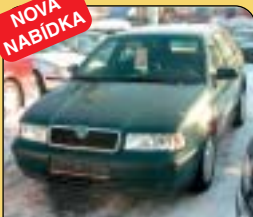
Škoda Octavia Combi 1.6GLXi 74kW, 1. maj., r. v. 1999, 83 400 km, klima, 2x airbag, ABS, cent., el. okna a zrc., pal. poč. a další. Cena: 189 900 Kč.