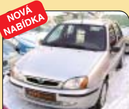
NOVÁ NABÍDKA Mazda 121 1.25i 16V, 1. maj., CZ, servis, r. v. 2001, 38 200 km, airbag, rádio, centrální, posil. řízení. Cena: 139 900 Kč.