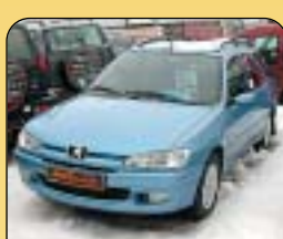
Peugeot 306 Combi 1.6, CZ, r. v. 2000, 155 500 km, airbag řidiče, ABS, rádio, posil. říz., el. zrcátka a přední okna, centrální. Cena: 149 000 Kč.