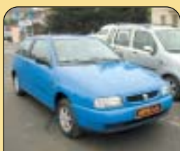
Seat Ibiza 1.0i, r. v. 1998, 146 200 km, rádio, centrální, imob., posil. řízení. Cena: 88 900 Kč.