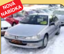
Peugeot 406 1.8, KLIMA, 1. maj., r. v. 1998, 71 tis. km, airbag, senzor stěračů, posil. říz., klima, el. okna, centrální. Cena: 129 900 Kč.