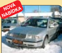
NOVÁ NABÍDKA Škoda Octavia 1.6 GLX 55 kW, CZ, r. v. 1997, 135 tis. km, 2x airbag, ABS, posil. říz., palub. poč., centrální, el. zrcátka. Cena: 138 900 Kč.