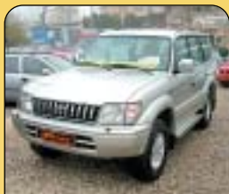
Toyota Landcruiser 3.0 TDi 4x4, r. v. 1998, klima, 2x airbag, EDS, ABS, CD, centrální, el. okna a zrc., palub. poč. posil. řízení. Cena: 449 000 Kč.