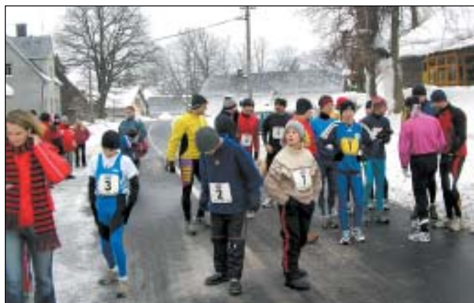
II. ročníku Štěpánské desítky se zúčastnili běžci z Rýmařovska, Vrbenska a Berounska