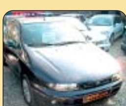
Fiat Bravo 1.6 SX, 1. maj., r. v. 1999, 95 tis. km, klima, airbag, rádio, centrální, imob., el. okna a zrcátka, posil. řízení. Cena: 127 000 Kč.