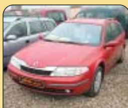
Renault Laguna Grandtour 1.9 dCi, r. v. 2003, 24 800 km, aut. klima, 8x airbag, ESP, ABS, CD, el. okna a zrcátka, centrální a další. Cena: 379 000 Kč.