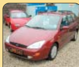
Ford Focus Combi 1.8 Tdi, r. v. 1999, 91 900 km, klima, 2x airbag, ABS, rádio, el. okna, posil. říz., tažné, imob., centrální. Cena: 198 000 Kč.