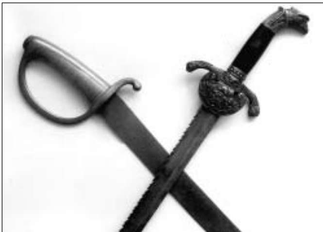
Vlevo šavle francouzská vzor AN XI, vpravo tesák velitele hasičů v Lomnici z r. 1890 (psalo se o něm v článkách o hasičích na Rýmařovsku).

V Olšanech poblíž Prostějova začaly dámy z kabiny dávat kočímu znamení „úzkosti nejvyšší“. Ve voze je ukryt kdosi navíc a začíná křičet bolestí! Povoz ale nezastavil, jen zrychlil a v Olomouci všechny cestující ženy vystoupily. Bleskově se přepřáhlo a bez dalších cestujících se pokračovalo dál až do Týněčka (dnešní část Olomouce), kde vůz zajel mimo šosé (silnici) a zastavil. Beze svědků byla odklopena dřevěná sedáčka a zpod ní vytažen sténající mladý muž ve francouzské uniformě. Měl několik poranění ošetřených, jak se tehdy dělalo, vařícím octem a poté omotaných hadrovými cáry. Jak se později tradovalo, šlo o mladého korneta - srovnávací hodností asi podporučík - z Napoleonovy armády, původem to měl být Alsasan, který se ukryl ve stodole stanice v Pozořicích. Pošťákům slíbil velkou odměnu, z níž část na místě vyplatil ve zlatých mincích, když ho převezou kamsi do Slezska k příbuzným. Tak byl naložen a ukrytý pod sedacími dámmami se snažil nenaříkat bolestí.