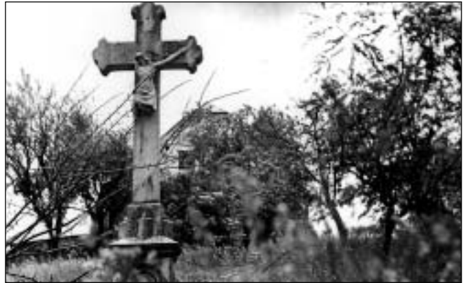
Kříž u domu č. 142 v Lomnici. Snad na místě pohřbeného francouzského korneta po bitvě u Slavkova. Dnes místo vypadá jinak - dům v pozadí je zbourán a u kříže je zastávka autobusů. Stav asi v r. 1960.

Vraťme se raději na starou poštovní přepřahací stanici do Pozořic. S užitím modernějšího názvosloví a s určitým zjednodušením lze říci, že se zde střídaly osádky. Ta z Vídně do Pozořic předávala vůz a vše další osádce z Lomnice, která pak měla před sebou trasu až do Andělské Hory. Určitě se vše odehrávalo ve chvatu a nervozitě uprostřed spousty vojáků - podle záznamů se vlastně předávalo ne na oficiálním dvoře, nýbrž kdesi ve stodole a v maštálích (stájích). Konečně jakž takž hotovo a může se vyrazit. Cesta však byla ucpaná,