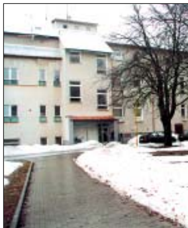
Nemocnice v Rýmařově rozšiřuje ordinaci dobu na chirurgické a gynekologické ambulanci