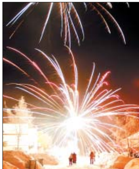
Oslava Nového roku na Jesenické ulici.

Za redakci Rýmařovského horizontu Jiří Konečný