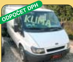
ODPOČET DPH Ford Transit 2.0 TDDi, servis, 1. maj., r. v. 2001, 116 200 km, klima, airbag, rádio, posil. říz., el. vyhř. zrcátka. Cena: 269 000 Kč + DPH.