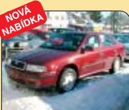
Škoda Octavia 1.6 GLX 55 kW, CZ, r. v. 1998, airbag, rádio, centrální, el. okna, posil. říz., palub. poč., el. zrcátka. Cena: 124 900 Kč.