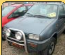
Ford Maverick 2.7 TD 4x4, r. v. 1994, rádio, imob., střešní okno, posil. říz., tažné. Cena: 159 000 Kč.