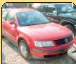
Volkswagen Passat Variant 1.8 5V 92 kW, r. v. 1998, 38 700 km, klima, 4x airbag, ABS, CD, centrální, el. okna a zrcátka. Cena: 198 000 Kč.