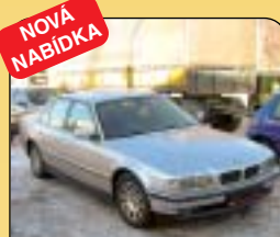
BMW 730D automat, 1. maj., r. v. 2000, TV, telefon, aut. klima, satelit navigace, 6x airbag, xenony, kůže, ESP, ABS, CD měnič a další. Cena: 399 000 Kč.