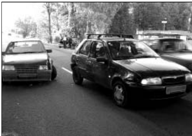
Stačí chvilka nepozornosti a malér je na světě. Pokud to odnesou pomačkané plechy, dá se hovořit ještě o štěstí. Foto dopravní nehody ve Staré Vsi.

Zpracovala redakce na základě podkladů tisk. mluvčí PČR Bruntál