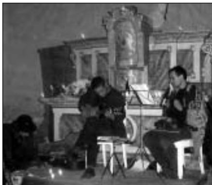
Kapela Vrána před hlavním oltářem

Ve středu 14. září začala skupina mladých lidí z Olomouce spolu s místními obyvateli připravovat kostel sv. Trojice v Albrechticích