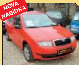
NOVÁ NABÍDKA Škoda Fabia 1.4 MPI 50 kW, CZ, r. v. 2000, 100 200 km, airbag, rádio, imob., posil. řízení. Cena: 168 500 Kč.