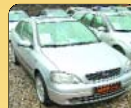
Opel Astra 1.6 Comfort, 3dvěř, r. v. 1998, 89 tis. km, 4x airbag, ABS, CD, posil. říz., el. a okna, centrální a další. Cena: 168 000 Kč.