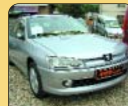
Peugeot 306 Combi 2.0 Hdi, 1. maj., r. v. 2001, 157 300 km, klima, 2x airbag, ABS, centrální, el. okna, a zrcátka. Cena: 219 000 Kč.