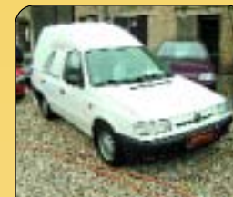
Škoda Felicia Pick-Up VAN PLUS 1.3 LXi, r. v. 1999, imobilizér, tažné zařízení. Cena: 89 000 Kč bez DPH.