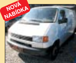
NOVÁ NABÍDKA Volkswagen Transporter 2.5 TDi, 3míst., r. v. 1997, 138 tis. km, rádio, posil. řízení, tažné. Cena: 189 000 Kč.