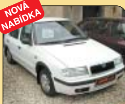
NOVÁ NABÍDKA Škoda Felicia 1.3 LXi 50 kW, CZ, r. v. 1998, 99 400 km, rádio, centrální, imob., přídavné světla, el. zrcátka. Cena: 89 000 Kč.