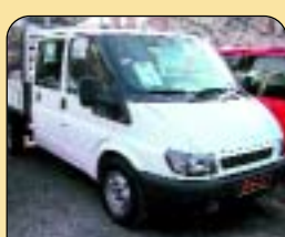
Ford Transit 2.4 TDi valník DOKA, 7 míst, r. v. 2002, 42 tis. km, airbag, imob., posil. říz., tažné. Cena: 359 000 Kč bez DPH.