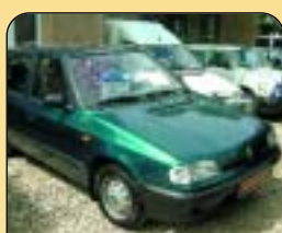
Škoda Felicia Combi 1.6 LX 55 kW, r. v. 1997, 96 600 km, rádio, venkovní teploměr, střední okno, tónovaná skla. Cena: 98 000 Kč.