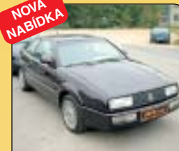
Volkswagen Corrado G 60 1.8, r. v. 1991, rádio, centrální, imob., el. okna a zrcátka, střední el. šibr, posil. řízení. Cena: 89 000 Kč.