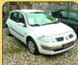
Renault Mégane 1.5 DCI, r. v. 2003, 85 tis. km, klima, 8x airbag, ABS, rádio, el. okna a zrcátka, palub. poč., centrální. Cena: 319 000 Kč.