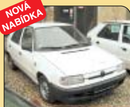
NOVÁ NABÍDKA Škoda Felicia 1.3 LXi 50 kW, CZ, r. v. 1996, 60 000 km, zadní stěrač, zámek řídicí páky, imobilizér. Cena: 48 000 Kč.