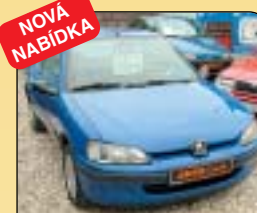
NOVÁ NABÍDKA Peugeot 106 1.5 D, 3dvěř, 1. maj., r. v. 1999, 111 tis. km, posil. říz., el. okna, imobilizér, rádio, centrální zamykání. Cena: 79 900 Kč.