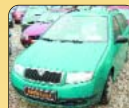
Škoda Fabia Combi 1.4 MPI 50 kW, r. v. 2002, 76 600 km, airbag, rádio, centrální, imob., posil. říz., zámeček řad. páky. Cena: 198 000 Kč.