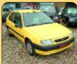
Citroen Saxo 1.0i, 3dvěř, r. v. 1998, 112 tis. km, centrální, imobilizér, el. okna. Cena: 109 000 Kč.