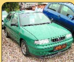
Seat Toledo 1.9 TD SE, r. v. 1995, 164 500 km, rádio, centrální, el. okna, posilovač řízení. Cena: 98 500 Kč.