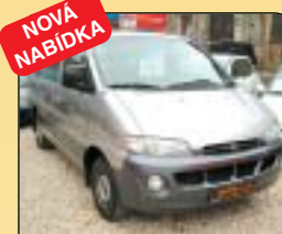
NOVÁ NABÍDKA Hyundai Starex 2.5 TD, 6 míst, r. v. 1999, 170 tis. km, klima, 2x airbag, centrální, el. okna, tažné, el. zrcátka. Cena: 195 000 Kč.