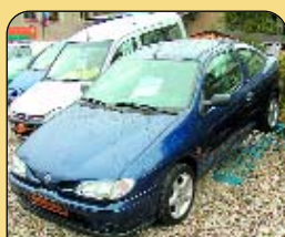
Renault Mégane Coupe 1.6e, r. v. 1996, 106 tis. km, 2x airbag, rádio, imobilizér, posilovač řízení, el. okna, centrální. Cena: 119 000 Kč.