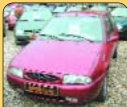
Ford Fiesta 1.4 16V Zetec, r. v. 1997, 102 tis. km, klima, 2x airbag, rádio, imob., posil. říz., el. okna, centrální. Cena: 109 000 Kč.