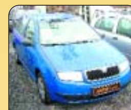
Š - Fabia Combi 1.9 SDi 47 kW, r. v. 2001, 122 tis. km, imobilizér, posil. říz., tažné, airbag, rádio. Cena: 169 000 Kč.