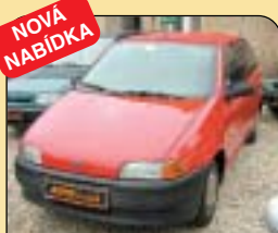
NOVÁ NABÍDKA Fiat Punto 55 S 1.1, 1. maj., r. v. 1997, 88 500 km, centrální, imobilizér, el. okna. Cena: 69 900 Kč.