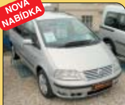
VW Sharan 1.9 TDi 85 kW, r. v. 2001, 92 400 km, aut. klima, 4x airbag, ESP, ABS, rádio, tažné, el. zrcátka a okna, centrální. Cena: 419 000 Kč.