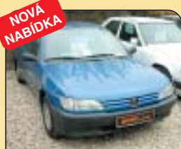
NOVÁ NABÍDKA Peugeot 306 1.9 SLD 51 kW, r. v. 1994, 160 800 km, rádio, centrální, posil. řízení. Cena: 89 500 Kč.