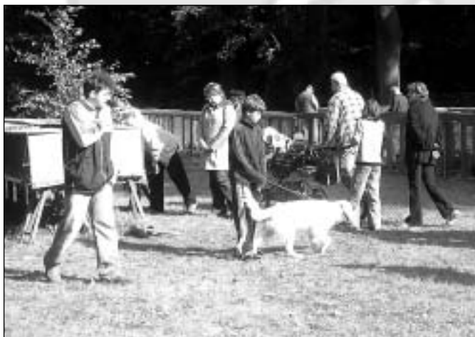
Celkový pohled na výstavu

Poděkování patří všem dvaceti dvěma sponzorům, kteří přispěli ke zdárnému průběhu akce. Daniel Mach