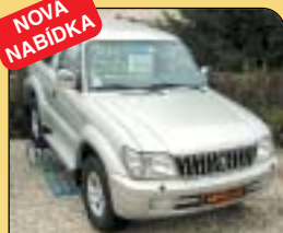
NOVÁ NABÍDKA Toyota Landcruiser 3.0 TD, 4x4, 3dvěř, r. v. 2000, 164 tis. km, klima, 2x airbag, tažné, el. výbava, centrální, CD měnič ad. Cena: 439 000 Kč.