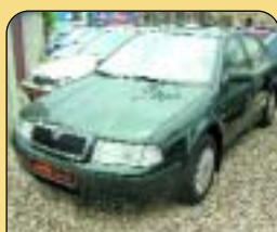
Škoda Octavia 1.6i 75 kW, 1. maj. CZ, r. v. 2003, 95 tis. km, 2x airbag, ABS, rádio, imob., posil. řízení. Cena: 279 000 Kč.