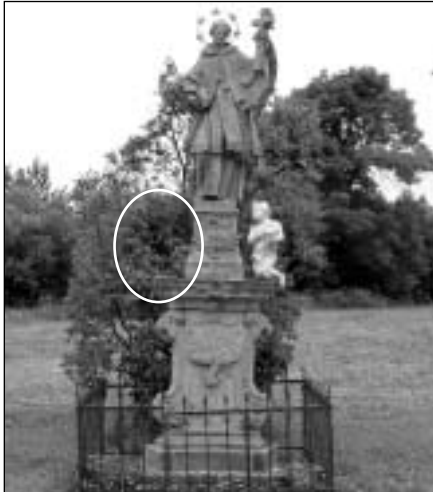
Gatsemanská zahrada ve Velké Štáhli, na označeném místě chybí apoštol.

V poslední době se podle poznatků policie začaly na Rýmařovsku rozmáhat krádeže uměleckých předmětů a soch. K první krádeži došlo v době od 16. do 17. června ve Velké Štáhli, kde se neznámý pachatel vloupal do kostela Nejsvětější Trojice a odcizil několik soch.