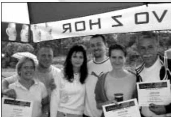
Vítězové tenisového turnaje