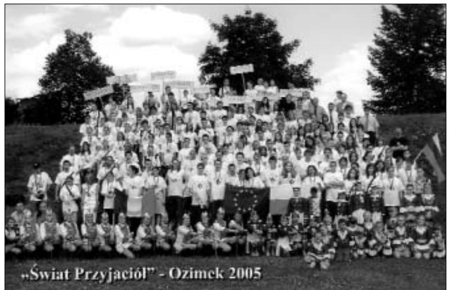
„Świat Przyjaciół“ - Ozimek 2005