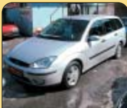
Ford Focus Combi 1.8 TDCi, 1. maj., r. v. 2002, 149 tis. km, klima, 4x airbag, ABS, alarm, el. okna, posil. řiz., centrální. Cena: 299 000 Kč.