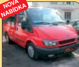
Ford Transit 2.0 TDI, minibus, r. v. 2001, 149 tis. km, klima, airbag, ASR, el. vybava, tažné, centrální, nezávislé topení a další. Cena: 325 000 Kč.