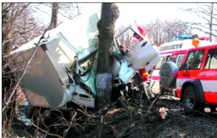
Za Starou Vsí směrem na Šumperk došlo 4. dubna odpoledne k vážné dopravní nehodě vozidla Iveco