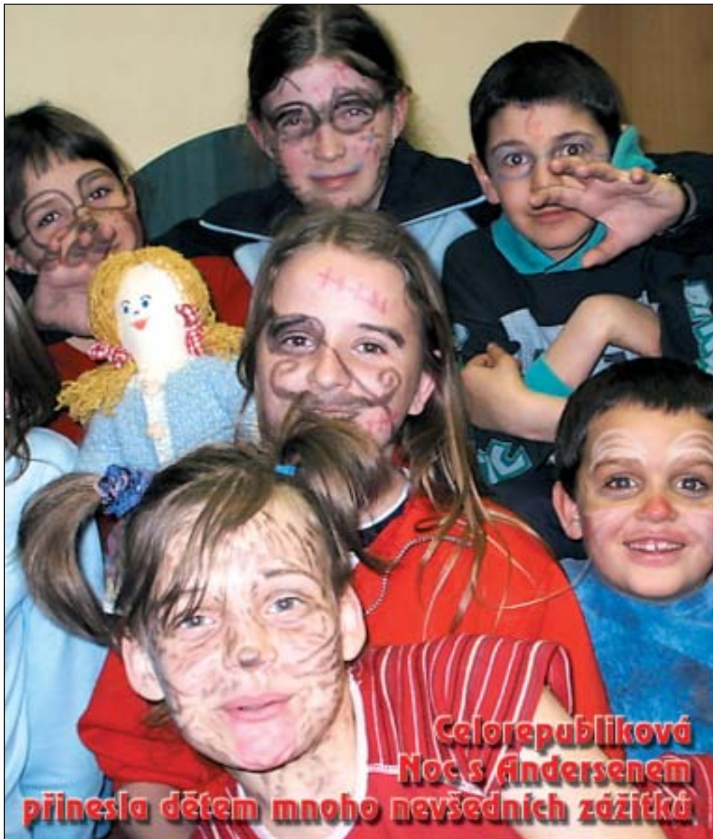
Celorepubliková Noc s Andersenem přinesla dětem mnoho nevšedních zážitků