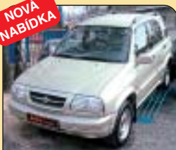
Suzuki Grand Vitara 2.5 V6 Elegance, r. v. 2001, 52 tis. km, 2x airbag, ABS, centrální, klima, tažné, construct. Cena: 339.000 Kč.