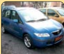
Mazda Premacy 2.0 DIDT, r. v. 2000, 106 800 km, klima, 4x airbag, ABS, centrální, imob., el. vybava, posilovač řízení. Cena: 259 000 Kč.