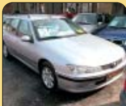
Peugeot 406 Combi 2.2 Hdi, 98 kW, r. v. 2001, 115 tis. km, aut. klima, airbagy, ASR, ABS, pal. poč., senz. stěr., el. vybava. Cena: 269 000 Kč.