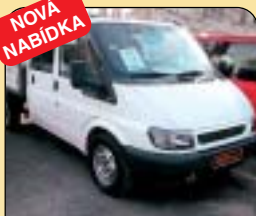
Ford Transit 2.4 TDi valník DOKA, 7 míst, r. v. 2002, 42 tis. km, airbag, imob., posil. řiz., tažné. Cena: 395 000 Kč bez DPH.