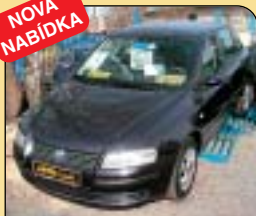
Fiat Stilo 1.2 I.E. 16V, klima, 1. maj., r. v. 2002, 60 745 km, klima, 6x airbag, ASR, ABS, rádio, počítač, el. vybava, centrální. Cena: 269 000 Kč.