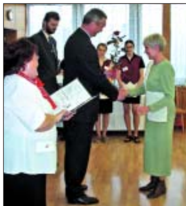
Učitelé oslavili společně se zástupci města svůj svátek. Ti jim poděkovali a ocenili jejich náročnou práci