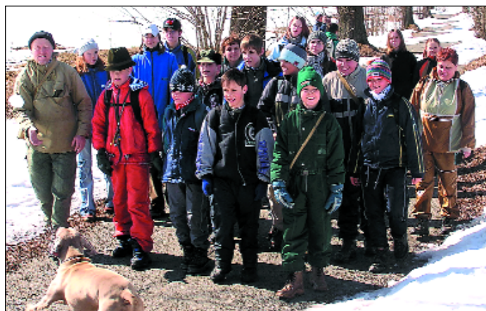
Skauti přivítali tradičně jaro vycházkou, tentokrát do Stříbrných Hor