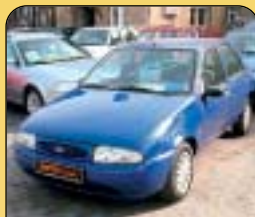
Ford Fiesta 1.8 D - 1. majitel, r. v. 1998, 60 tis. km, klima, 2x airbag, centrální, imob, el. okna, posil. řízení. Cena: 129 500 Kč.