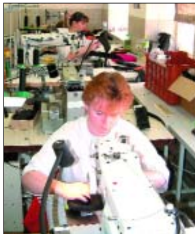
Firma Gala Prostějov otevřela pobočku v Janovicích a nabídla práci zejména matkám s dětmi