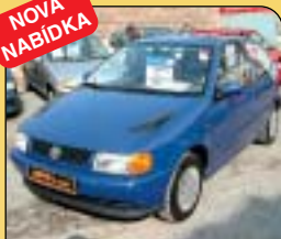
Volkswagen Polo 1.0 i - 3-dveř., r. v. 1995, 84 400 km, 2x airbag, rádio, imobilizér, posilovač řízení. Cena: 109 000 Kč.