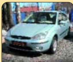
Ford Focus 1.8 TDDi 66 kW, r. v. 2003, 39 400 km, klima, 4x airbag, ABS, el. vybava, centrální, CD, rádio. Cena: 299 500 Kč.