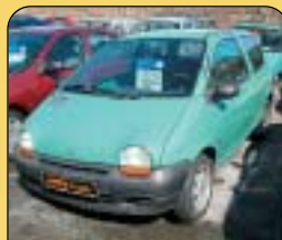
Renault Twingo 1.3, 3dvéřový, r. v. 1996, 73 tis. km, rádio, imobilizér, zadní stěrač. Cena: 69 000 Kč.