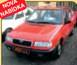
Škoda Felicia Combi LX 1.9 D, 47 kW, r. v. 1997, 139 tis. km, rádio, centrální, imobilizér, posilovač řízení. Cena: 89 900 Kč.