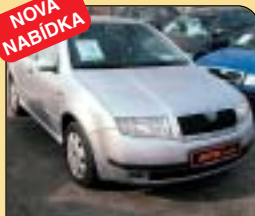
Škoda Fabia 1.4 MPI Comfort, klima, r. v. 2000, 94 600 km, 2x airbag, centrální, imob, el. vybava, posil. řiz., počítač. Cena: 169 000 Kč.