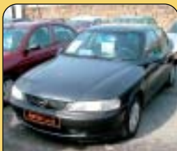
Opel Vectra 2.0 Di, r. v. 1997, 184 tis. km, 2x airbag, ABS, rádio, imobilizér, posil. řiz., el. zrcátka a okna, centrální. Cena: 139 000 Kč.