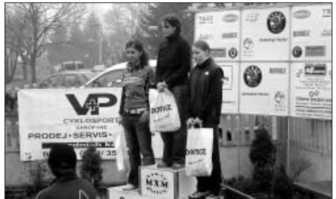
Petra na prvním místě