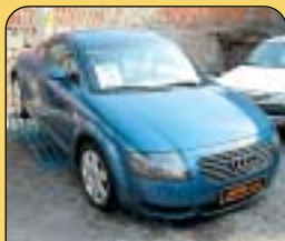
Audi TT Coupé 1.8, 1. majitel, 7 740 km, aut. klima, 4x airbag, ESP, ASR, ABS, CD, rádio, centrální, el. vybava a další. Cena: 695 000 Kč.