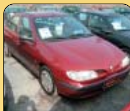
Renault Mégane Classic 1.6, r. v. 1997, airbag, rádio, imob., posil. řízení, el. okna, centrální. Cena: 109 900 Kč.