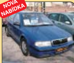
Škoda Octavia 1.6 LX, r. v. 1998, 189 tis. km, airbag, rádio, imob., posil. řiz., zámek řadič páky. Cena: 158 000 Kč.