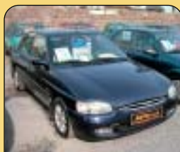
Ford Escort 1.8 16V klima, 1. maj., r. v. 1998, 78 tis. km, 2x airbag, ABS, CD, el. okna, posil. řiz., centrální. Cena: 138 000 Kč.