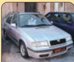
Škoda Felicia combi LX 1.9 D, r. v. 1998, 80 tis. km, airbag, CD, rádio, centrální, imob., posil. řiz., el. zrcátka. Cena: 139 000 Kč.