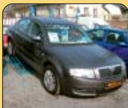
Škoda Superb 1.9 TDI, 96 kW, 1. maj., r. v. 2002, 129 tis. km, klima, 4x airbag, ASR, ABS, el. vybava, centrální a další. Cena: 437 000 Kč.