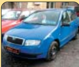
Škoda Fabia 1.9 SDi Classic, 1. majitel, serv. kniha, r. v. 2000, 88 tis. km, airbag, centrální, rádio, posil. řízení. Cena: 188 900 Kč.