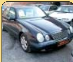
Mercedes-Benz E 270 Cdi, automat, 1. maj., r. v. 2001, 178 tis. km, klima, 6x airbag, ESP, ASR, ABS, CD, plná vybava, tempomat. Cena: 589 000 Kč.