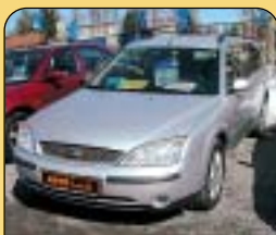
Ford Mondeo Combi 2.0 Ghia, 1. maj., r. v. 2001, 139 tis. km, aut. klima, 8x airbag, ABS, CD, pal. poč., vybava v el., centrální. Cena: 268 000 Kč.