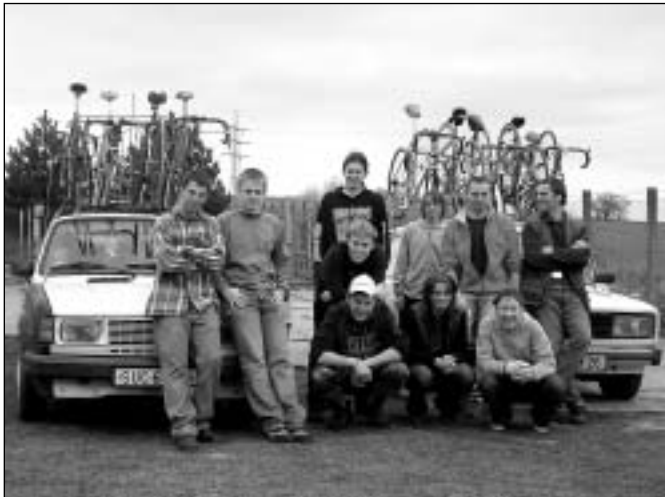
Odjezd ze soustředění v Otrokovicích.