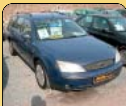
Ford Mondeo Combi 2.0 TDDi, klima, r. v. 2001, 109 tis. km, 8x airbag, ABS, CD, rádio, el. vybava, palub. poč., centrální a další. Cena: 299 000 Kč.