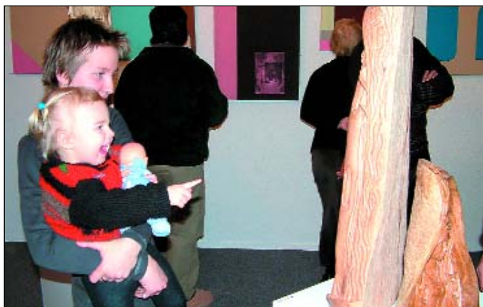
Galerie Octopus zahájila první výstavu letošního roku za účasti čtrnácti autorů