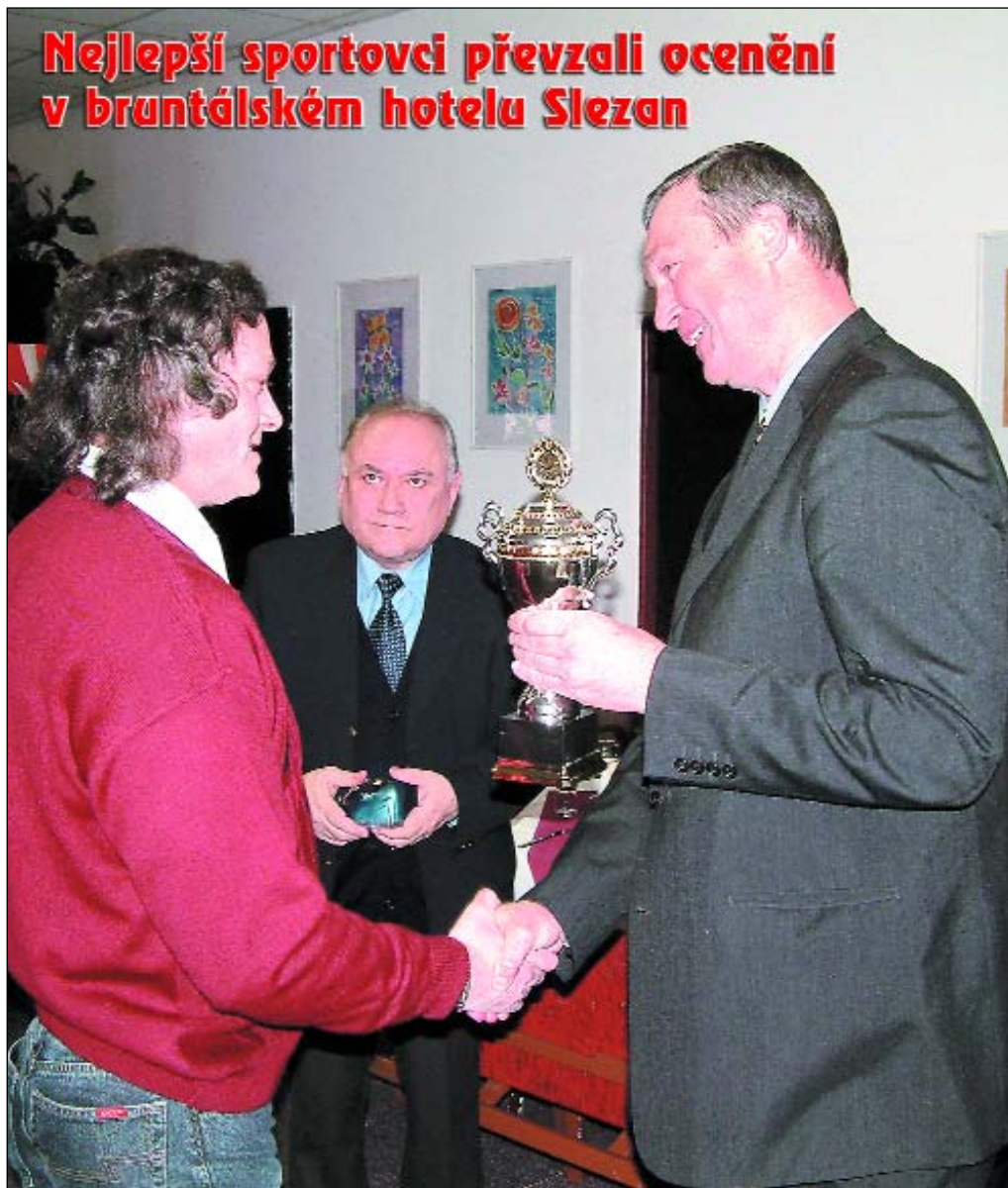
Nejlepší sportovci převzali ocenění v bruntálském hotelu Slezan