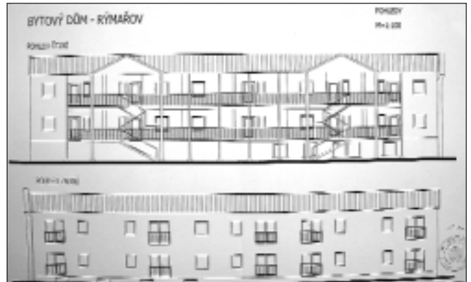
Nákres bytového domu na tř. Hrdinů č. 56

hoto kontextu je výstavba domu s pečovatelskou službou na ulici Hornoměstské, která by měla být realizována na části odkoupeného pozemku od Zahradkářského svazu v Rýmařově. V současné době je zpracován projekt a snažíme se získat dotaci na výstavbu pětadvaceti bytových jednotek. Půjde o byty o velikosti asi 37 m 2 , kde bude zázemí splňující podmínky chráněného bytu, to znamená, že budou určeny pro seniory s bezbariérovými prvky a s možností využití blízkosti rýmařovské nemocnice.