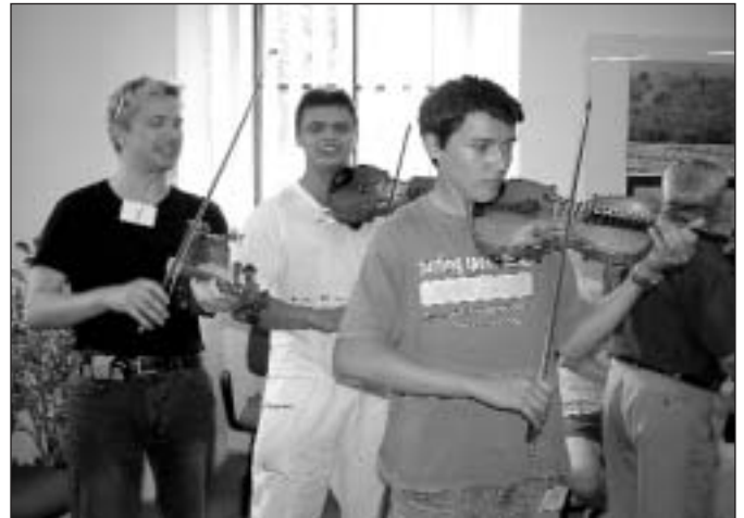
Setkání účastníků Tour du Jumelage z partnerského města Krompachy