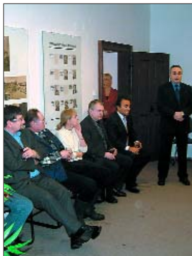
Na setkání podnikatelů se zástupci radnice zazněla kritická slova