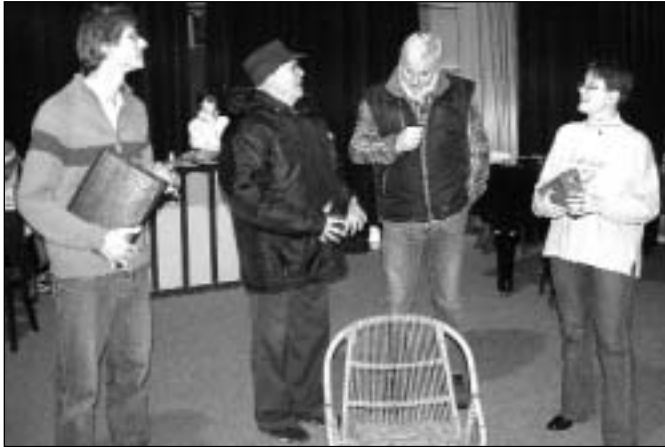
Zkouška hry Podivná paní Savageová