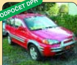
Honda HR - V 1.6 4x4, klima, 1. majitel, r. v. 2001, 2x airbag, ABS, CD + rádio, el. okna, tažné, centrál. Cena: 375 000 Kč.