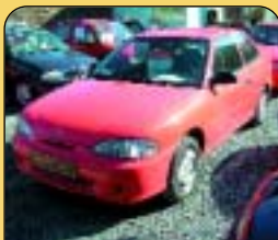
Hyundai Accent 1.3, r. v. 1997, 110 tis. km, 2x airbag, ABS, posil. řízení. Cena: 89 900 Kč.