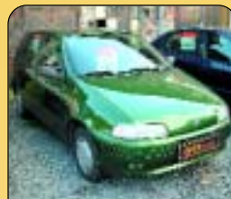
Fiat Punto 1.2 SX, r. v. 1996, 101 tis. km, airbag, centrál, el. př. okna. Cena: 118 000 Kč.