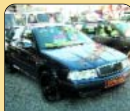
Škoda Octavia Combi 1.9 TDi PD 4x4 Eleg, r. v. 2003, 7 600 km, klima, ABS, el. okna, palub. poč., centrál. Cena: 499 000 Kč.