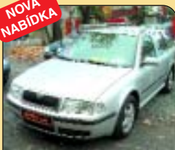
Š - Octavia combi 1.6i 74 kW Ambiente, r. v. 2000, 44 tis. km, airbag, ABS, el. vřbava, posil. říz., palub. poč. Cena: 268 900 Kč.