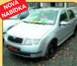
Š - Fabia 1.4 16V Comfort, 1. majitel, r. v. 2000, 98 tis. km, airbagy, ABS, rádio, centrál, posil. řízení a další. Cena: 185 900 Kč.