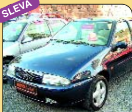
Ford Fiesta 1.3 Zetec, r. v. 1996, airbag, centrál, imob., el. okna. Cena: 99 000 Kč.