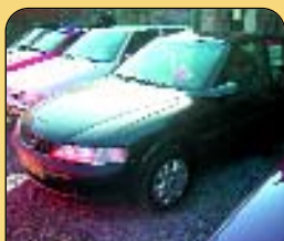
Opel Vectra 2.0 Di, r. v. 1997, 2x airbag, ABS, rádio, el. okna a zrcátka, posil. řízení, centrál. Cena: 139 000 Kč.