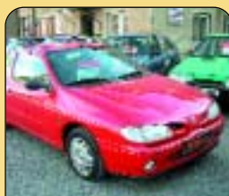
Renault Mégane 1.6 kupé, r. v. 1997, 2x airbag, imob., el. okna, posil. říz., centrál. Cena: 138 000 Kč.