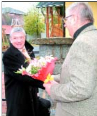
V rámci volební kampaně Jana Zieglera navštívil Rýmařov europoslanec Vladimír Železný