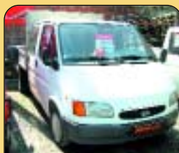
Ford Transit 2.5 Di, valník 6 míst, r. v. 1999, 2 x airbag, rádio, imob., posil. říz. Cena: 289 000 Kč bez DPH.