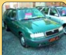
Škoda Felicia Combi 1.3 LXi 50 kW, r. v. 1999, 109 tis. km, rádio, centrál, posil. řízení. Cena: 139 900 Kč.