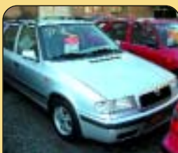
Škoda Felicia combi LX 1.9 D, r. v. 1998, airbag, CD, rádio, centrál, posil. říz., el. zrcátka. Cena: 149 000 Kč.