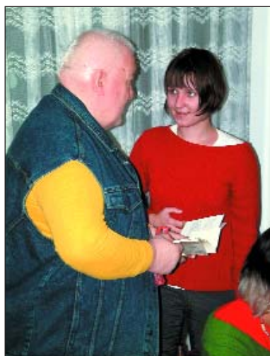
Podvečer autorského čtení ukončila Soutěž Marie Kodovské