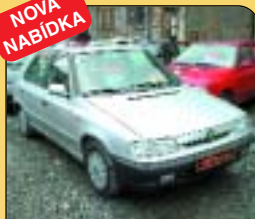
Š - Felicia 1.3 GLXi 50 kW LPG, r. v. 1997, 112 tis. km, centrál, imob., tažné. Cena: 98 000 Kč.