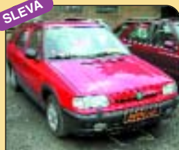
Škoda Felicia Combi 1.6 GLX 55 kW, r. v. 1996, rádio, centrál, palub. počítač, tažné. Cena: 116 000 Kč.