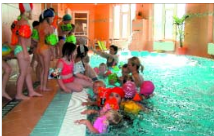
Na Jesenické ulici bylo otevřeno první rýmařovské aquacentrum