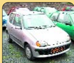
Fiat Seicento 1.1 Klima 3dvéřový, r. v. 2000, klima, 2x airbag, centrál, imob., el. okna, posil. řízení. Cena: 119 000 Kč.