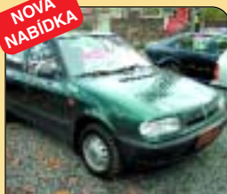
Škoda Felicia combi 1.3 LXi 50 kW-1. maj., r. v. 1997, 45 tis. km, rádio, imob., tažné. Cena: 124 800 Kč.