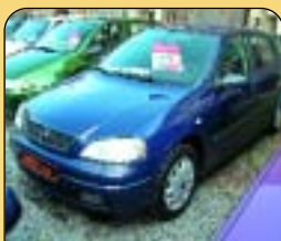
Opel Astra 1.6 16V, r. v. 1998, klima, 2x airbag, ABS, rádio, el. př. okna a zrcátka, posil. říz., centrál. Cena: 169 900 Kč.