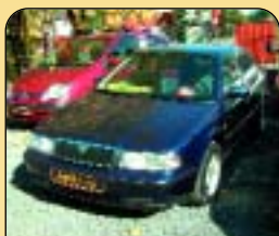
Škoda Octavia SLX 1.9 Tdi, klima, r. v. 2000, 121 tis. km, airbagy, ABS a další. Cena: 289 000 Kč.