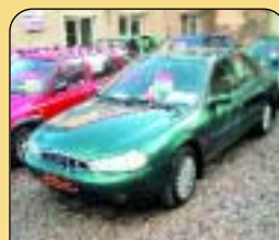
Ford Mondeo 2.0 16V Ghia, automat, klima, r. v. 1997, 2x airbag, ASR, ABS, el. okna a zrcátka, centrál. Cena: 168 000 Kč.