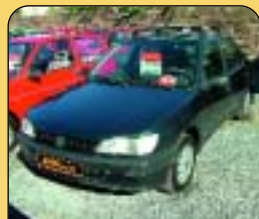
Peugeot 306 2.0 XRD, r. v. 1993, rádio, posil. řízení, tažné. Cena: 86 000 Kč.