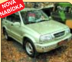
Suzuki Grand Vitara 2.5 V6 Elegance 4x4, r. v. 2001, 52 tis. km, airbagy, ABS, imob., el. vřbava, tažné, centrál. Cena: 399 500 Kč.