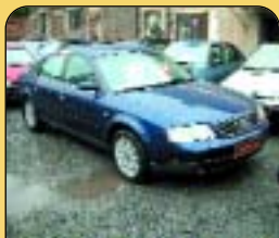
Audi A6 2.5 TDi Quattro, klima, r. v. 2000, 8x airbag, EDS, ABS, rádio, el. okna, posil. říz., palub. poč., centrál a další. Cena: 548 000 Kč.