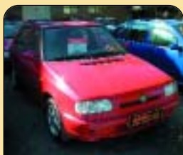
Škoda Felicia 1.3 LXi 50 kW, r. v. 1996, 116 tis. km, rádio, imobilizér a další. Cena: 89 900 Kč.