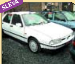
Fiat Croma 2.0 Tdi, r. v. 1996, aut. klima, airbag, centrál, imob., el. okna, posil. říz., el. zrcátka. Cena: 129 000 Kč.