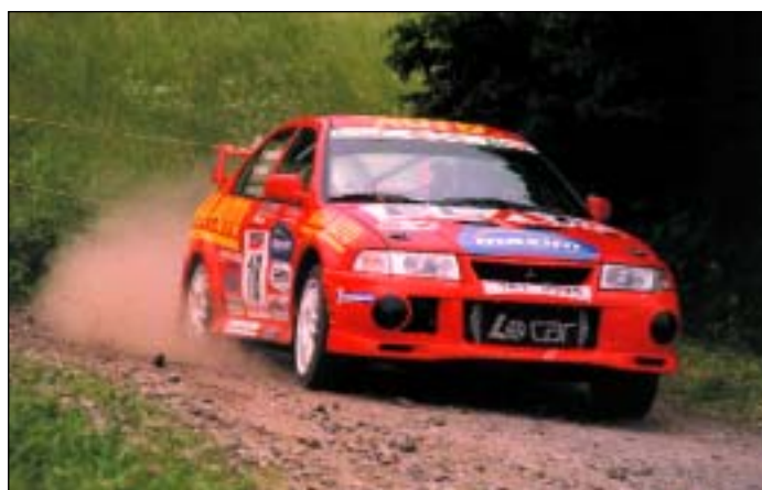
Petr Pouлік se stal vicemistrem republiky ve sprint rallye