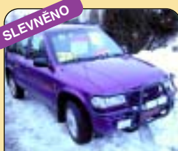
SLEVNĚNO Kia Sportage 2.0 DOHC, 4x4, r. v. 1997, 223 tis. km, airbag, rádio, el. okna, posil. říz., tažné, centrál. Cena: 189 500 Kč.