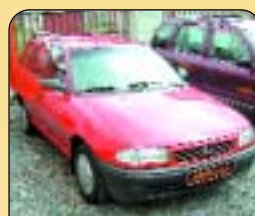
Opel Astra Caravan 1.7 TD, r. v. 1996, 97 tis. km, airbag, posil. řízení, tažné. Cena: 129 000 Kč.