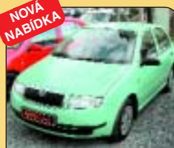
NOVÁ NABÍDKA Škoda Fabia 1.4 Mpi - Clasik, 1. majitel, r. v. 2000, 41 tis. km, airbag, autorádio, posil. řízení. Cena: 179 000 Kč.