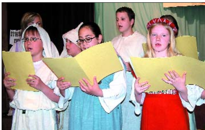
Strojem času do středověku a zpátky