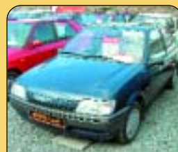
Ford Fiesta 1.3 - úprava pro invalidy, r. v. 1996, 95 tis. km, rádio, alarm, tažné, centrál. Cena: 79 900 Kč.