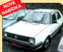
NOVÁ NABÍDKA Volkswagen Golf 19 1.6 TD, 1. r. v. 1991, majitel, rádio, centrál, šibr. Cena: 75 000 Kč.