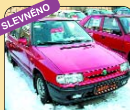
SLEVNĚNO Škoda Felicia 1.6 GLX, r. v. 1997, 129 tis. km, ABS, rádio, centrál a další. Cena: 95 000 Kč.