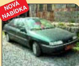
NOVÁ NABÍDKA Citroen Xantia 1.8 i LPG, r. v. 1995, 1. majitel, rádio, centrál, el. okna. Cena: 119 000 Kč.