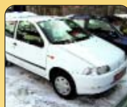
Fiat Punto 1.2, r. v. 1995, 85 tis. km, tónovaná skla, zadní stěrač. Cena: 110 000 Kč.