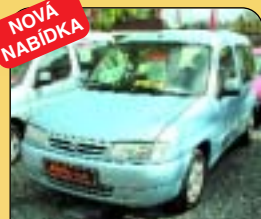
NOVÁ NABÍDKA Citroen Berlingo 1.9 D, klima, 1. majitel, r. v. 2000, airbag, rádio, el. okna, zrcátka, posil. říz., tažné, centrál. Cena: 275 000 Kč.