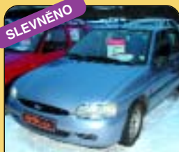
SLEVNĚNO Ford Escort 1.6-16v-klima-aut., r. v. 1997, 35 t. km, 2 x air., ABS, rádio, centrál, el. okna a zrcátka, pos. říz. Cena: 129 000 Kč.