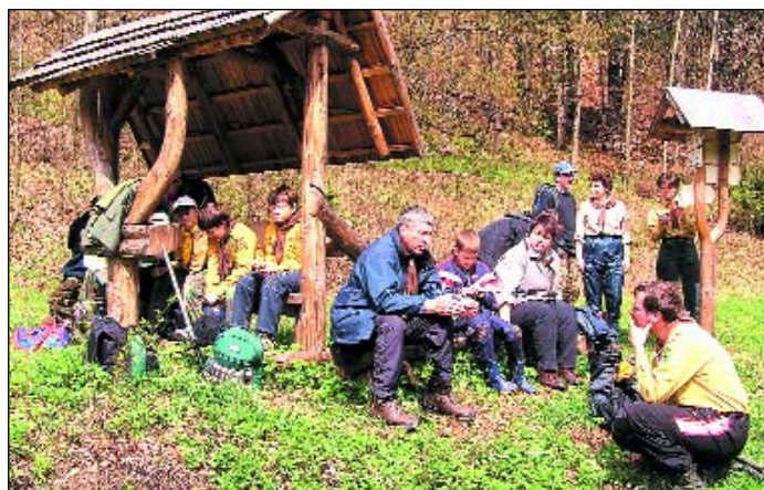
Vydejte se s námi po nově otevřené Vychodilově stezce