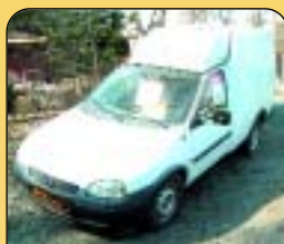
Opel Combo 1.4 i, r. v. 1996, rádio. Cena 69 000 Kč bez DPH.