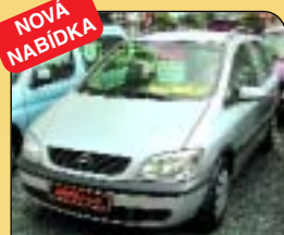
NOVÁ NABÍDKA Opel Zafira Combi 1.6, digi klima, 7 míst, r. v. 2001, 4 x airbag, ABS, rádio, posil. říz., centrál. Cena: 349 000 Kč.