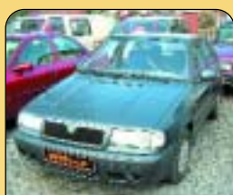
Škoda Felicia 1.3 Lxi, r. v. 1998, 139 tis. km, rádio, centrál, el. okna. Cena: 109 900 Kč.