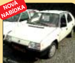
NOVÁ NABÍDKA Škoda Favorit 136 L, r. v. 1989, 86 tis. km. Cena: 18 500 Kč.