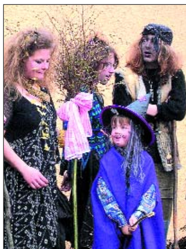
O filipjakubské noci nastala invaze čarodějnic