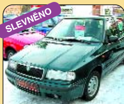
SLEVNĚNO Škoda Felicia 1.3 LXi Combi, r. v. 1999, 109 tis. km, rádio, centrál. Cena: 139 900 Kč.