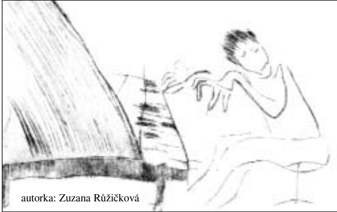
autorka: Zuzana Růžičková