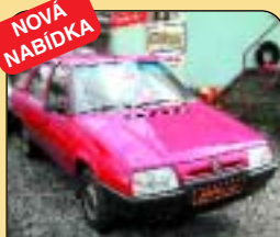
NOVÁ NABÍDKA Škoda Forman 135 LX, r. v. 1994, 97 tis. km, tažné. Cena: 59 900 Kč.