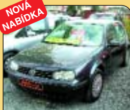
NOVÁ NABÍDKA VW Golf 1.9 TDi klima, r. v. 2000, 4 x airbag, ABS, centrál posil. řízení. Cena: 298 000 Kč.