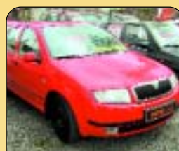
Škoda Fabia 1.4 MPI Comfort, klima, r. v. 2000, 2x airbag, ABS, rádio, posil. řízení, centrál. Cena: 189 900 Kč.