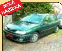
NOVÁ NABÍDKA Renault Laguna 1.8 RN, r. v. 1995, 2 x airbag, ABS, rádio, el. okna, posil. říz., centrál. Cena: 119 000 Kč.