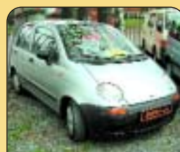
Daewoo Matiz 0.8, r. v. 1999, 35 tis. km, 1. majitel, perfektní stav, nízká spotřeba, servisní kniha. Cena: 129 900 Kč.