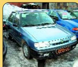
Š - Felicie GLXi, r. v. 1997, 70 tis. km, rádio, centrál, metalíza, mlhovky, 1. majitel, super stav. Cena: 119 000 Kč.