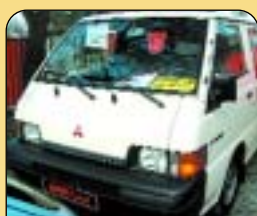
Mitsubishi L 300 2.0, r. v. 1997, 6 míst, 129 tis. km, odpočet DPH 22%, rádio, centrál. Cena: 149 000 Kč.