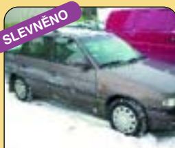
SLEVNĚNO Opel Astra Caravan 1.4i, klima, r. v. 1997, 148 tis. km, 2 x airbag, ABS, imob., alarm, el. okna, stř. okno, nosič, centrál. Cena: 145 000 Kč.