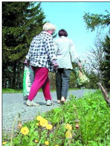
Do Evropy po čisté cestě