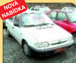
NOVÁ NABÍDKA Škoda Felicia LX 1.9 D, r. v. 1997, CD, šibr, posil. řízení. Cena: 109 000 Kč.