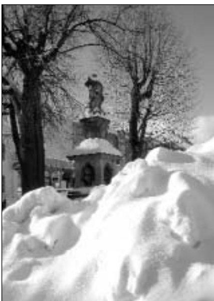
Socha Panny Marie z r. 1683