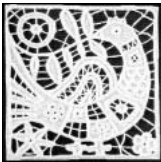
Čtyři lekce kurzu vyšívání