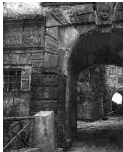
Sovinec - třetí hradní brána