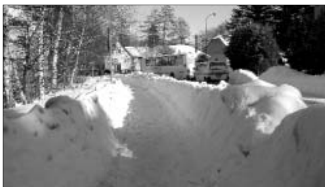
Křižovatka ulic Okružní a třídy Hrdinů