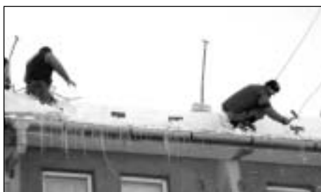
Odstraňování nebezpečného ledu ze střech