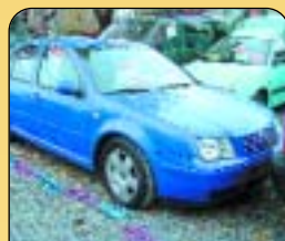
VW Bora 1.9 TDI, r. v. 1999, ABS, digi klima, AL kola, 4x airbag, rádio + CD, 83 tis. km. Cena: 349 000 Kč.