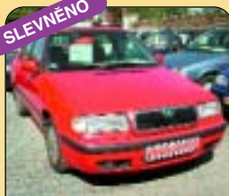
Š - Felicie kombi GLX 1,9 D, r. v. 1999, serv. kniha, mlhovky, zam. zpátečky, tažné zař., hagusy. Cena: 169 000 Kč.