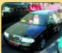
Octavia combi, 1.9 TDI PD 4x4, r. v. 2002, 6stup. přev., ABS, ASR, klima., tempomat, rádio+CD, 4x airbag. Cena: 545 000 Kč