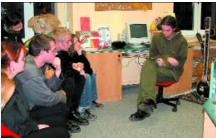
Mladí autoři se sešli na literárním podvečeru, který organizoval Studentský klub SVČ.