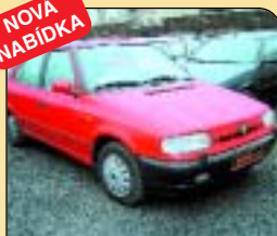
Š Felicia 1.6 GLX, r. v. 1997, 108 tis. km, centrál, alarm, konstrukt, mlhovky, servis. kniha. Cena: 138 000 Kč.