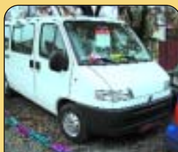
Fiat Ducato 2.8 TDI, r. v. 2001, 9 místný bus, ABS, tažné, rádio + CD, 43 tis. km. Cena: 359 000 Kč.