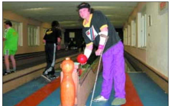
Tělesně postižení kuželkáři přivezli další cenné body ze závodu v Opavě.