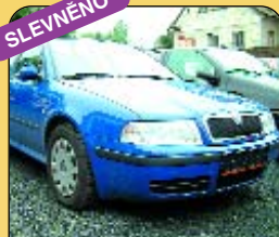
Š - Octavia 1.9 TDI, r. v. 2001, airbag, centrál, ABS, servo. Cena: 346 000 Kč