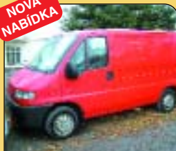
Citroen Jumper 1.9 D, r. v. 1999, 96 tis. km, rmg, 4x el. zrcátka, 1. maj., koupeno v ČR. Odpočet DPH 22 %. Cena: 295 000 Kč (vč. DPH)