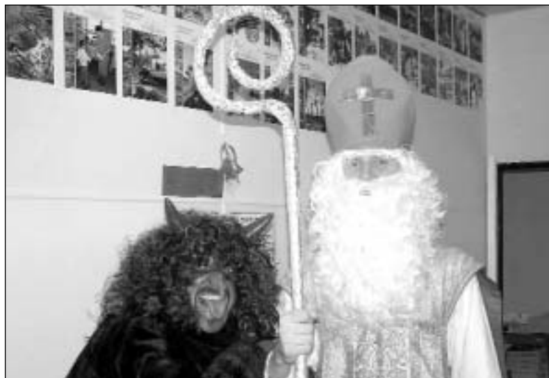
Svatý Mikuláš s čertem zavítal loni také do redakce Rýmařovského horizontu