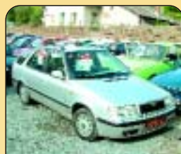
Š - Felicie kombi 1.6 GLX, r. v. 2000, 96 tis. km, mlhovky, rádio, 2x airbag, centrál, hagusy, 1. majitel. Cena: 175 000 Kč