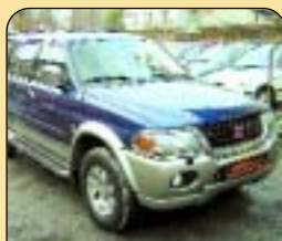
Mitsubishi Pajero Sport 3.0, 6V - 24 GLS, r. v. 2000, odpočet 22 % DPH, 1. maj., koupeno v ČR, nehav., 148 000 km. Cena: 598 000 Kč.