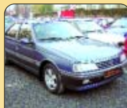
Peugeot 405 GRD, r. v. 1990, ABS, AL kola, rádio + mg., centrál, mlhovky. Cena: 69 000 Kč.