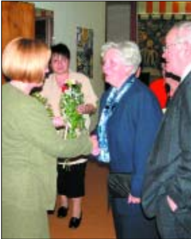
Město Rýmařov nezapomnělo ani v letošním roce na oslavence 70. a 75. narozenin.