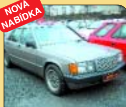
Mercedes Benz 190 2,5 D, r. v. 1987, centrál, alarm, tažné, AL kola, el. výbava, rmg. Cena: 79 000 Kč.