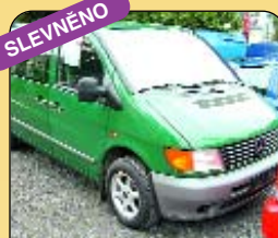
Mercedes Benz 112 CDI, 2,2 l, 90 kw, lux, r. v. 1999, ABS, ASR, rádio + mg., klima, centrál, alarm. 1. majitel, koup. v ČR, 8 míst. Cena: 499 000 Kč