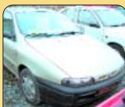
Fiat Brava 1.4, 12 V, r. v. 1998, centrál na D.O., medvěď blok, el. okna, rádio, 149 tis. km. Cena: 129 000 Kč.