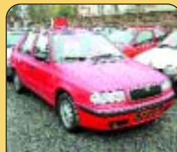
Š - Felicia LX 1.3, r. v. 1999, 32 tis. km, mlhovky, koupeno v ČR, 1. majitel, servisní kniha. Cena: 149 000 Kč.