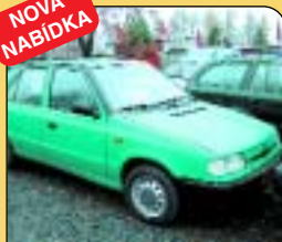
Š - Felicia 1.3 LXi, r. v. 1995, 136 tis. km, stř. okno, imobilizér, rmg., konstrukt. Cena: 89 000 Kč