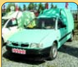
Seat Inka, r. v. 1996, alarm, rádio, posilovač řízení. Cena: 107 000 Kč + DPH.