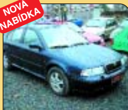
Š - Octavia 1.9 TDI SLX, r. v. 1999, 150 tis. km, klima, AL kola, ABS, 2x airbag, rmg., el. okna a šíbr. Cena: 283 000 Kč.