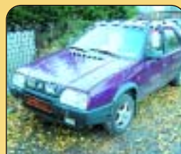
Š - Forman 136, r. v. 1994, tažné, centrál, AL kola, mlhovky, stř. okno. Cena: 49 000 Kč.