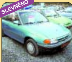
Opel Astra 1.4, r. v. 1995, centrál, rádio + mg., stř. okno, metaliza, 88 tis. km. Cena: 89 900 Kč.