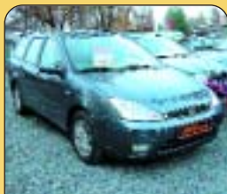
Ford Focus kombi 1.8 TDI GHIA, r. v. 2002, ABS, 4x airbag, digi klima, rádio + CD, AL kola, 69 tis. km. Cena: 369 000 Kč.