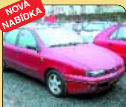
Fiat Brava 1.6 16 V, r. v. 1996, 71 tis km, AL kola, centrál, rmg., mlhovky, el. okna a zrcátka. Cena: 139 000 Kč.