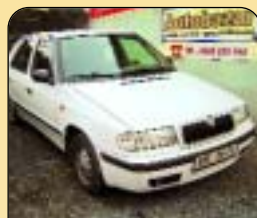
Š - Felicia 1.3 LX, r. v. 1998, 1. majitel, super stav, centrál, konstrukt, mlhovky, 74 tis km. Cena: 139 000 Kč.