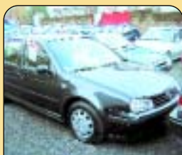
VW Golf IV 1.4 CL, r. v. 1998, ABS, 2x airbag, centrál na D. O., el. okna, 36 tis. km. Cena: 210 000 Kč.