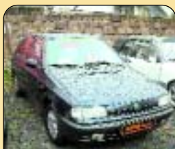
Š - Felicia LX 1.6, r. v. 1996, 150 tis., airbag, centrál, alarm, rádio, servisní kniha. Cena: 116 000 Kč.