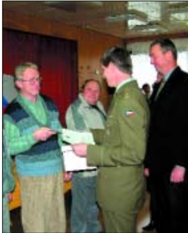
Armáda se slavnostně rozloučila s muži narozenými v roce 1942.