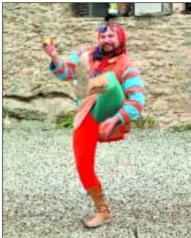
Hofmistrovu závěť na Sovinci shlédlo za nepříznivého počasí dvanáct stovek návštěvníků.