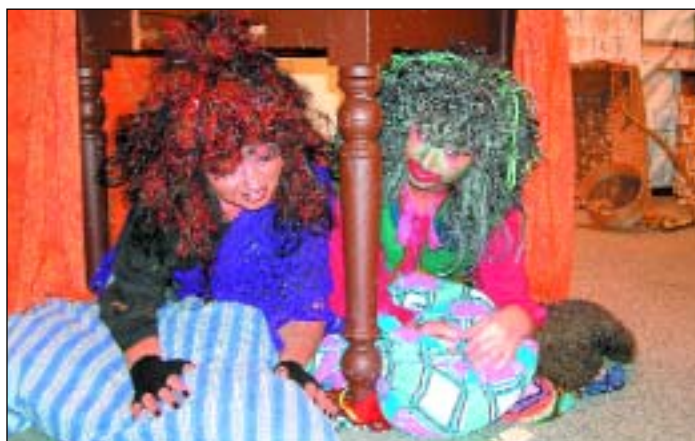
Herci ochotnického divadelního spolku Mahen opět úspěšni v pohádce O líných strašidlech.