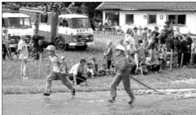
VI. ročník Velké noční soutěže