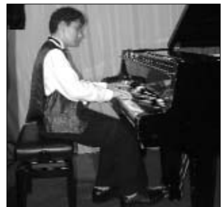
Ilustrační foto - (Jaroslav Slavičinský)