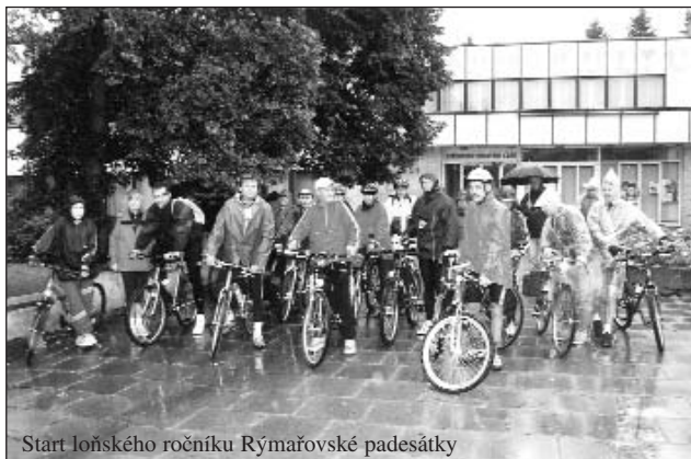
Start loňského ročníku Rýmařovské padesátky